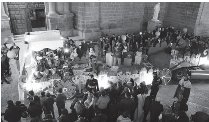
Llegada de los Reyes Magos a la Iglesia Parroquial

De nuevo, gracias a la colaboración de la ciudadanía y a la buena coordinación de Policía Local, Protección Civil, voluntarios y participantes en el desfile, todo ha transcurrido sin incidentes y según lo previsto en la noche más mágica del año.