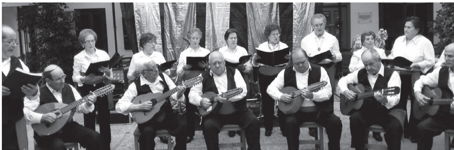
Miembros de la Rondalla del Centro de Día "Casa de Don Manolito" actuando en la Fiesta de Navidad