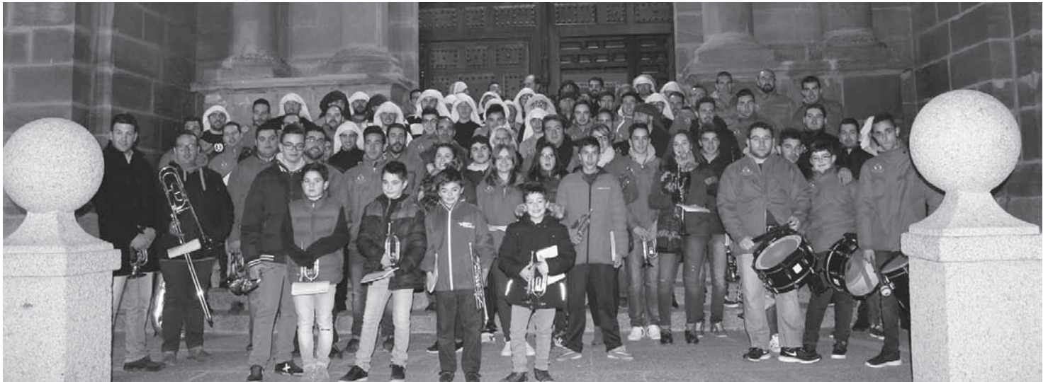
Miembros de los costaleros de Ntro. Padre Jesús Nazareno y de la Banda de Cornetas y Tambores Ntro. Padre Jesús Rescatado en el I Ensayo Solidario

Se ha contado con la colaboración de varias empresas infanteñas y de numeroso público, que a pesar de la fría noche acudió a la llamada de la solidaridad.