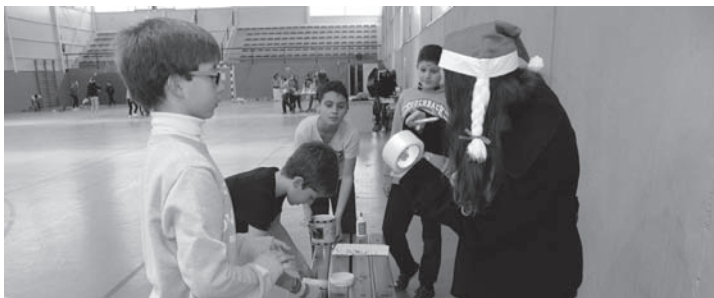
Gymkana organizada en el pabellón del Colegio García Bellido

El Pabellón del Colegio Público Arqueólogo García Bellido acogió la Gymkana navideña en la que participaron nueve grupos de jóvenes y adolescentes y que forma parte de la programación de la Universidad Popular; cantar un villancico comiendo un polvorón, envolver regalos con los ojos tapados, carrera de sacos y adivinanzas, construir instrumentos musicales navideños con material reciclado o relevos con espumillón, fueron algunas de pruebas que tuvieron que superar.