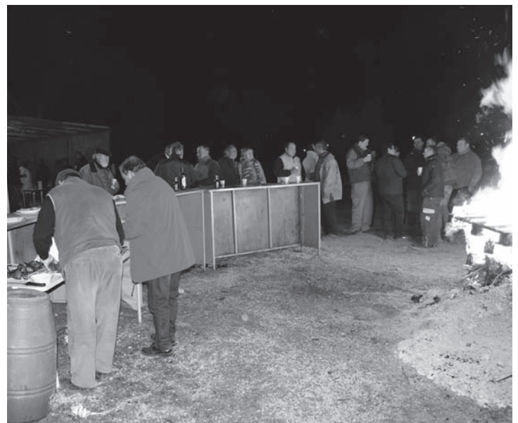
Vecinos e infanteños en general participaron en la invitación de la Cofradía