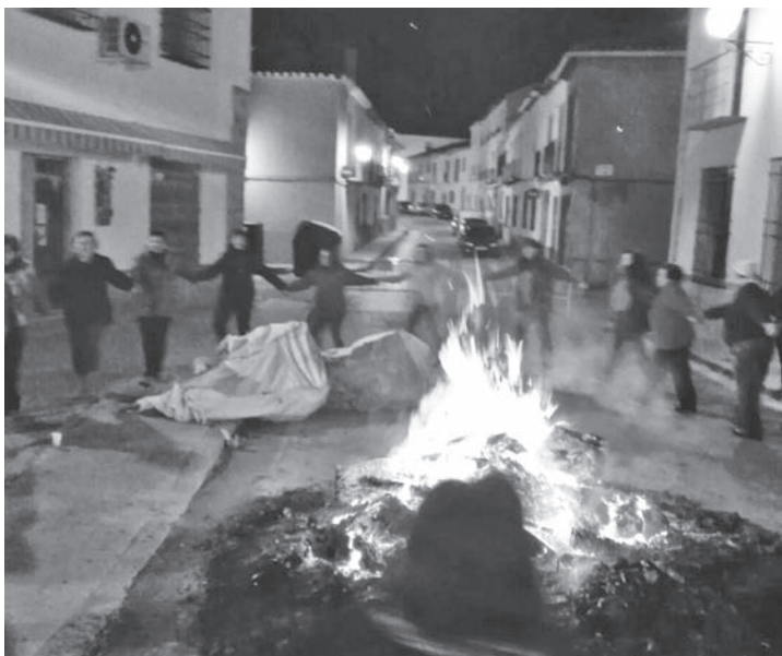
Canciones de corro en La Tercia alrededor de la hoguera