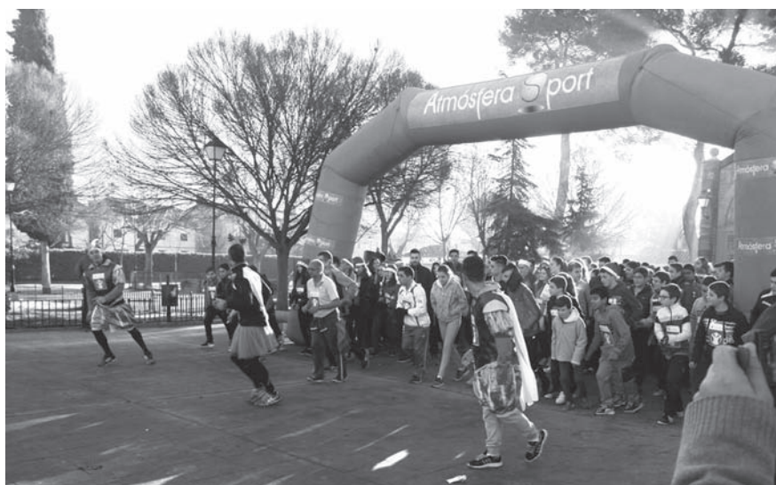
Una de las actividades deportivas organizadas por el I.E.S Fco. de Quevedo

El proyecto incluye actividades de formación para los responsables de cada uno de los programas, así como para el coordinador del proyecto. La primera actividad de formación reunió a los 50 coordinadores de los proyectos seleccionados en Alcázar de San Juan en dos jornadas donde se presentaron las directrices a seguir así como la presentación de distintas experiencias docentes en el marco de este proyecto innovador por los contenidos y metodología aplicada.