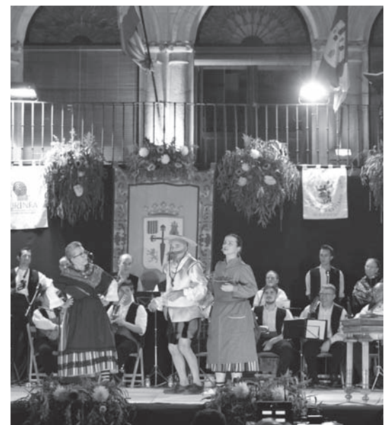
La Asociación Folclórica Cruz de Santiago en las Jornadas de Folclore del pasado año

(Sencillo homenaje a vuestro trabajo y éxitos de un ciudadano admirador de vuestras actuaciones)