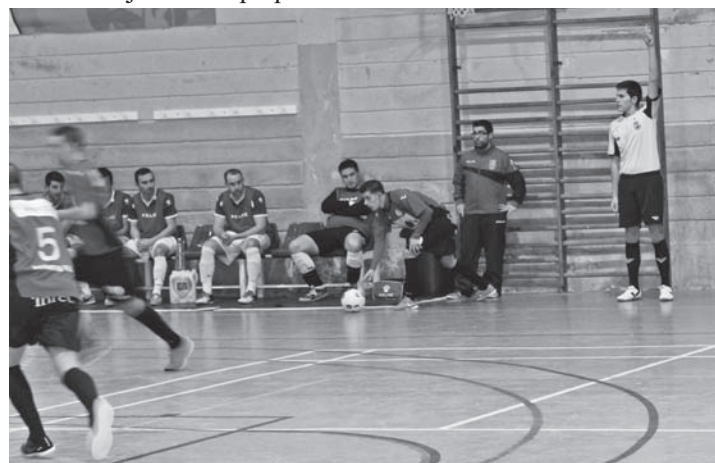
El pasado domingo día 15 comenzó la segunda vuelta ante el Real Betis B, en el que se cosechó un empate El próximo partido el Infantes F.S recibirá al Sporting Constitución