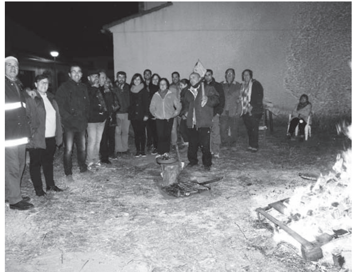
Grupo de vecinos del Barrio del "Charrascal" que no se perdieron la ocasión