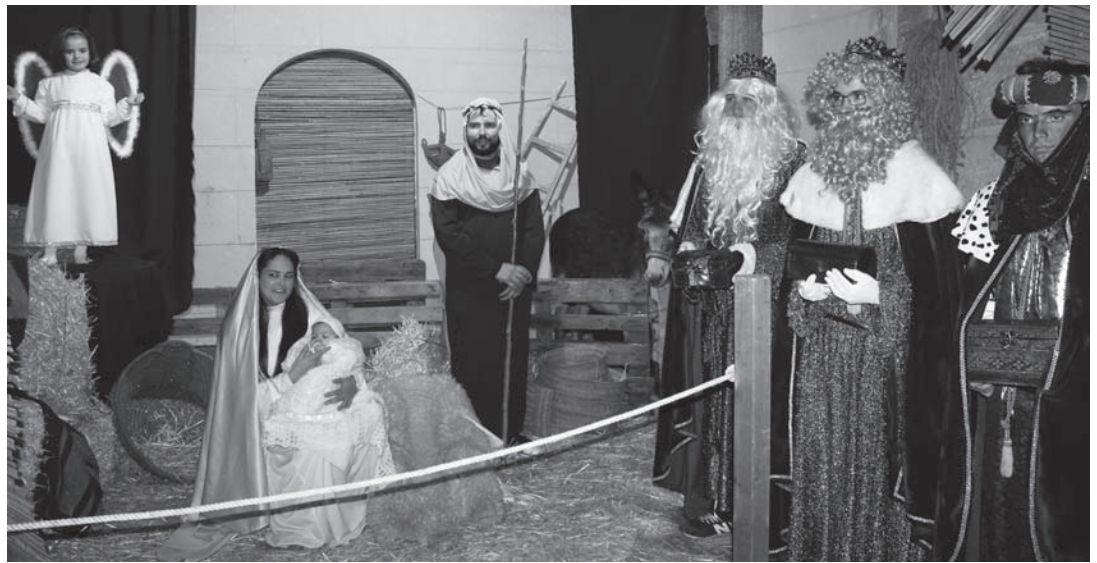
Recreación del Portal en el Belén Viviente

Se calcula que unos 1600 visitantes, vecinos de la localidad y de la comarca, se han acercado para sentir en “vivo y directo” esta iniciativa que nos asentaba en cuestión de segundos por los parajes de Judea en los tiempos del nacimiento de Jesús.