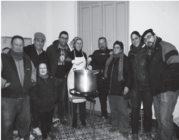
Algunos miembros de la Cruz de Santiago haciendo el chocolate de San Antón

La fiesta mayor se siguió en esa misma noche en torno a la Ermita de San Antón donde se congregó la cofradía acompañada de numerosos infanteños en torno a la gran luminaria, en una fría y desapacible noche. Al día siguiente, día de la Festividad se celebró la Santa Misa y más tarde la bendición de los animales por el cura Párroco, Agustín Garrido.