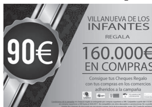
Portada de la Chequera de la promoción

euros en descuentos. Con esta actividad, finalizan las promociones especiales llevadas a cabo con motivo de la campaña navideña, que arrancaba con la jornada de descuentos "Infantes de color" y el sorteo de la "Cesta de los Regalos" valorada en 1380€.