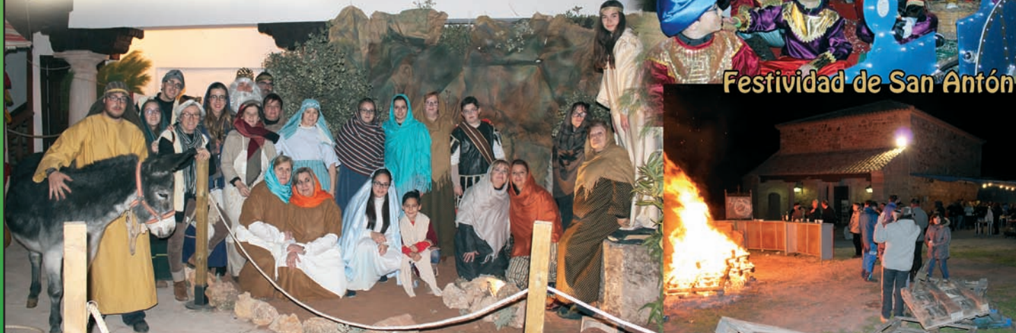
Festividad de San Antón