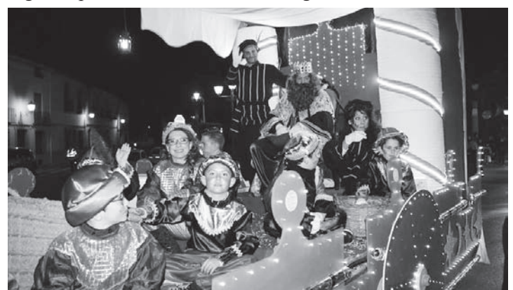
Niños y Jóvenes participaron en la Cabalgata de una noche mágica