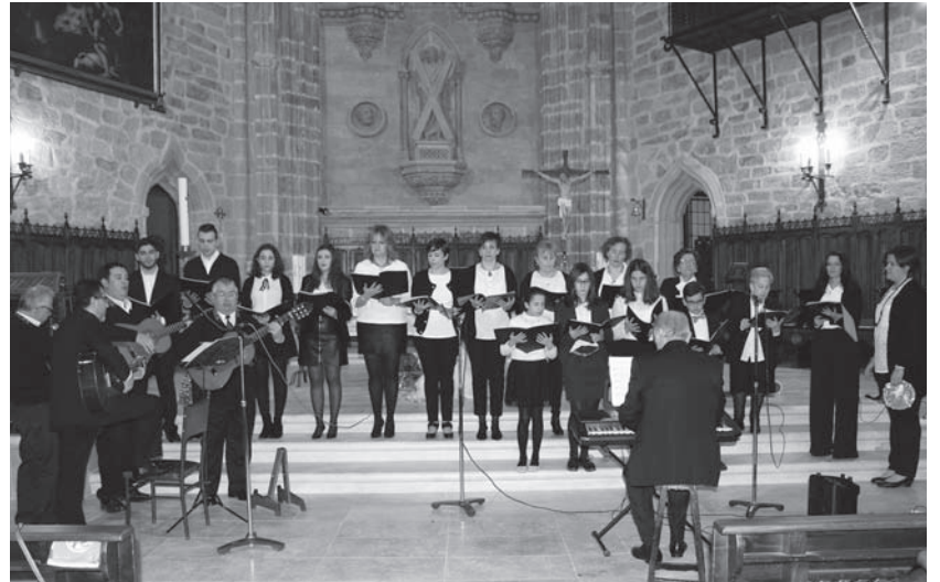
Miembros del Coro Parroquial en el concierto celebrado en la Iglesia en su cuarenta y un aniversario

El Coro Parroquial de Villanueva de los Infantes, que se fundó en 1974, en la actualidad cuenta con una treintena de componentes con edades comprendidas entre los seis y los