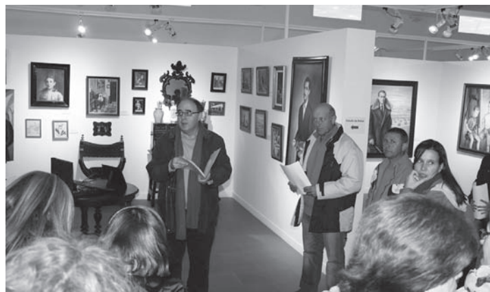
Un momento de la visita

Por último, han accedido al espacio de artistas locales donde han disfrutado con la exposición 'Acuarelas' de Paco Molina y han contemplado la joya pictórica de la Asociación Arteaga Alfaro, una 'Anunciación' del siglo XVII de Matías de Arteaga Alfaro.