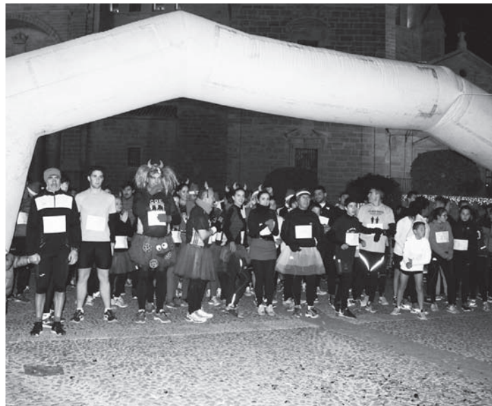
Corredores antes de la salida de la carrera