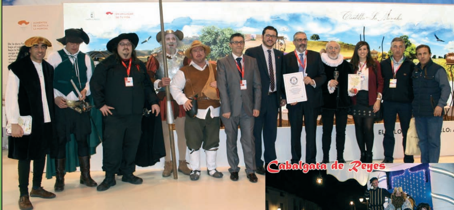
Cabalgata de Reyes