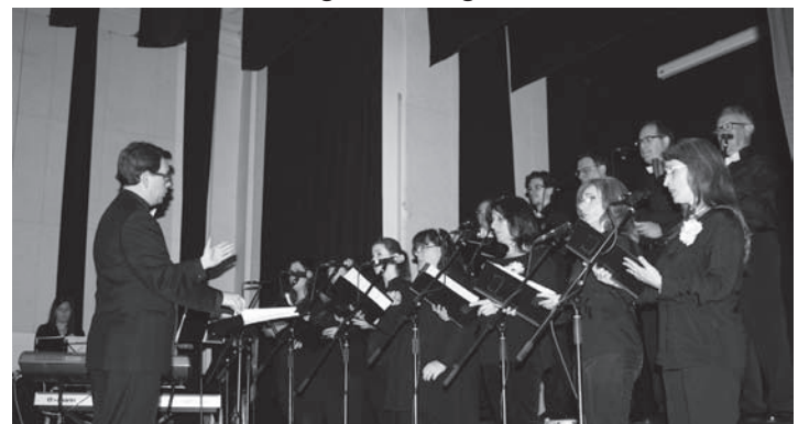
Momento de la actuación del Coro Dulcimer de Valdepeñas