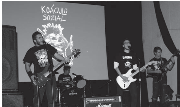
El grupo infanteño "Koágulo Sozial" en el concierto celebrado la pasada Navidad

podieron disfrutar de este evento junto a sus artistas favoritos y con las que el ayuntamiento de Villanueva de los Infantes ha ofrecido la posibilidad a estos jóvenes artistas emergentes a demostrar su talento ante el público infanteño.