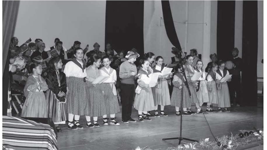
El grupo más joven de la Cruz de Santiago también participó en el Concierto Solidario