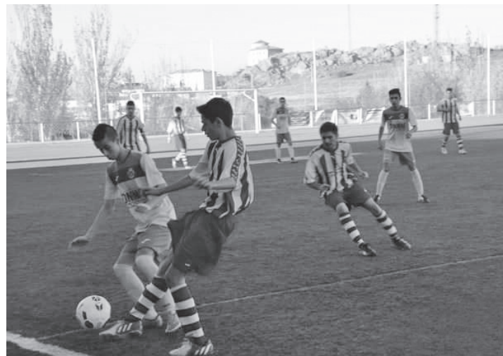
Uno de los partidos del equipo juvenil del C.F. Infantes