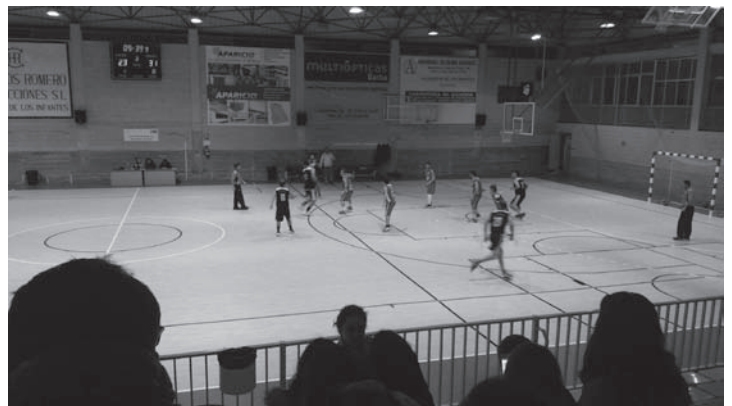
C.B Infantes en la presente temporada

En cuanto a los distintos equipos federados de Fútbol - Sala y Baloncesto, el equipo Panadería Ortiz Infantes F.S. de 2ª Nacional B nos ha brindado con todo tipo de resultados, victoria, empate y derrota, así como la suspensión del partido que le debía enfrentar con Lucena por incomparecencia del rival. Estos han sido los tanteadores del último mes.