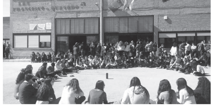
Aspecto del patio durante uno de los actos