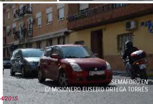
SEMAFORO EN C/ MISIONERO EUSEBIO ORTEGA TORRES