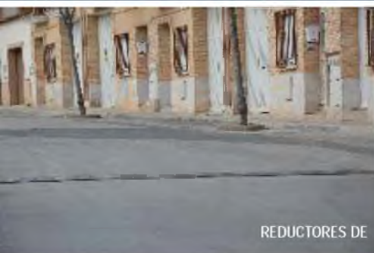
REDUCTORES DE VELOCIDAD

El Plan Extraordinario de Adecuación de área infantil en el Parque Municipal de la Avenida de los