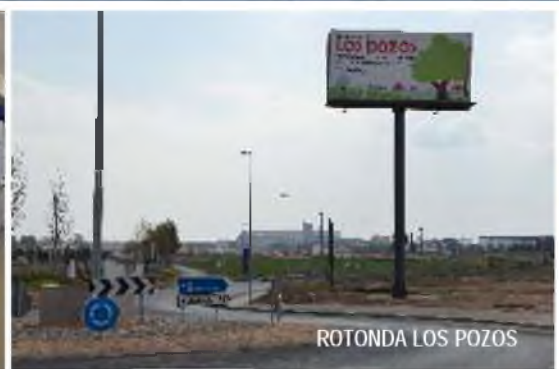
ROTONDA LOS POZOS