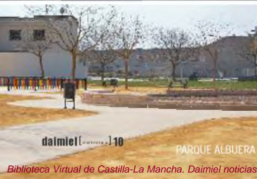
PARQUE ALBUERA Y TUELOS INFANTIL