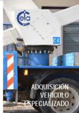
ADQUISICIÓN VEHICULO ESPECIALIZADO