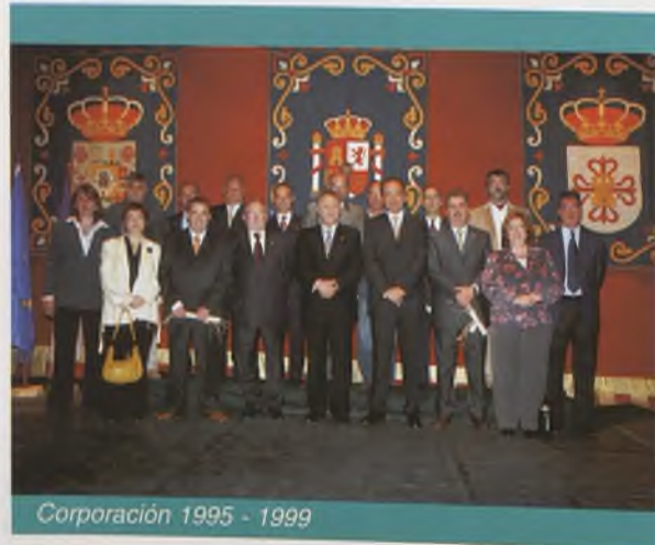
Corporación 1995 - 1999