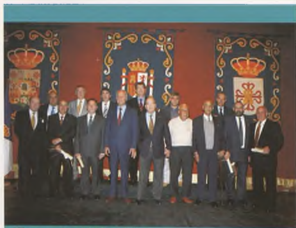
Corporación 1979 - 1983