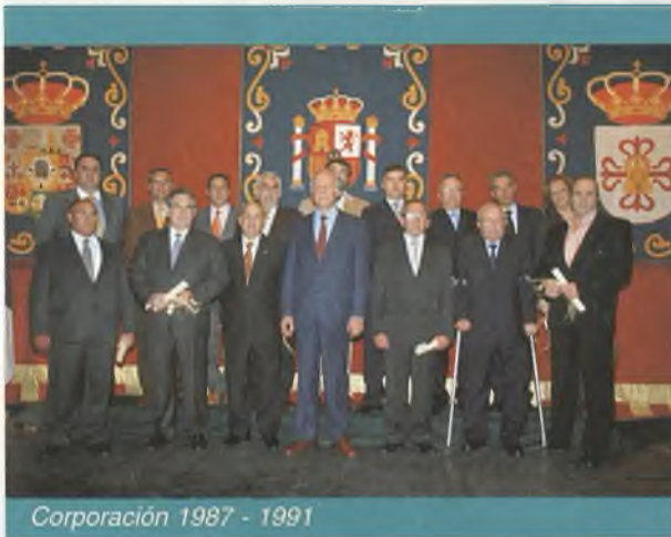
Corporación 1987 - 1991