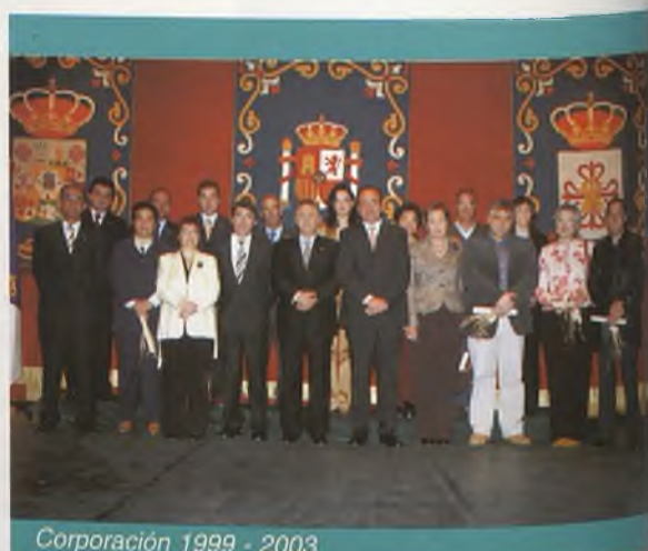
Corporación 1999 - 2003