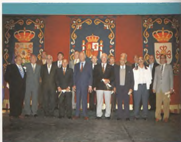
Corporación 1983 - 1987