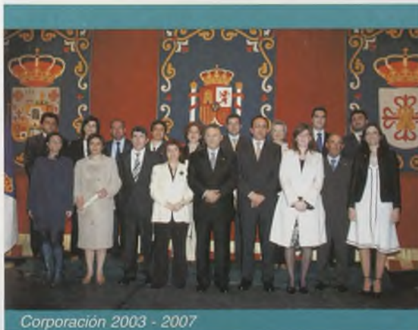
Corporación 2003 - 2007