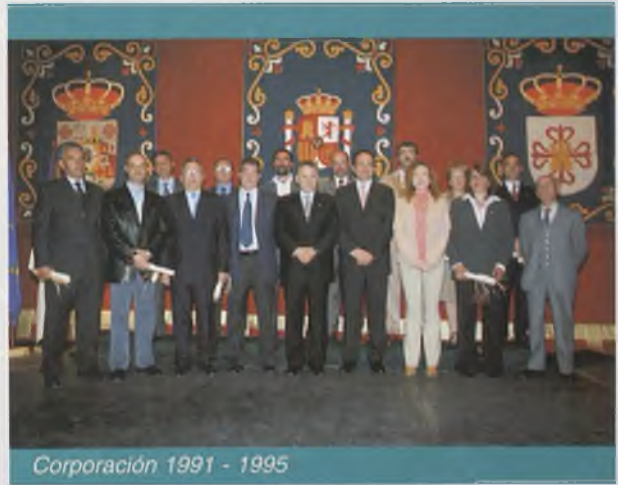
Corporación 1991 - 1995