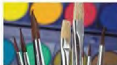
Pinceles de cualquier modelo