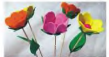
Goma Eva: Adhesiva, Estampada...