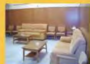
3 Salas de Velatorio