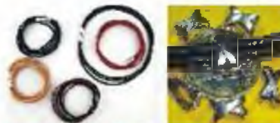
Cordones y Abalorios para Cuero