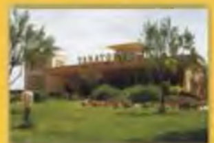
Zona Ajardinada Amplios Aparcamientos

Aunque tenga suscrita una póliza con cualquier compañía,