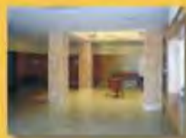
Sala de Tanatopraxia Exposición de Arcas