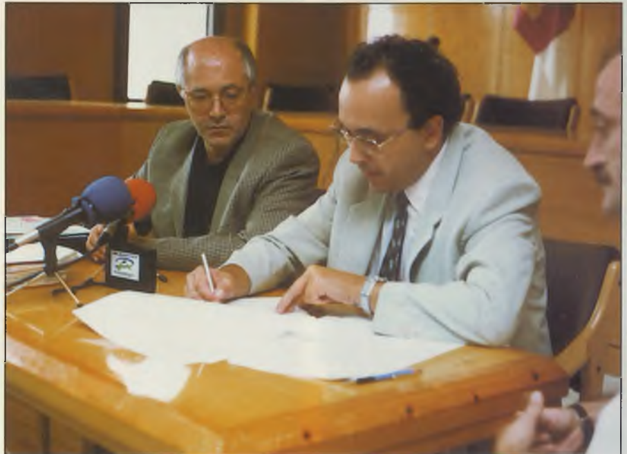
Firma del Convenio entre la Junta y el Ayuntamiento