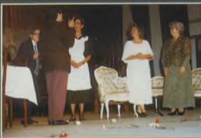
Representación del grupo de teatro "La Caja de Pandora"