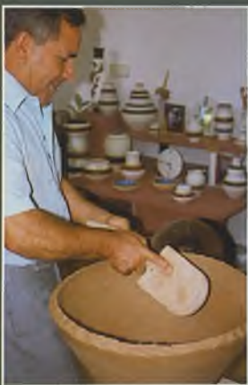
Realización de una tinaja durante la exposición de cerámica, en el Centro del Agua