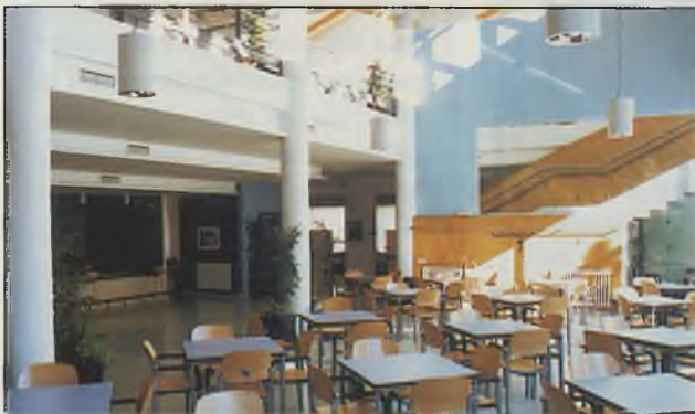
La cafetería y el comedor de amplias dimensiones.