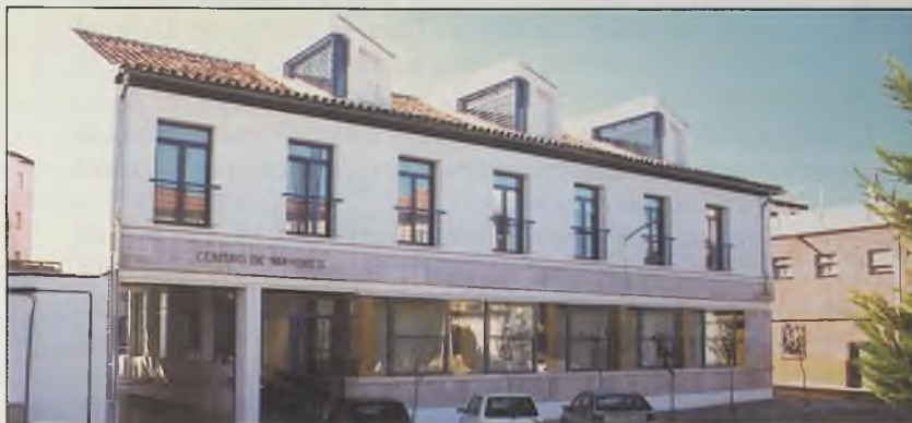
Fachada exterior del Centro de Mayores, frente a la Plaza María Cristina.

Para el Consejero, se trata de un centro «ideal», que reúne la prestación de todos los servicios posibles que se pueden dar a las personas mayores, por lo que será un modelo a exportar al resto de