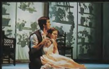
Alumnos del Taller de Teatro