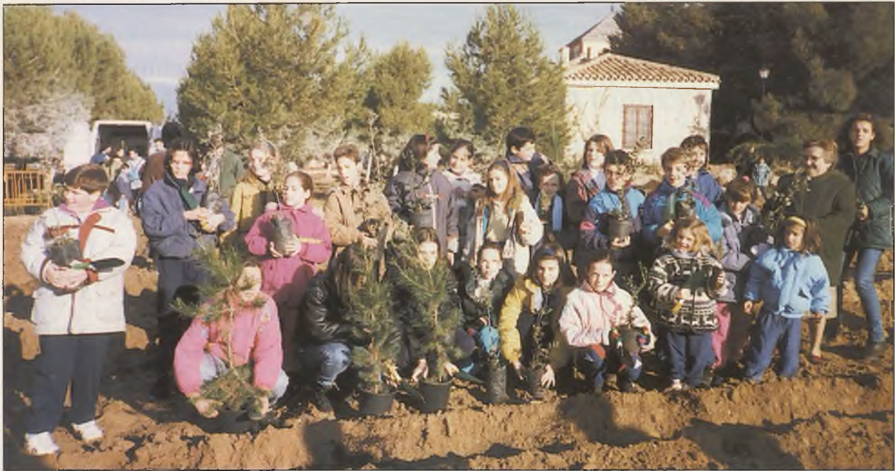
Más de 800 jóvenes y niños plantaron su árbol en el Santuario de la Virgen de las Cruces, en el Día del Árbol.