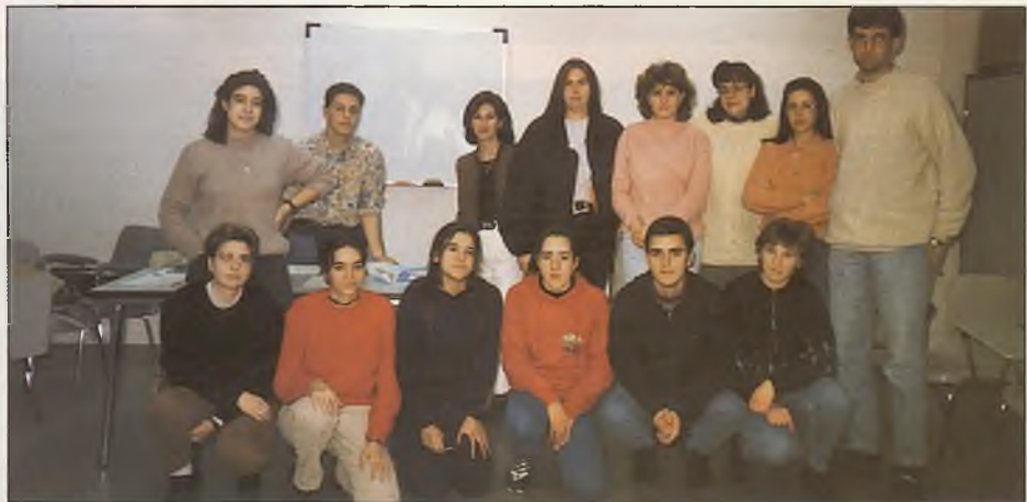
Un total de 25 jóvenes han participado en el Taller de Búsqueda de Empleo celebrado en la Casa de la Juventud.

Esta semana ha destacado por la gran participación de los jóvenes y por su organización, que se ha centrado en temas relacio-