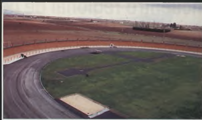
A principios del 97 Daimiel contará con un nuevo estadio, que incorpora, Campo de fútbol, Pistas de Atletismo y Gimnasio, entre otras instalaciones.