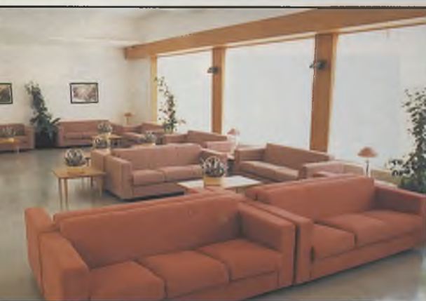
Sala de lectura.

El Consejero elogió, igualmente, las instalaciones de este Centro, calificándolas de «modélicas», al contar con una arquitectura moderna, que viene a romper la idea que se tenía, hasta ahora, sobre estos centros. También ha resaltado el acierto del Ayuntamiento al ubicarlo en una zona cívica de la localidad, lo que permitirá la integración del Centro en el Barrio.