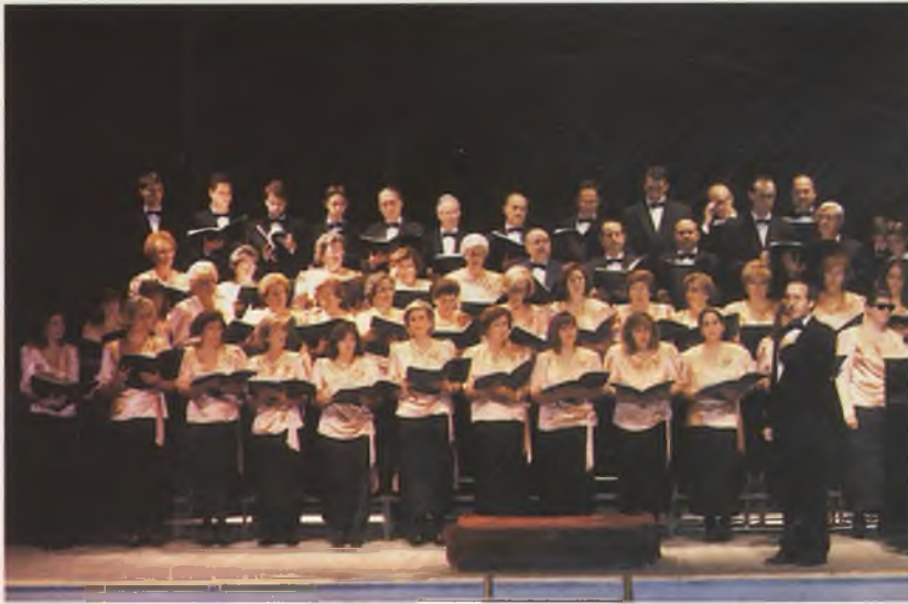
Coral « Molto Vivace de Daimiel » en plena actuación.