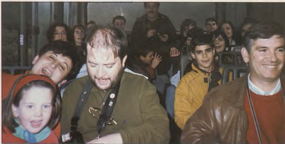
El viaje a Doñana fue una de las actividades más destacadas de esta Semana de la Juventud. Contó con una gran participación.

nados con la ecología y el medio ambiente, la solidaridad, la tolerancia y la integración en el mundo laboral, además de la sexualidad, algo que interesa mucho a los jóvenes.