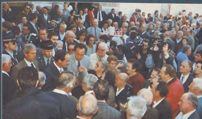
Buño durante su visita a Daimiel para inaugurar el Centro de Mayores