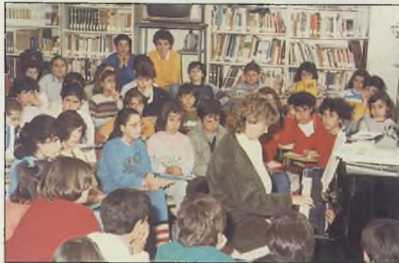
Antiguos alumnos en la Biblioteca del Colegio

Desde la Comunidad Escolar hacemos un especial llamamiento a todos los antiguos alumnos que a lo largo de estos veinticinco años han ido pasando por el Colegio para que participen en este día de celebración. Por ello y para poder organizar lo mejor posible estas actividades, convocamos a todos ellos a una reunión preparatoria que se realizará el próximo 12 de mayo en el Colegio, a las nueve de la tarde. También invitamos a los antiguos alumnos que por diferentes motivos no viven en la actualidad en Daimiel a que hagan un pequeño esfuerzo para que nos acompañen en esta jornada en el Santuario de la Virgen de las Cruces y participen en ella junto con sus cónyuges e hijos.