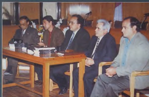
Presentación del libro "Daimiel, secuencias de su memoria", del grupo Bolote