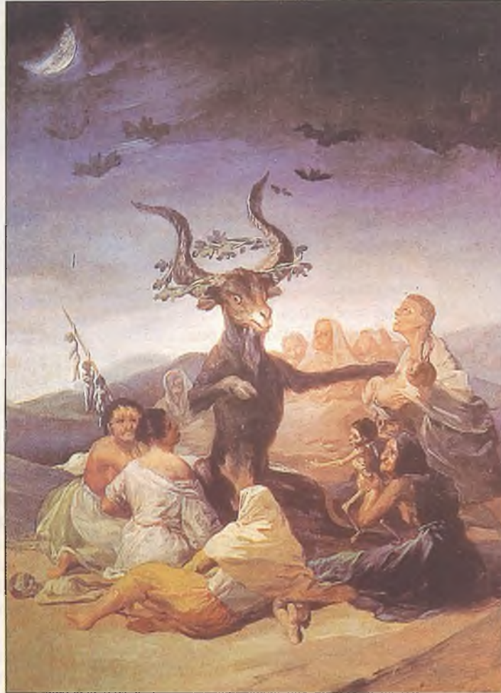
Aquelarre, de Goya

Se cuenta también la existencia de aquelarres, en los que sus asistentes, tras untarse con ungüentos practicaban vuelos para encontrarse con el mismísimo Lucifer que presidía la reunión cometiendo todo tipo de atrocidades. Anteriormente habían hecho un pacto con el diablo firmando un documento con su propia sangre.