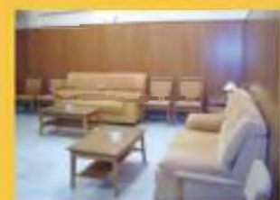
3 Salas de Velatorio