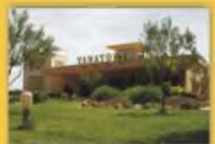
Zona Ajardinada Amplios Aparcamientos

Aunque tenga suscrita una póliza con cualquier compañía,