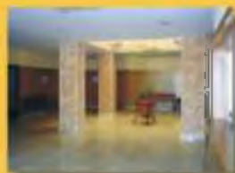
Sala de Tanatopraxia Exposición de Arcas