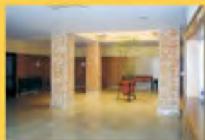
Sala de Tanatopraxia Exposición de Arcas