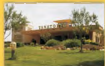
Zona Ajardinada Amplios Aparcamientos

Aunque tenga suscrita una póliza con cualquier compañía,