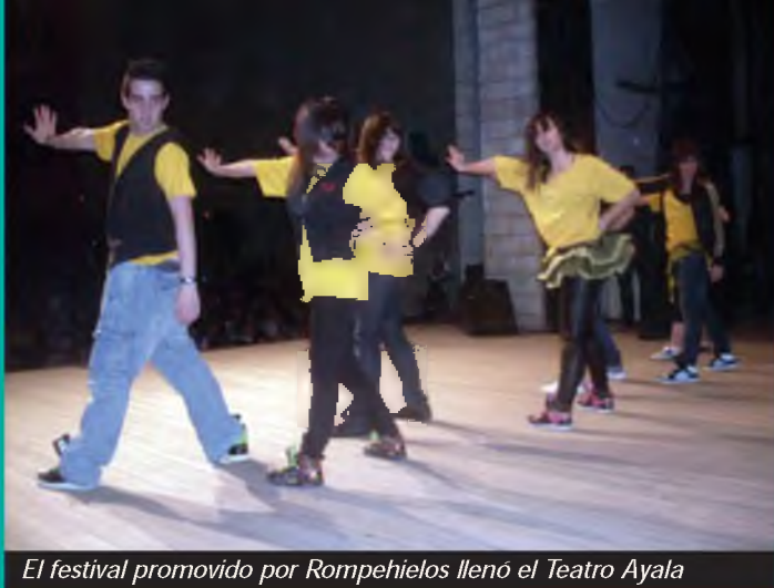
El festival promovido por Rompehielos llenó el Teatro Ayala