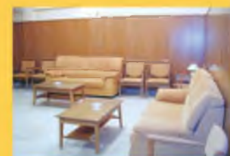
3 Salas de Velatorio