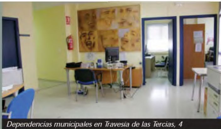
Dependencias municipales en Travesía de las Tercias, 4