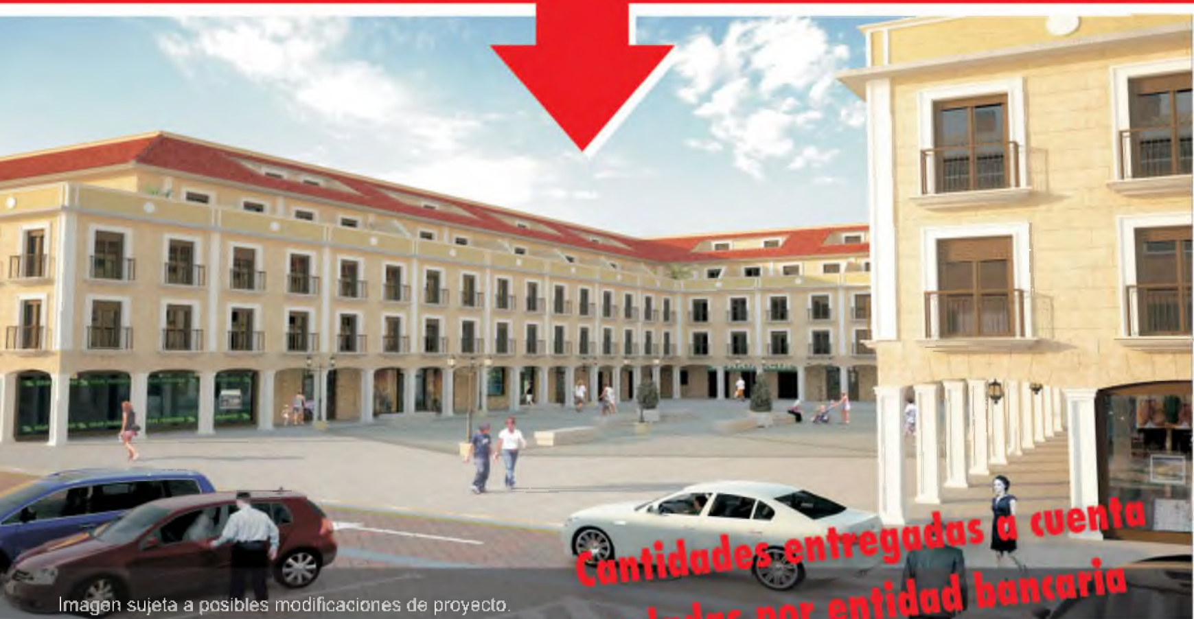
Imagen sujeta a posibles modificaciones de proyecto.

Cantidades entregadas a cuenta avaladas por entidad bancaria