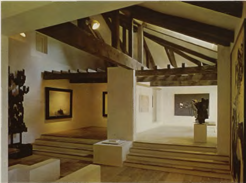
Museo de Arte Abstracto