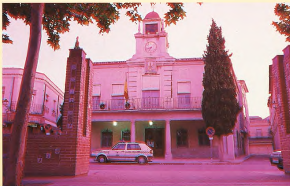
“Ayuntamiento”. Servicio Público, n.º 1 Plaza de España. Torrijos (Toledo)