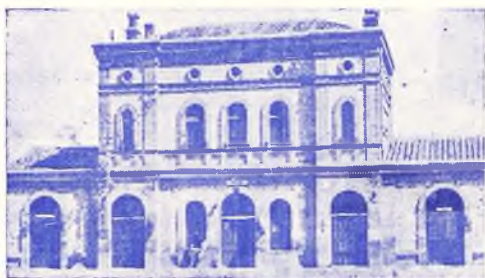
(ESTACIÓN DEL FERROCARRIL.)

Para contribuir al máximo esplendor de esta renombrada Feria, la R. E. N. F. E. ha dispuesto unos