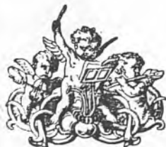
15061-7; a 50 mm. 22

El anticipo sobre los pronósticos más extendidos, quizá haya que imputarlo a un doble efecto: impedir la organización de los nuevos grupos escindido de UCD y rentabilizar el viaje de Wojtyla a España