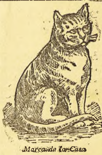
Marqués de San-Casas

Encarnación Ibáñez Da lecciones de planchado en su propia casa, ó á domicilio, á precios módicos. Vende útiles para obtener el brillo y enseña á usarlo. Valbuena, 5.-Valdepeñas