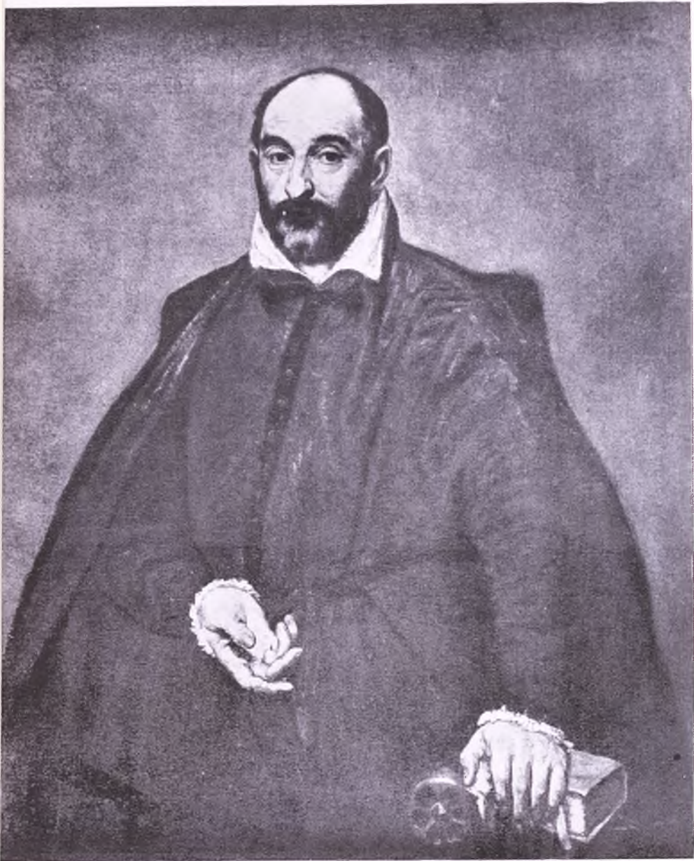
EL GRECO: Retrato del ingeniero Juanelo Turriano (?) Copenhague, Galería Nacional.