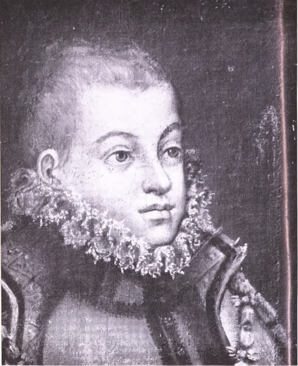
BLAS DE PRADO: El príncipe don Felipe, luego Felipe III. Detalle del lienzo de la Emperatriz Viuda. Toledo, Museo de Santa Cruz.