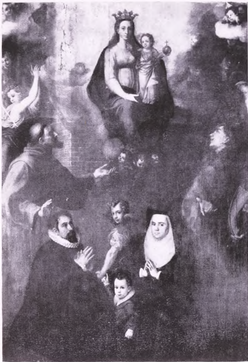
BLAS DE PRADO: La Santísima Virgen (¿de la Rosa?), San Francisco de Asís y San Antonio de Padua, con la familia donante. Madrid, Real Academia de San Fernando.