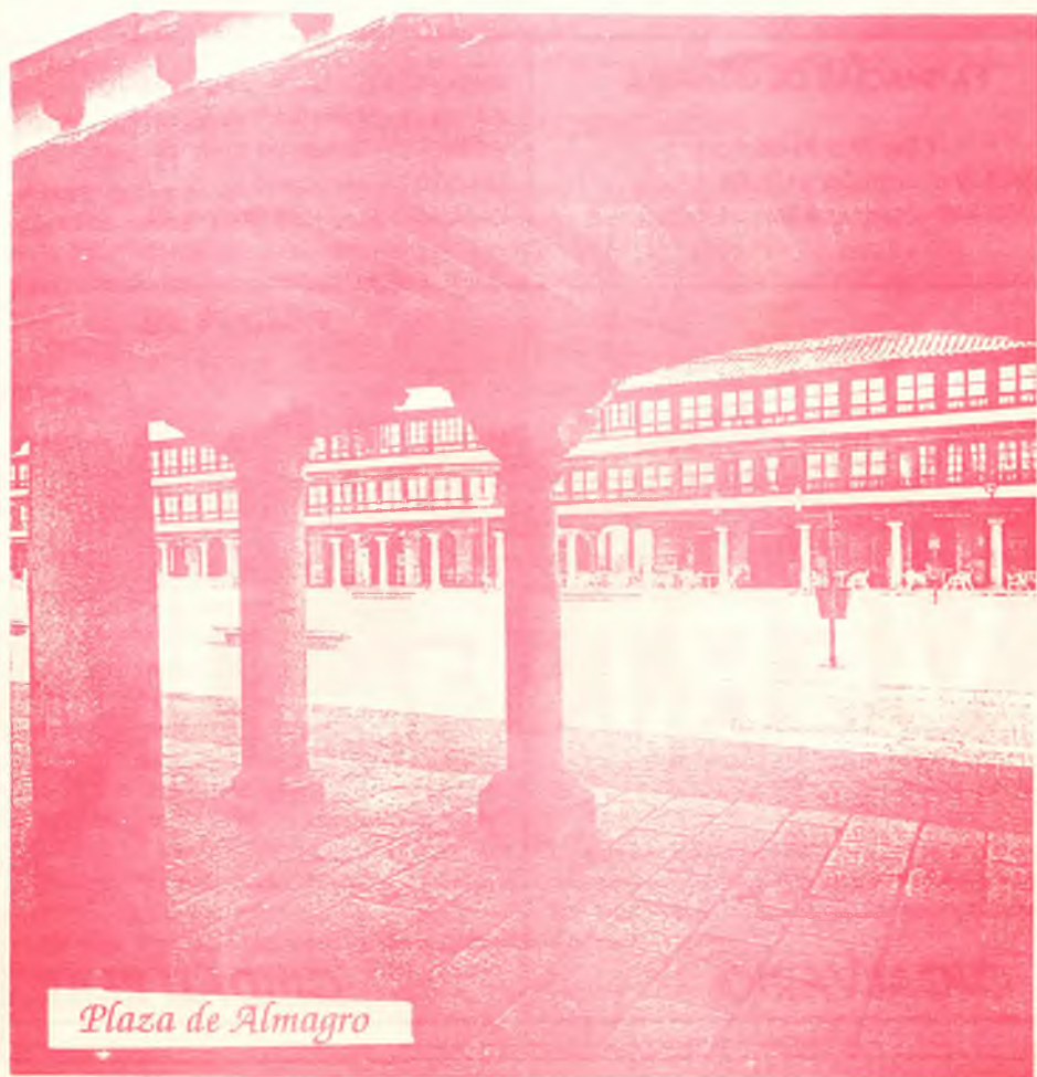
Plaza de Almagro