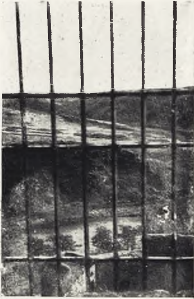
Desde una alta ventana, contemplamos el curso del Guadalén.

ción han sido respetados en el vetusto castillo.