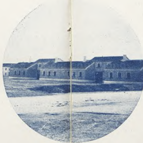
Varios aspectos de la nueva barriada de viviendas, (Fotos Muñoz.)