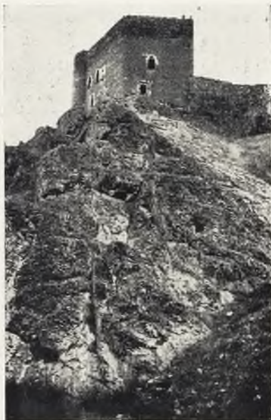
Lo que fuera un tiempo gallarda torre del homenaje.

«¿Qué fueron sino verduras de las eras?».