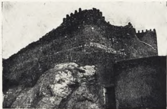
Carcomido portón claveteado cierra el muro exterior.

En la plana de las hazas escriben las yuntas el poema eterno de las barbecheras.