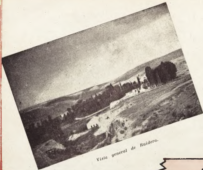
Vista general de Ruidera.