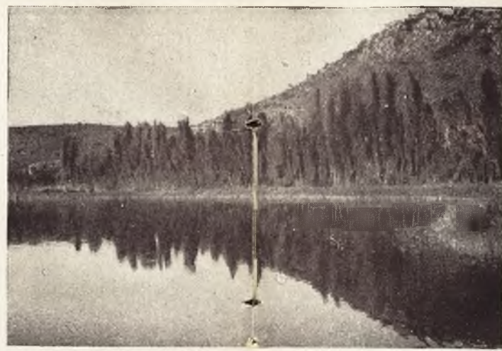
El espejo de las aguas.