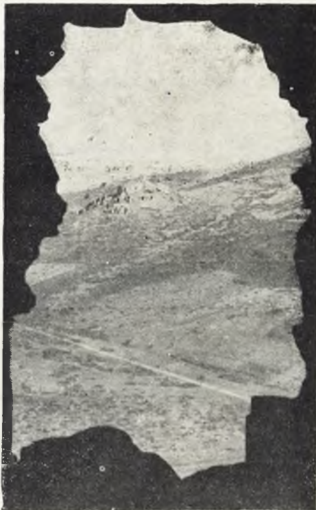
Ruinas del Castillo de Salvatierra vistas desde la fortaleza de Calatrava la Nueva.

Resumiendo, mi querido amigo, entiendo que es injusta la admiración a Calatrava la Nueva, cuando por ella se posterga a Salvatierra y a Calatrava la Vieja,