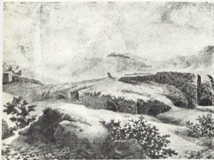
Las ruinas de la fortaleza de Salvatierra en el estado en que se encontraban cuando fueron vistas por Parcerisa. hace casi un siglo. en 1853. Al fondo. las ruinas del Saero Convento.

conseguir nada menos que reducir a Toledo. Diez y seis años después los toledanos de Síndola toman la revancha, destruyendo la fortaleza, que es después reconstruida por los cordobeses del severo emir Mohamed. En 888 los calatraveños intervienen en la devastación de Granada, unidos a los guerreros de Jaén y Regio. Calatrava duerme, después, un sueño paradisiaco durante los buenos tiempos del Califato, sueño feliz que dura hasta su conquista, en 1012, por los berberiscos, los mismos bárbaros que asaltaron Córdoba y degollaron al biógrafo Aben Alfaradhí. En 1033 un tejedor de esteras de Calatrava, llamado Jalaf, intenta suplantarse al califa Hixem, con el que tiene gran parecido físico; pero es descubierto y reducido por los toledanos, después de extinguida una breve dependencia feudal de Calatrava con subordinación a Murcia en tiempos de Zohair (1018). En 1075 y 1079, su gobernador es Ben Ocaxa, posible fundador de Abenójar.