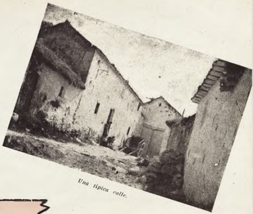
Una típica calle.