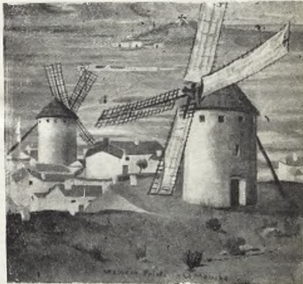
“La Mancha” (Cuadro de Gregorio Prieto).