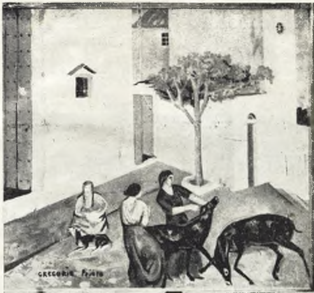
“Patio” (Cuadro de Gregorio Prieto.)