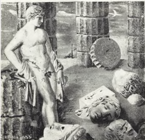
«Grecia» (Cuadro de Gregorio Prieto).

Aquí brilla todo el arte del gran pintor valdepeñero con las más genuinas características clásicas: equilibrio de conjunto, ar-