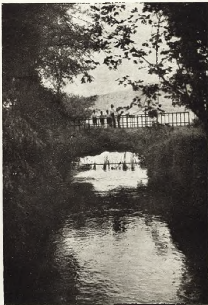
Puente natural sobre uno de los canales ruidereños.