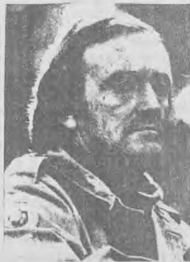
Félix Rodríguez de la Fuente