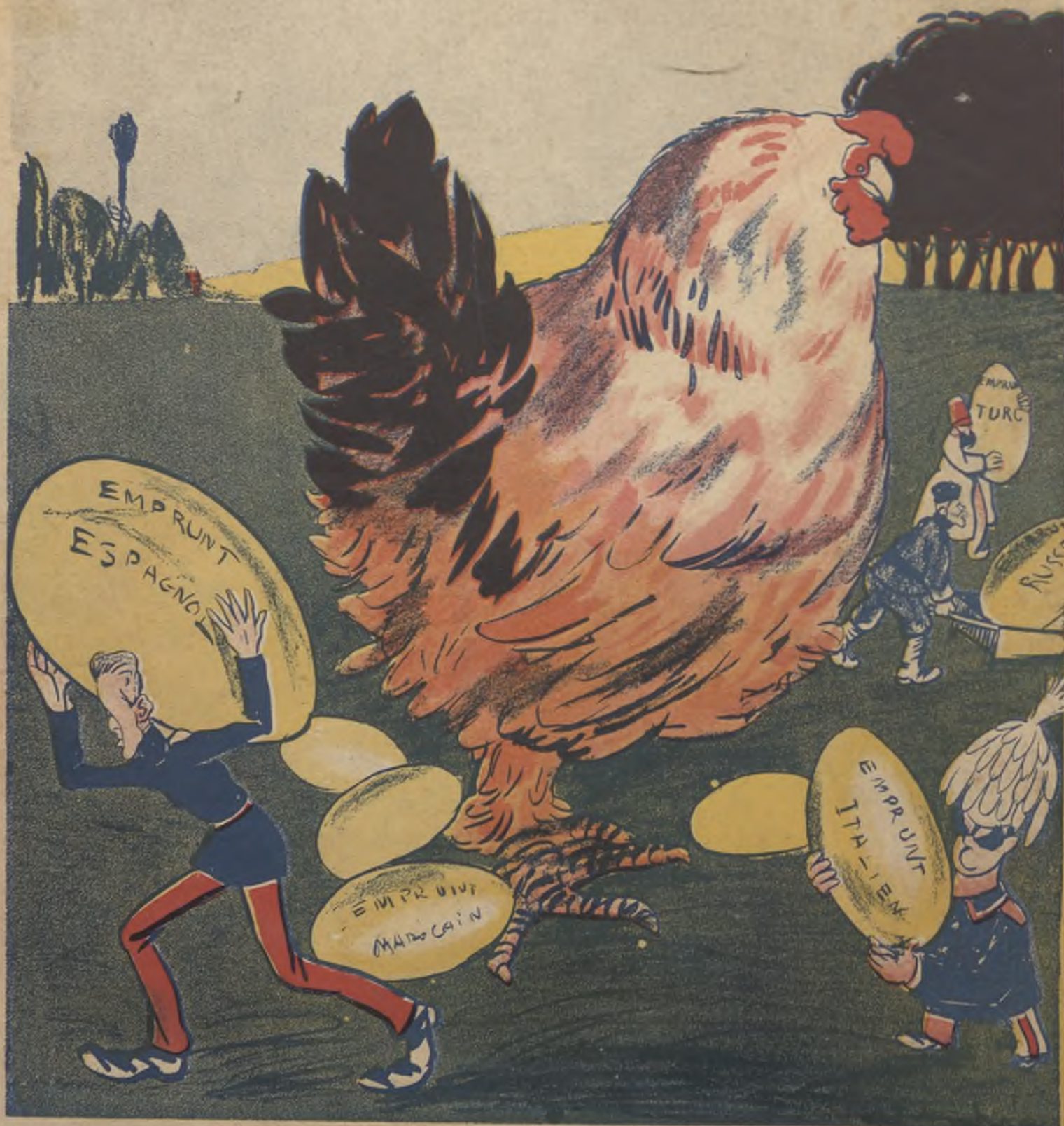
LA POULE AUX ŒUFS D'OR OU L'INEVITABLE EMPRUNT