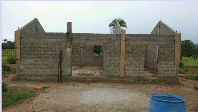
Grupo de mujeres, proyecto "Mostaza"