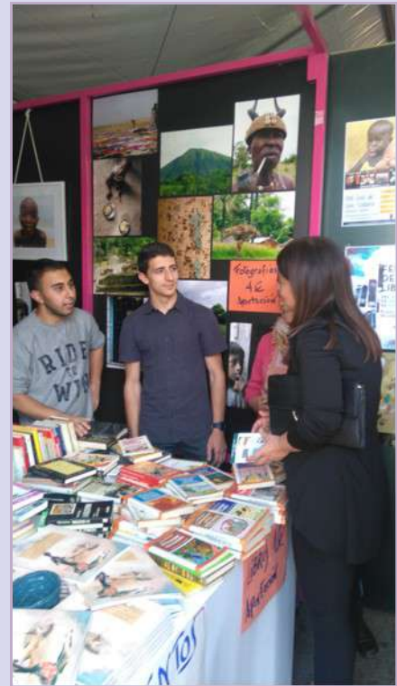
Ilustre visitante (Feria del libro)