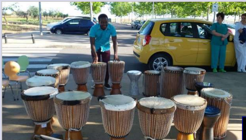
Taller de percusión con niños del Hospital 3/5/17