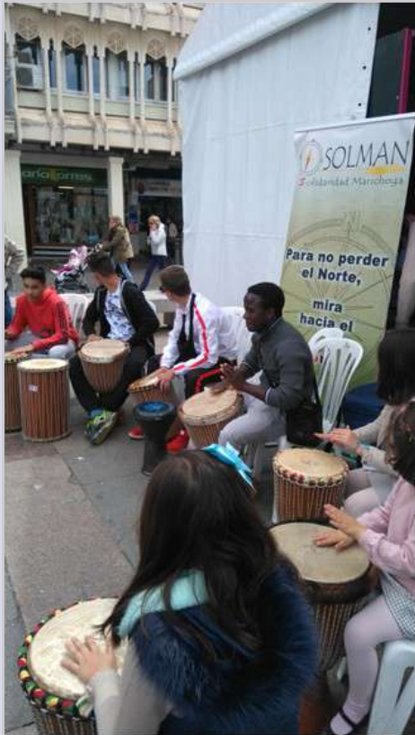
Feria del Libro 23/4/17