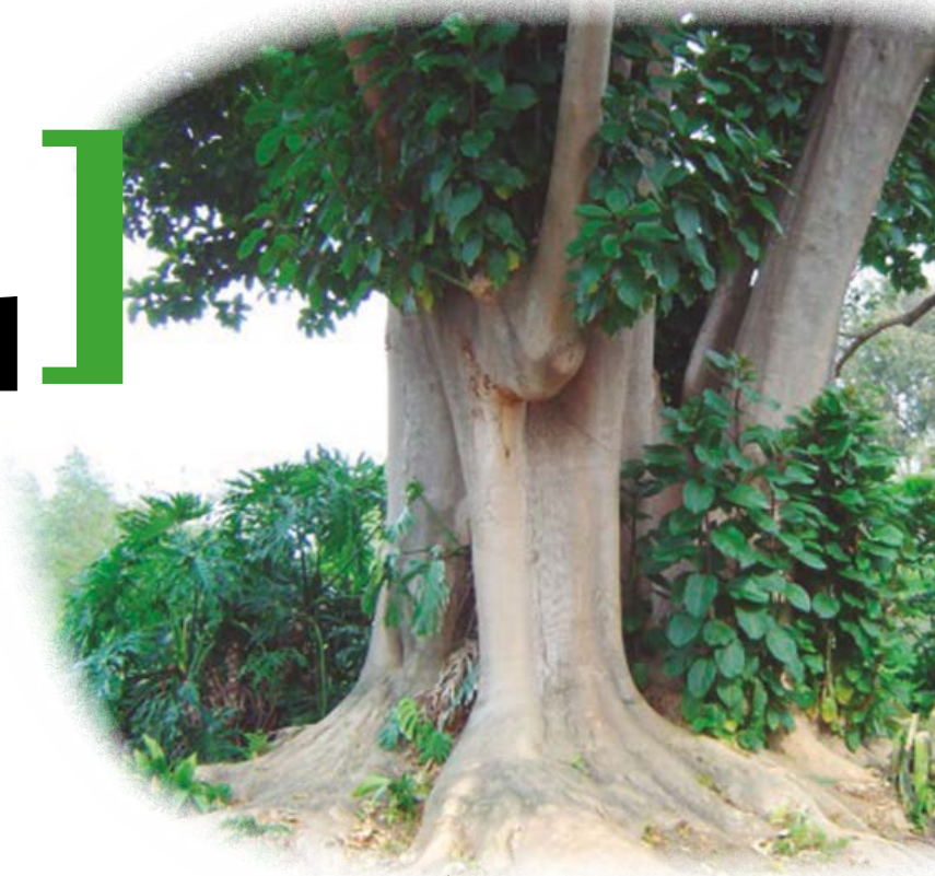
Árbol Ombú de la Pampa guaraní.

los de este parque o aquella floresta ¿se dirán de copa a copa que el muérdago otrota tan sagrado entre los galos