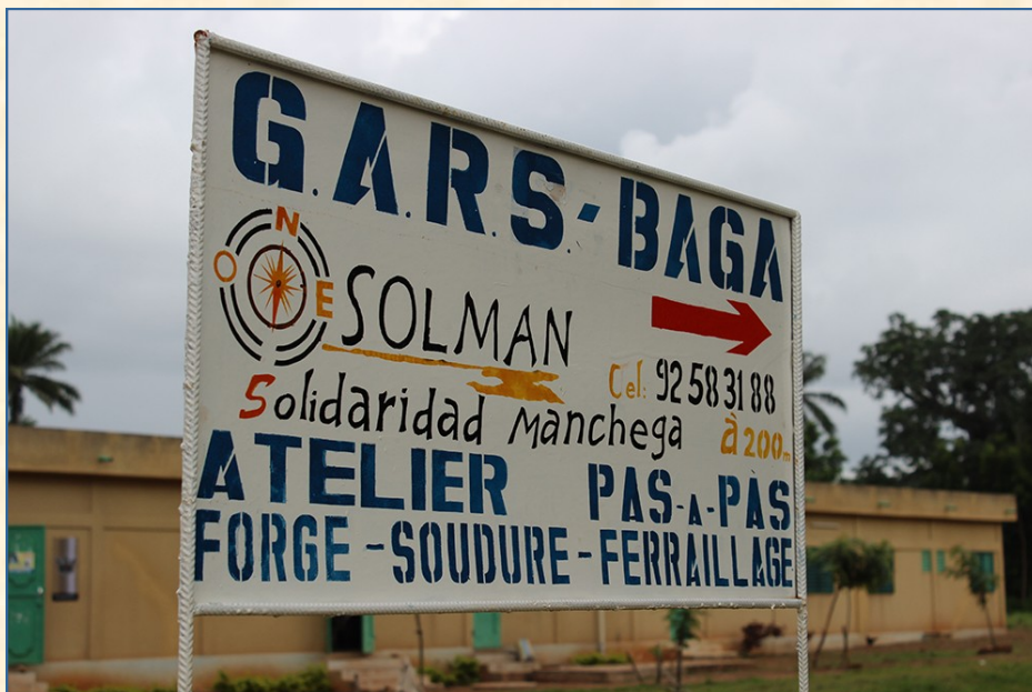
Grupo de artesanos rurales. Togo

Nos hemos vuelto más provincianos y no vemos más allá de nuestras pequeñas fronteras. No sé si no somos conscientes o no queremos serlo de que, hoy día, cualquier acontecimiento que pase en cualquier parte del mundo, nos atañe y, en su medida correspondiente, somos responsables de ello. Dicho de otro modo, el hambre, la pobreza, las injusticias, la mortalidad infantil, la violencia de género y todos los grandes desafíos que padecen en cualquier lugar del planeta la mayor parte de la población mundial, también es cosa nuestra y somos, en la medida que fuere, responsa-