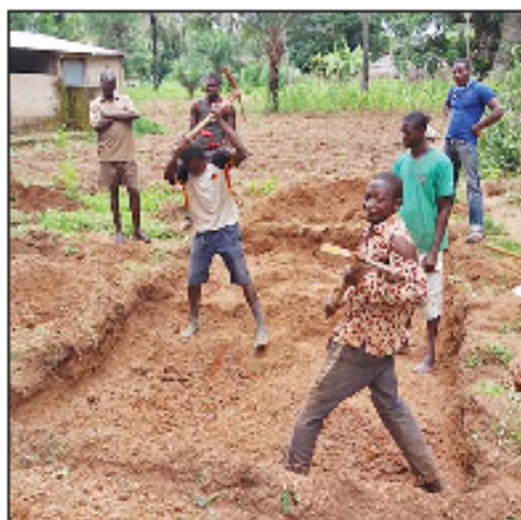
Limpieza de los terrenos e inicio de las excavaciones

Cuando focalizaron la construcción de los pozos surgió la idea de levantar un taller de artesanos y obreros, la posibilidad de una tienda "estable" para las vendedoras ambulantes o unos molinos para moler maíz y no machacarlo a mano. Para todo ello la comunidad contó con la colaboración de la ONG que en-