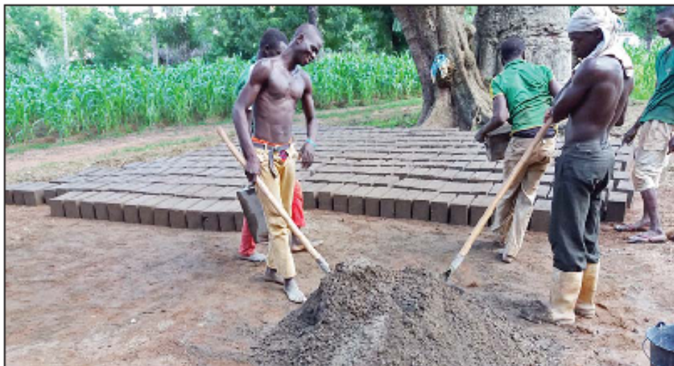
Elaboración de adobes para la construcción de las letrinas

Con la mejora de la higiene y supresión de las aguas fecales se puede evitar hasta un 80% de las enfermedades de la población