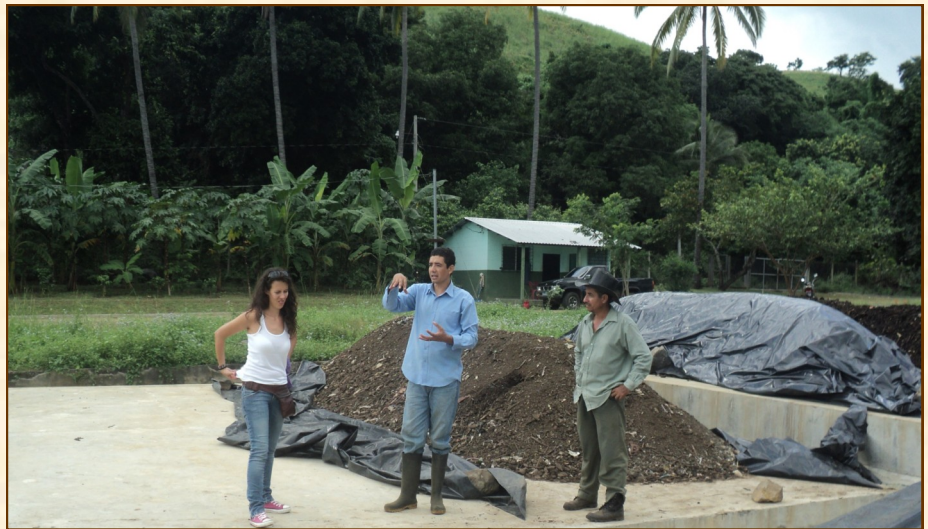
Planta de compostaje. El Salvador

¡Qué indecencia! Qué cortedad de miras, qué visión política del mundo, qué conocimiento, o mejor dicho, desconocimiento de los Derechos Humanos. Y como la gota de agua que va horadando la piedra, así en la sociedad hemos ido perdiendo la sensibilidad y la empatía que, en otros momentos, nos ha hecho vibrar y reivindicar un mundo mejor y posible.