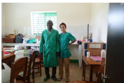
Aula de Salud Samaragou