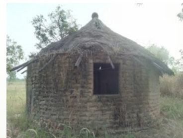
Aula formación en cultivo champiñón