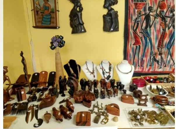
Mercadillo Navideño SOLMAN