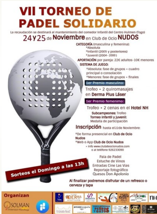
VII Torneo de Pádel Solidario