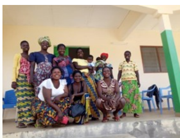
G. Mujeres Boulangerie Owilelen Defalé