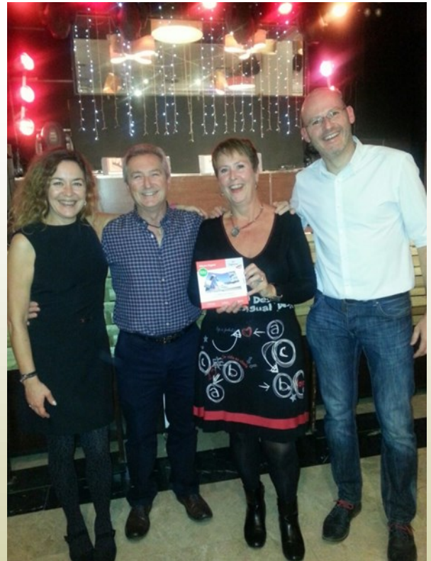
Cena Navideña Solidaria