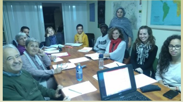
Curso de árabe