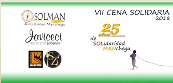
VII Cena Solidaria