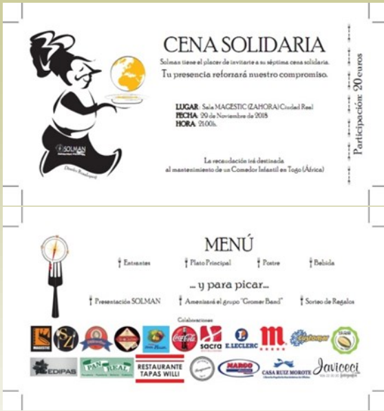
Tarjetón Cena Solidaria SOLMAN