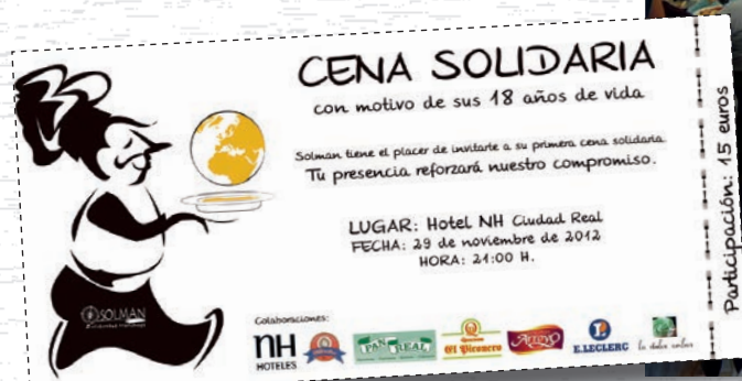
Tarjeta de Invitación