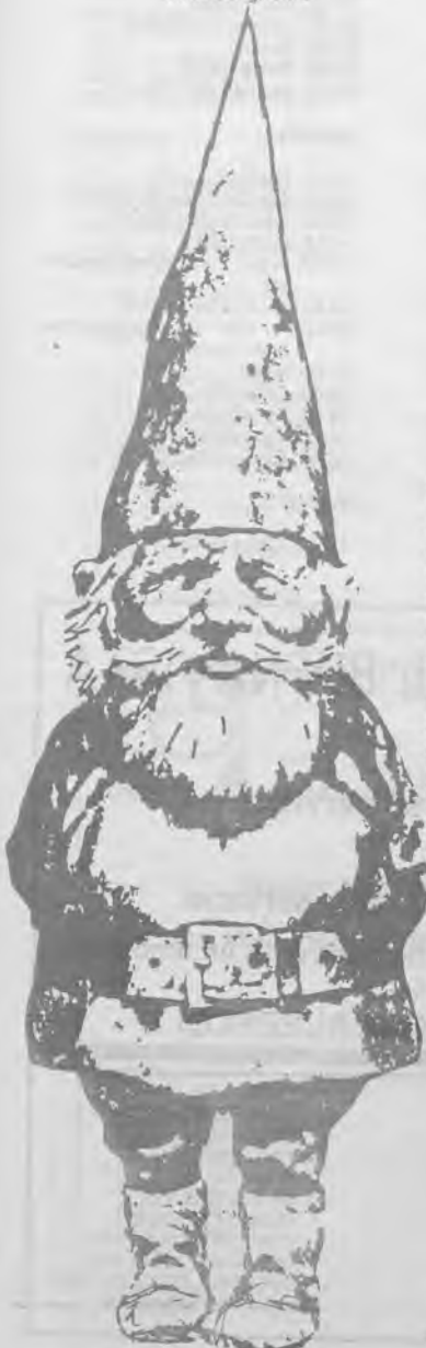
David, el gnomo