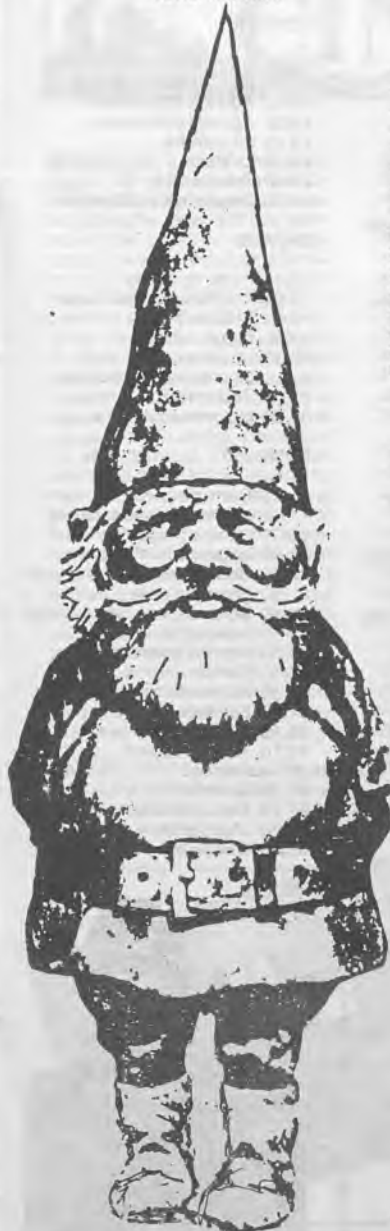
David, el gnomo