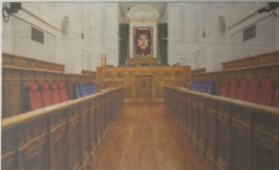
Castilla-La Mancha tendrá la cámara territorial con menor representación de España.

La reforma propuesta por el Partido Popular reduce el Parlamento regional de 49 a 33 diputados, veinte menos de los que deberían elegirse tras la ampliación de la ley que la propia