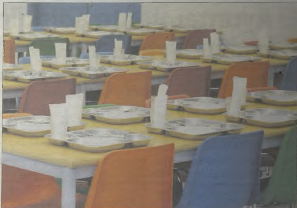
El Gobierno regional no abrirá los comedores escolares, a pesar de que las ONGs alertan de que muchos menores la única comida que hacen al día es la que realizan en el centro escolar.

Cospedal, que ya eliminó el 95% de las becas de comedor, se niega un año más a abrir los comedores escolares en verano