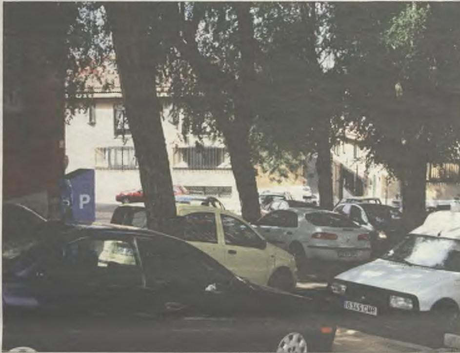
La necesidad de aparcamiento en la zona de la Plaza de Dávalos es evidente.

El propio alcalde lo dejó claro en el último pleno municipal: dijo que se pueden hacer pequeñas modificaciones en la ejecución de la obra, pero sin que supongan cambiar el proyecto. Y añadió que "he recibido felicitaciones por cómo se ha tratado el asunto por numerosos vecinos" del entorno de la plaza de Dávalos, algo que no parecen compartir los residentes y