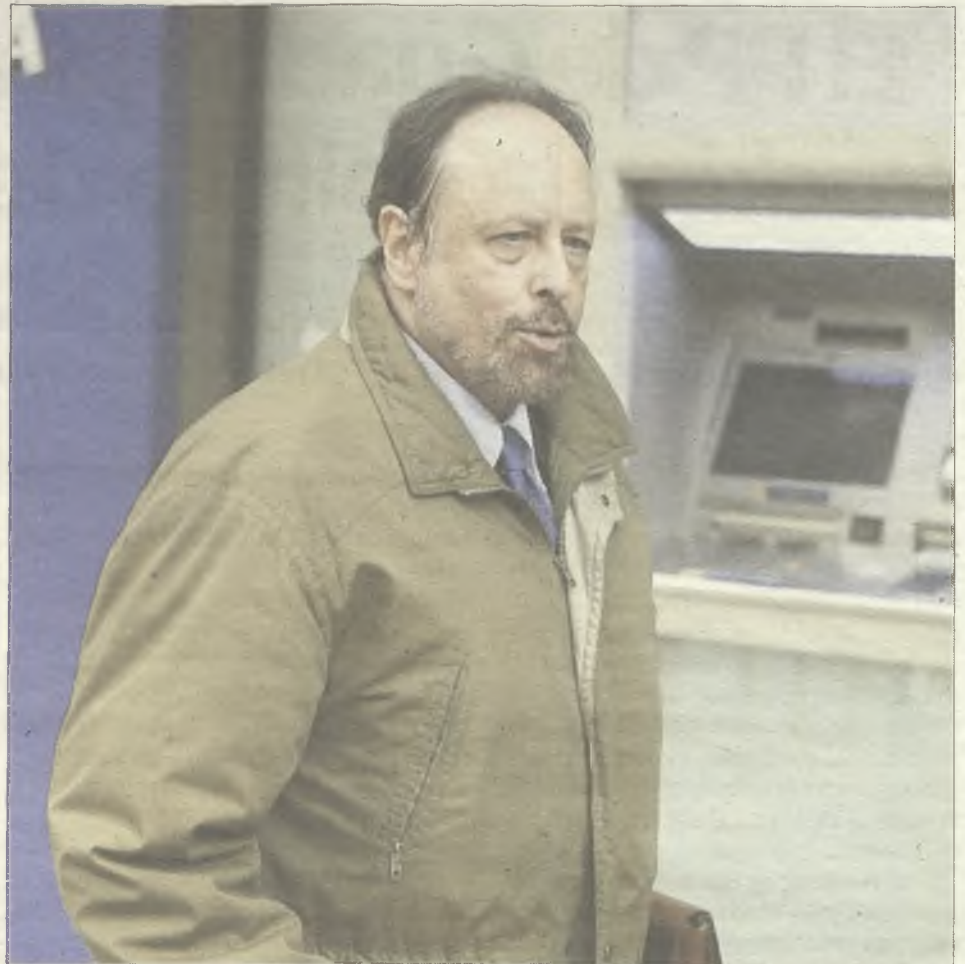
Luis Fraga, ex senador del PP por Guadalajara, a su llegada a la Audiencia Nacional.

Castilla-La Mancha es la región más vulnerable a este problema, por delante de Andalucía y Extremadura. Las personas afectadas por pobreza energética viven en casas mal aisladas, sin la adecuada envolvente térmica o con un ineficaz sistema de calefacción.