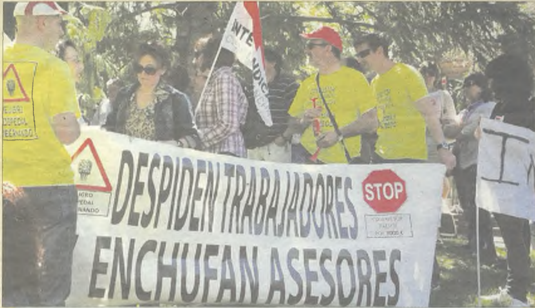
Los conductores del Gobierno regional en la manifestación del 1 de Mayo

Llevan más de seis meses defendiendo su puesto de trabajo. Se han manifestado, se han encerrado y han explicado que Cospedal pretende sustituirlos por personal nombrado a dedo. A pesar de la falta de respuesta de la Junta, mantienen la lucha.