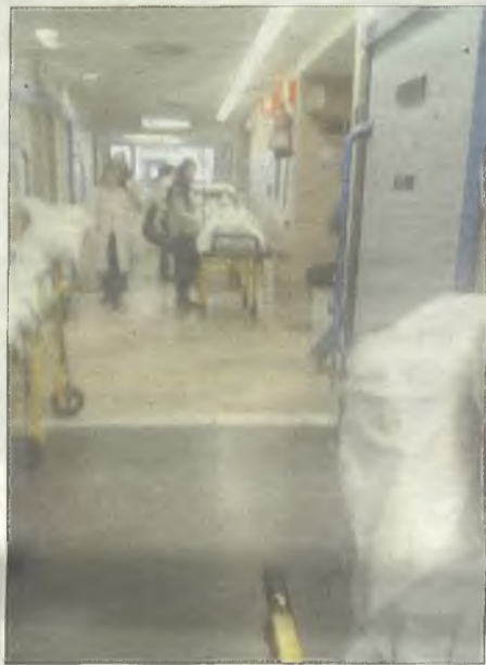
Camillas con pacientes situadas en un pasillo del servicio de Urgencias del hospital de Guadalajara, el pasado mes de febrero.

Esto le ha ocurrido en su faceta de paciente, pero también en su labor profesional ha visto cómo en los últimos años llegaban instrucciones para enviar pacientes a otros centros de Castilla-La Mancha, en vez de continuar derivándolos a Madrid, pese a que los tiempos de espera se multiplicaban con el cambio.