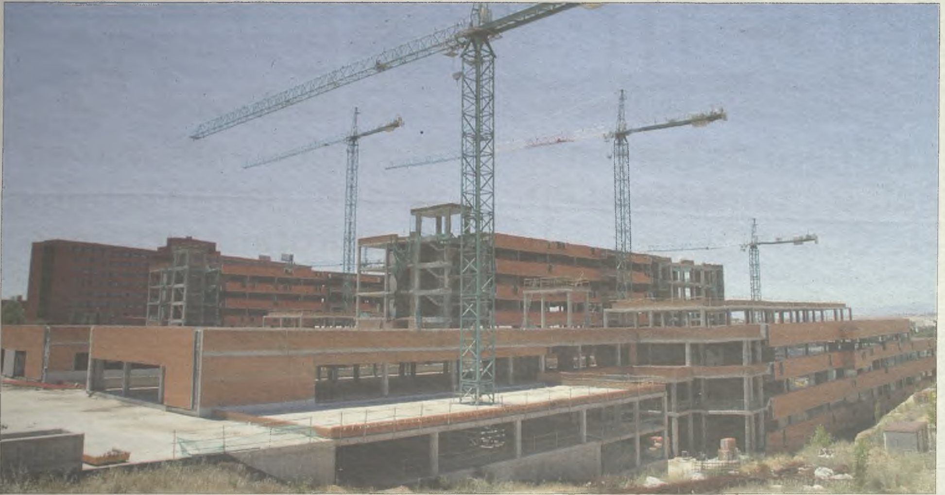
Estado actual de las obras de ampliación del hospital de Guadalajara, paralizadas desde julio de 2011.