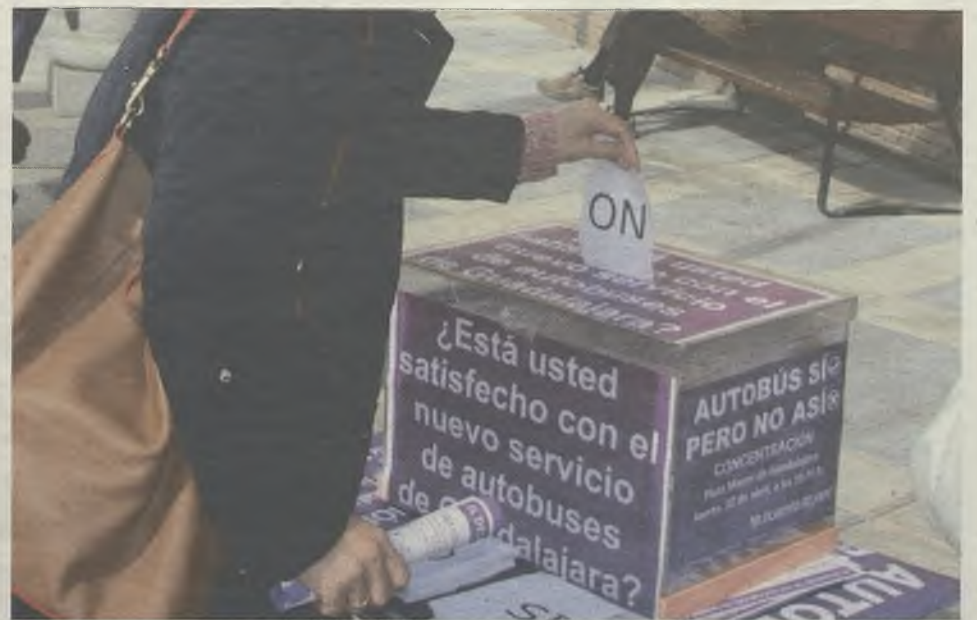
Consulta ciudadana sobre los autobuses: de 2.000 participantes, solo 6 dijeron estar satisfechos.

de ello el Grupo Socialista, que la empresa adjudicataria ha presentado al Ayuntamiento escritos en los que reclama 1,5 millones de euros más de la subvención de 3,2 millones que se había fijado para el primer año del nuevo servicio, sin que el equipo de Gobierno de Román haya desmentido estas cifras hasta el momento.