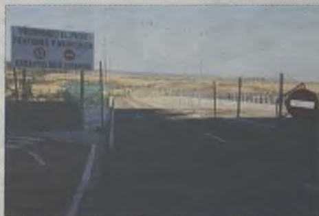
Arriba, puente de Dalí, cerrado a la ciudadanía. Abajo, intersección junto al puente Árabe.

El alcalde ha prometido la apertura del puente y de todo el sector, de forma sucesiva, para las ferias de 2010, de 2011 y de 2012, pero se acercan las ferias de 2014 y la infraestructura sigue cerrada. Para poder abrirlo, es necesario que el Ayuntamiento recepcione las obras, algo que puede hacer de oficio o a instancias del agente urbanizador.