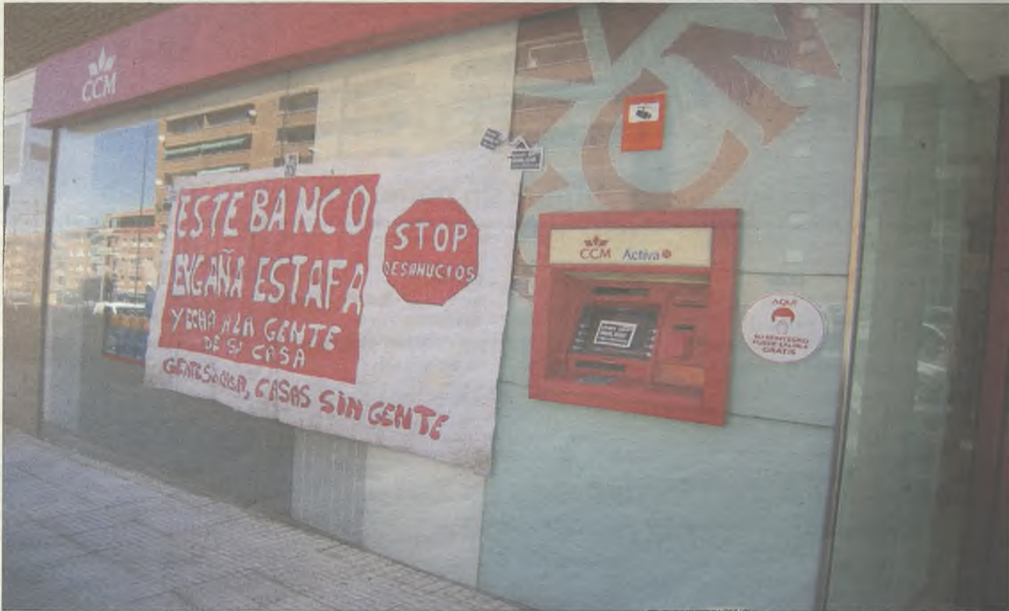
La última acción reivindicativa de la PAH se realizó la semana pasada en la sucursal que CCM tiene en la calle Sigüenza de la capital.