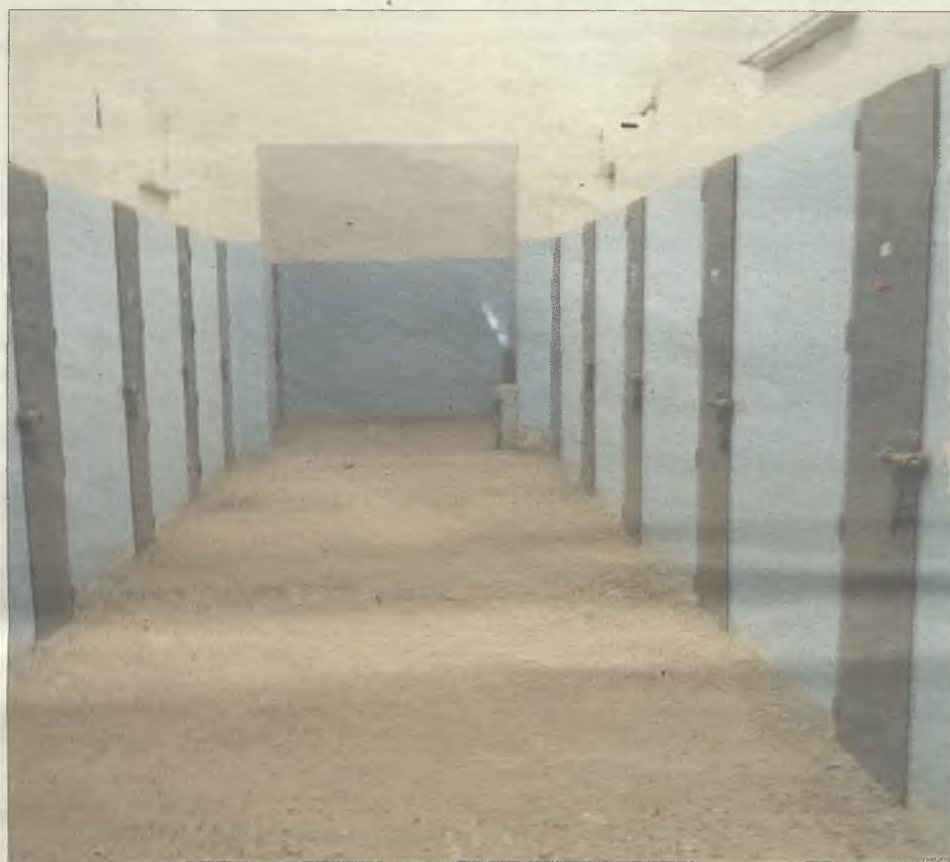
Estado actual del interior de la Prisión Provincial, ubicada en la calle Toledo de la capital.

Solo después de hacerse pública esta información, la presidenta de la Diputación ha reaccionado para afirmar