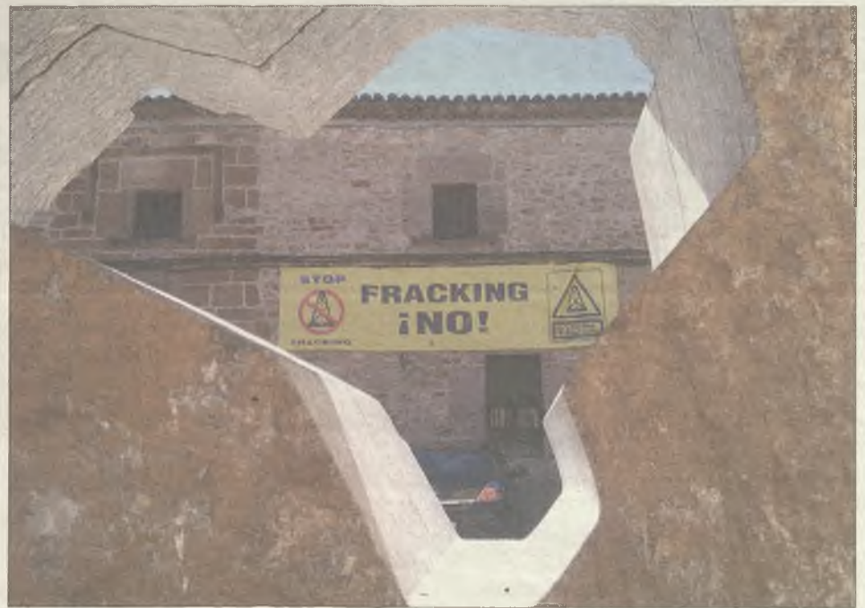
La amenaza del fracking planea sobre pueblos de la provincia en las zonas de Alcolea y Molina.