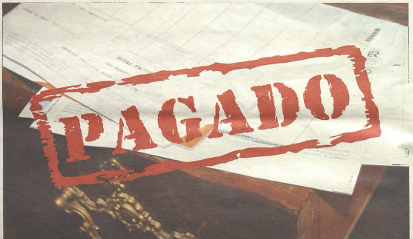
El PSOE dejó en el año 2011 más de 600.000 facturas en los cajones sin pagar en toda la región.

Además, hay que resaltar que la Junta de Comunidades de Castilla-La Mancha ha pagado todas sus deudas con lealtad y sin hacer distinciones por el color político de los ayuntamientos que arrastraban deudas astronómicas heredadas de la etapa socialista, de casi 30 años de gobiernos socialistas en los que ha primado la máxima de gastar lo que no se tenía, algo que también ha venido ocurriendo en otras administraciones que han estado gobernadas por el PSOE, como en la Diputación Provincial de Guadalajara que ha conseguido dar la vuelta a la situación económica con un Gobierno del Partido Popular, presidido por