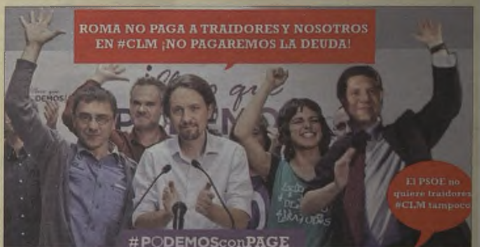
Imagen que ha dado la vuelta por las redes sociales tras salir a la luz la reunión secreta de Page.