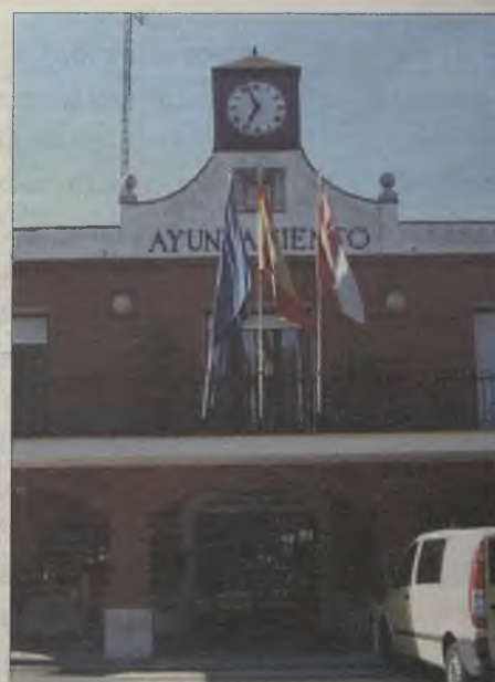
La Junta cumple con todos los ayuntamientos sin distinción del color político.