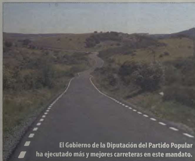
El Gobierno de la Diputación del Partido Popular ha ejecutado más y mejores carreteras en este mandato.