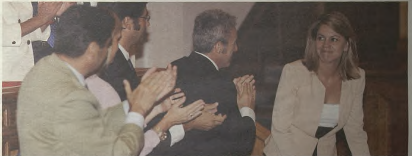
Mientras Cospedal defiende menos diputados, menos sueldos y la eliminación de privilegios, Page quiere más diputados, más sueldos y más privilegios.

Se trata de una de las medidas mejor aceptadas por la sociedad castellano-manchega: la reducción del número de diputados junto a la supresión de sus sueldos en las Cortes de Castilla-La Mancha por parte del Gobierno de Cospedal. Esto ha supuesto un ejercicio de responsabilidad absoluta ante los ciudadanos. Para toda la sociedad menos para los dirigentes socialistas, que han luchado con uñas y dientes por mantener sus privilegios, cobrar más y tener más diputados en las Cortes. Frente a esto, el Partido Popular ha optado, en solitario, por eliminar privilegios, reducir el número de políticos en las Cortes y eliminar los sueldos. Una medida esta última que, en palabras de Cospedal, contribuye a "humanizar la política" y permite que todo aquel que quiera dedicarse a la política