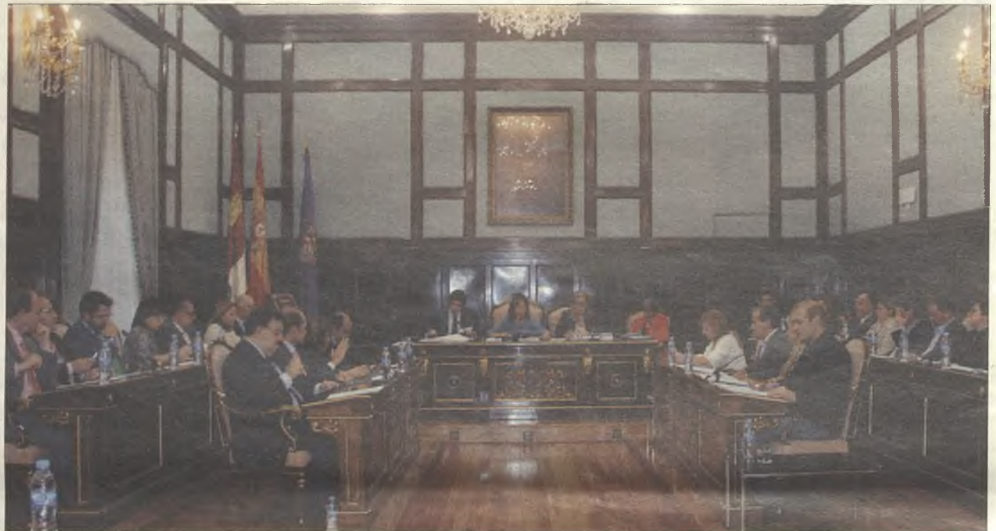
El equipo de Gobierno de Ana Guarinos ha realizado un importante esfuerzo para reducir la deuda y aumentar la inversión.

Frente al despilfarro del PSOE, el PP dedica todo su esfuerzo a incrementar la inversión para mejorar las infraestructuras y los servicios de los municipios