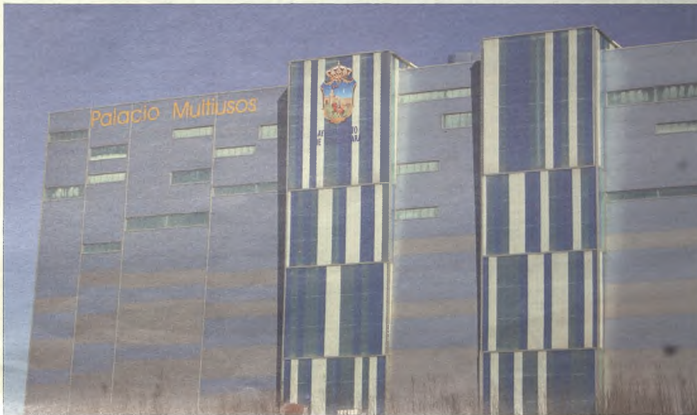
El Palacio Multiusos fue terminado por el equipo de Gobierno de Antonio Román, salvando la importante deuda que dejó el gobierno socialista de Castilla-La Mancha.

Ni una, ni dos, ni tres. Hasta 600.000 facturas sin pagar se encontró el equipo de Cospedal cuando accedió en 2011 a la Junta de Castilla-La Mancha. Facturas de todo tipo escondidas por todos lados. Facturas que en conjunto sumaban la friolera de 7.000 millones de euros y que fueron acumuladas durante el Gobierno socialista de Barreda. Entre los perjudicados, los ayuntamientos de