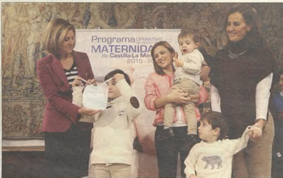
Este programa defiende y protege a la familia, a las mujeres y la maternidad.

según subraya la presidenta Cospedal "aglutina de forma eficaz las políticas de apoyo a las familias y a las madres en nuestra región", ha empezado a desarrollarse el 1 de enero y prevé una inversión de 43 millones de euros hasta 2016, destinándose 6 millones de euros a ayudas directas a