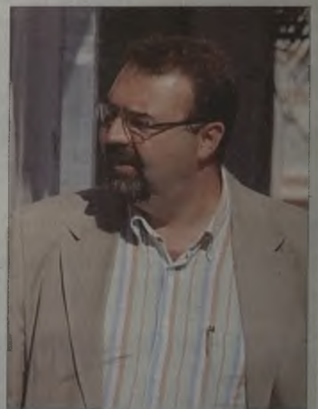
Este concejal de Guadalajara vive en Marchamalo.

Parece que lo de residir en otro municipio distinto al que te presentas en