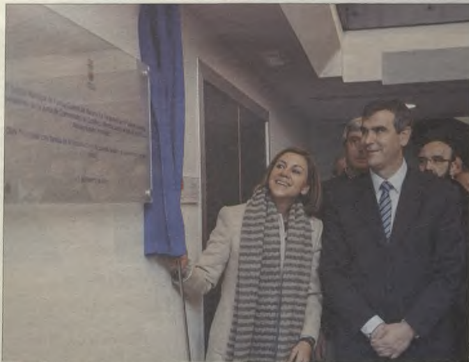
El Ayuntamiento de Guadalajara ha invertido alrededor de dos millones de euros en este nuevo Centro de Familia.

Este centro dispondrá de ludoteca en inglés para favorecer la conciliación de la vida laboral y familiar, servicio de atención asistencial, y una consulta joven. En él se van a desarrollar a partir de marzo programas de envejecimiento activo, cursos para los más mayores y talleres para toda la familia. Será la sede del servicio de inmigración -hoy este barrio es uno de los que mayor número de inmigrantes