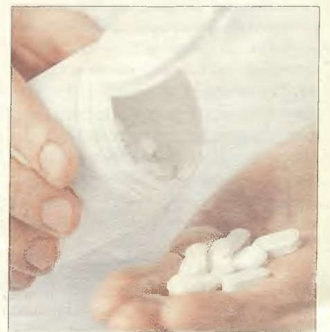
Castilla-La Mancha, pionera en garantizar los nuevos medicamentos contra la hepatitis C.

El Plan Estratégico para combatir la hepatitis C contempla que, en 2015, re-