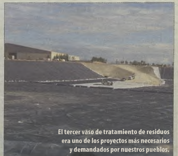
El tercer vaso de tratamiento de residuos era uno de los proyectos más necesarios y demandados por nuestros pueblos.

El Plan de Carreteras también ha avanzado gracias a la gestión del Partido Popular, y a pesar de las zancadillas del PSOE que intentó frenar su ejecución en los tribunales. En la mejora de la red provincial de carreteras se han invertido en los últimos años casi 48 millones de euros, consiguiendo poner al día un plan que estaba al 'ralentí'.