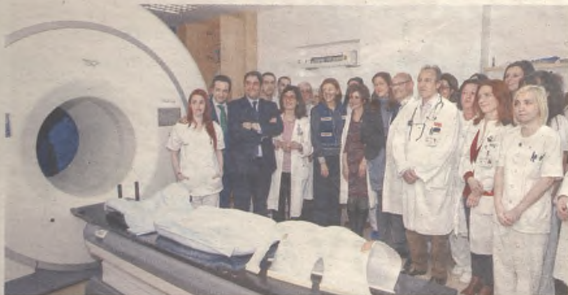
Las inversiones en nuevas tecnologías revierten en un mejor servicio para el paciente.