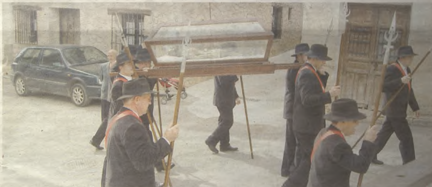
Los Soldados de Cristo protagonizan la Semana Santa en Budia.

hombros el Sepulcro hasta la ermita de la Soledad, donde dos de ellos hacen guardia. Antes de que anochezca se colocan antorchas desde la iglesia hasta la ermita de la Soledad, y a las once en punto se apagan con la única intención de que comience la procesión de las Antorchas. En esta procesión, la imagen de la Dolorosa se acompaña del golpeo de las lanzas contra el suelo, y produciéndose un momento indescriptible, al unirse lo profano y lo litúrgico. Así, con este son llegan hasta la ermita. Los Soldados de Cristo viven otro momento destacado en el triunfo de la Cruz, cuando todos unidos en círculo entorno al abad, éste levanta la Cruz y los soldados las lanzas.