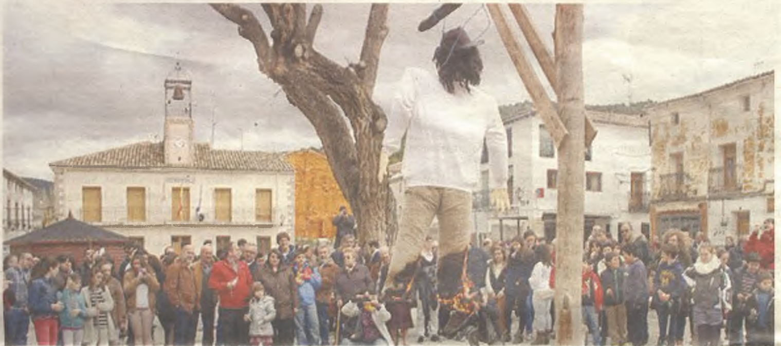
La Quema del Judas congrega a cientos de personas en la Plaza Mayor de Pareja cada Domingo de Resurrección.

Pocos o ningún municipio de España no celebra este día. Sin embargo, las formas de hacerlo son muy diferentes, dependiendo de las tradiciones que hayan seguido sus vecinos a lo largo de los años. Así, en Guadalajara hay algunas muy peculiares.