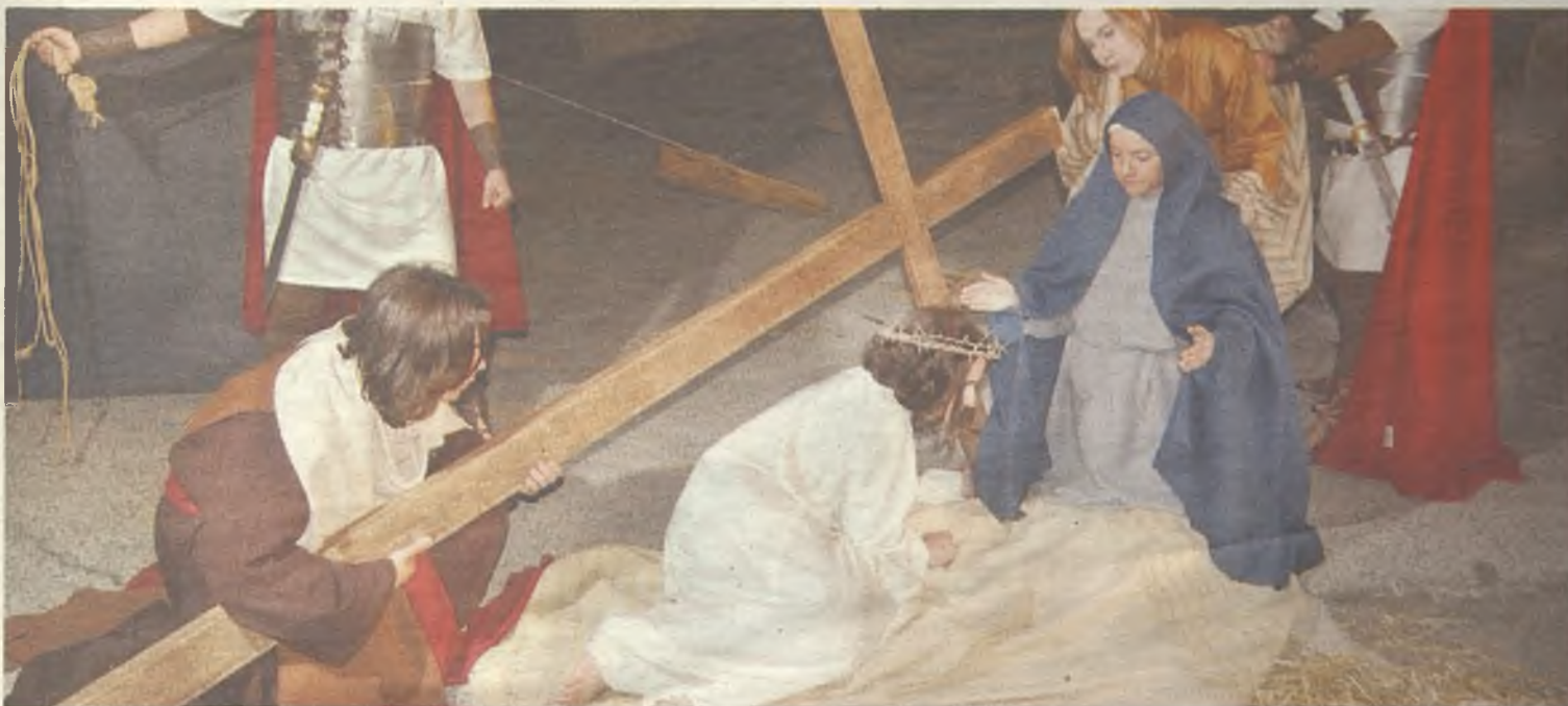
En Albalate de Zorita, la Pasión Viviente son cuadros estáticos en los que los actores no se mueven durante horas.

Santo, en vez del Jueves Santo. Con la intención de imprimir a la representación un carácter propio que la diferenciara de otras que venían realizándose en la provincia, durante la edición de 1999 se introdujo una novedosa idea, diseñar cuadros estáticos que invitaran al espectador a reali-