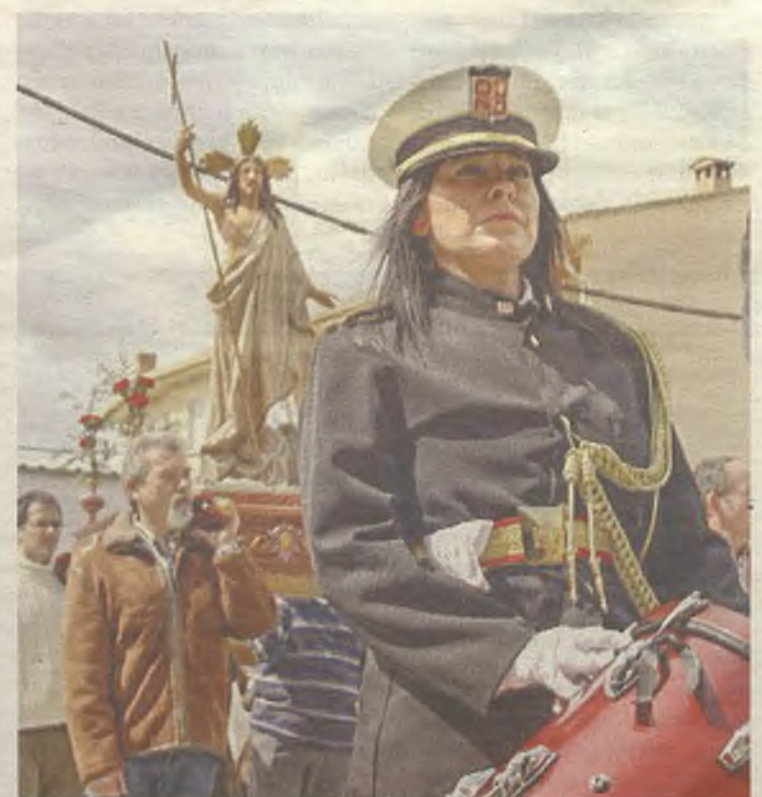
La Procesión del Santo Encuentro, en todos los municipios de la provincia.