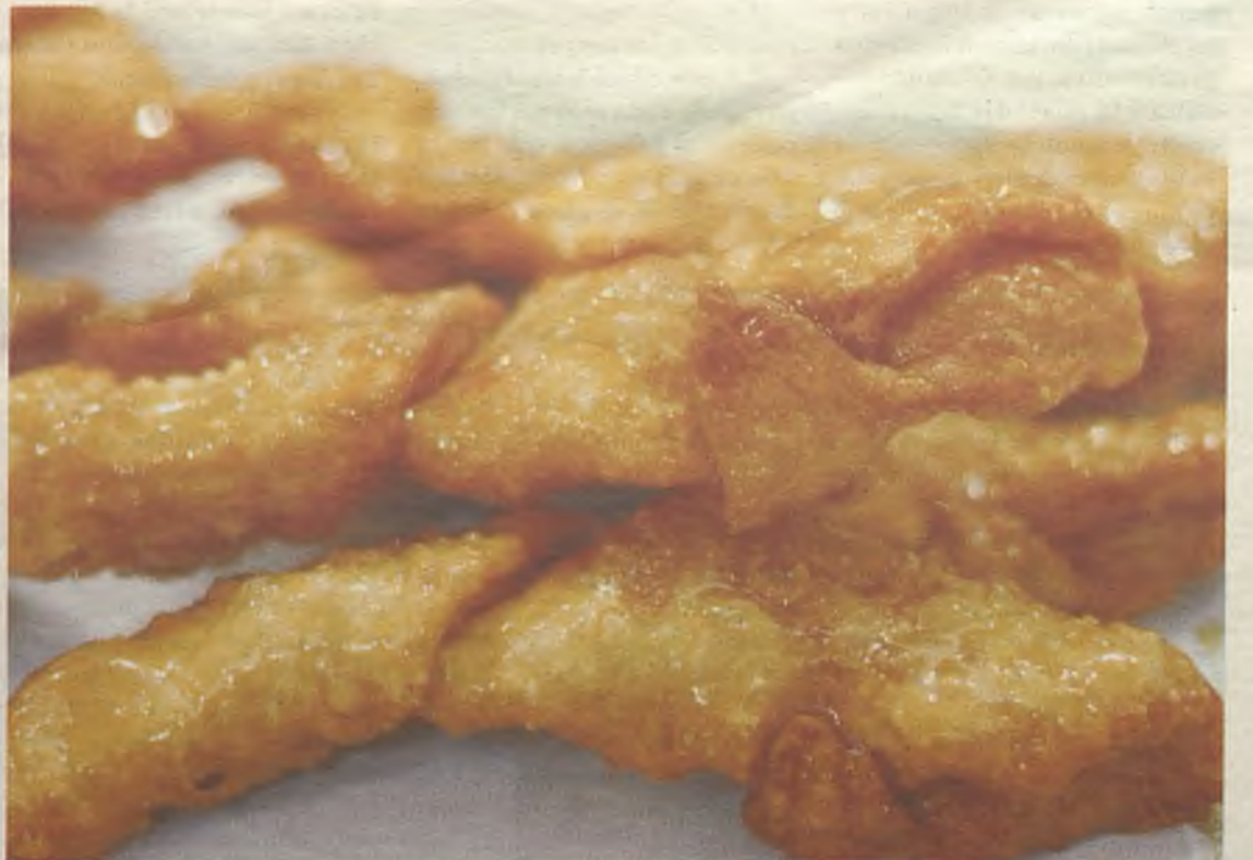
Pestiños, dulces bocados a los que nadie se puede resistir.

El zurracapote es la bebida tradicional de la Semana Santa en la localidad de Trillo