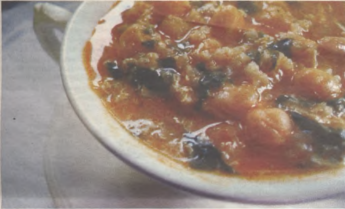
El potaje, un plato perfecto para los días en los que hay que guardar vigilia.

Potajes, torrijas o pestiños son algunos de los platos que más se prepararán en la provincia de Guadalajara durante estos días, cumpliendo otra de las tradiciones propias de la Semana Santa