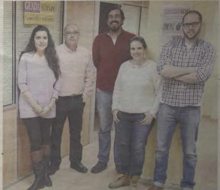
El equipo de Guadanews.