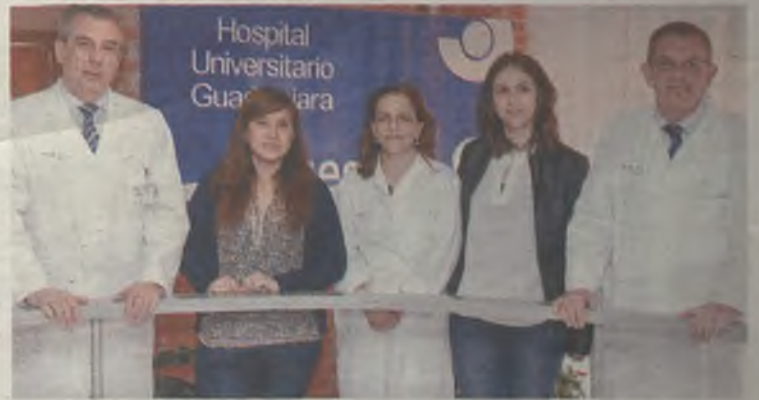
Los médicos premiados de Atención Primaria y Reumatología de Guadalajara.