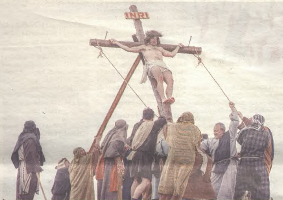
Hiendelaencina cuenta con la Pasión Viviente reconocida como Fiesta de Interés Turístico Regional.

Si hay una Pasión Viviente que se distinga del resto en la provincia, por reconocimiento recibido y porque es la más antigua de las celebradas en nuestra provincia, es la de Hiendelaencina. Desde hace 43 años este pueblo, de poco más de medio centenar de habitantes, se vuelca por conseguir mantener el nivel y la tradición. Y es que no es cosa de poca responsabilidad interpretar la adaptación de los textos de la Biblia para animar al turista a no perderse detalle de pasajes como la Última Cena, el Huerto de los Olivos, el Juicio ante Caifás, la subida al Calvario y la Crucifixión. Ni la lluvia ha po-