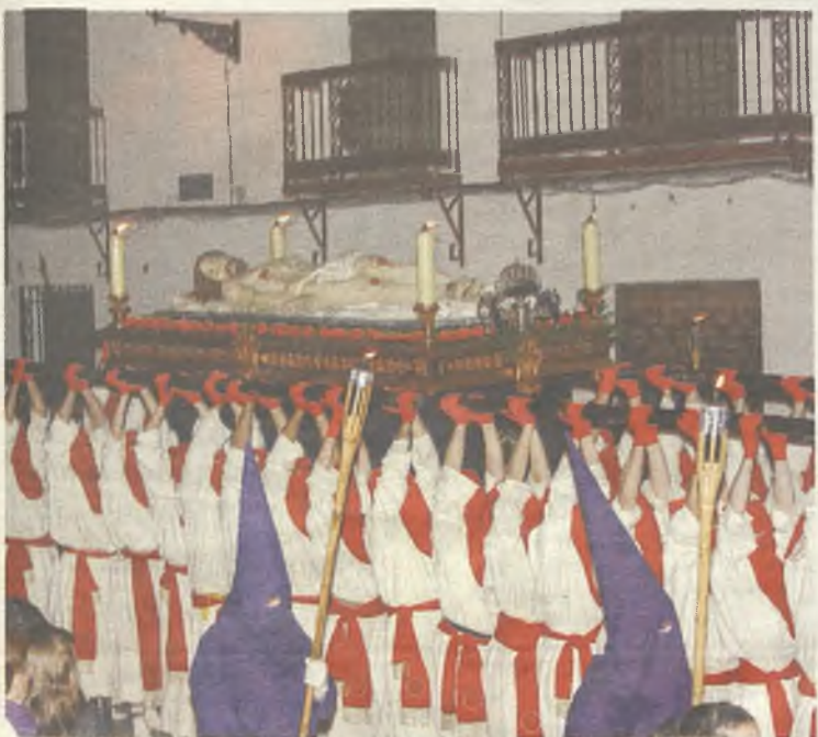
Los yunqueranos, solemnes en el Santo Entierro.

cularés con la gran belleza de las piedras y el ambiente medieval que embarga cada rincón.