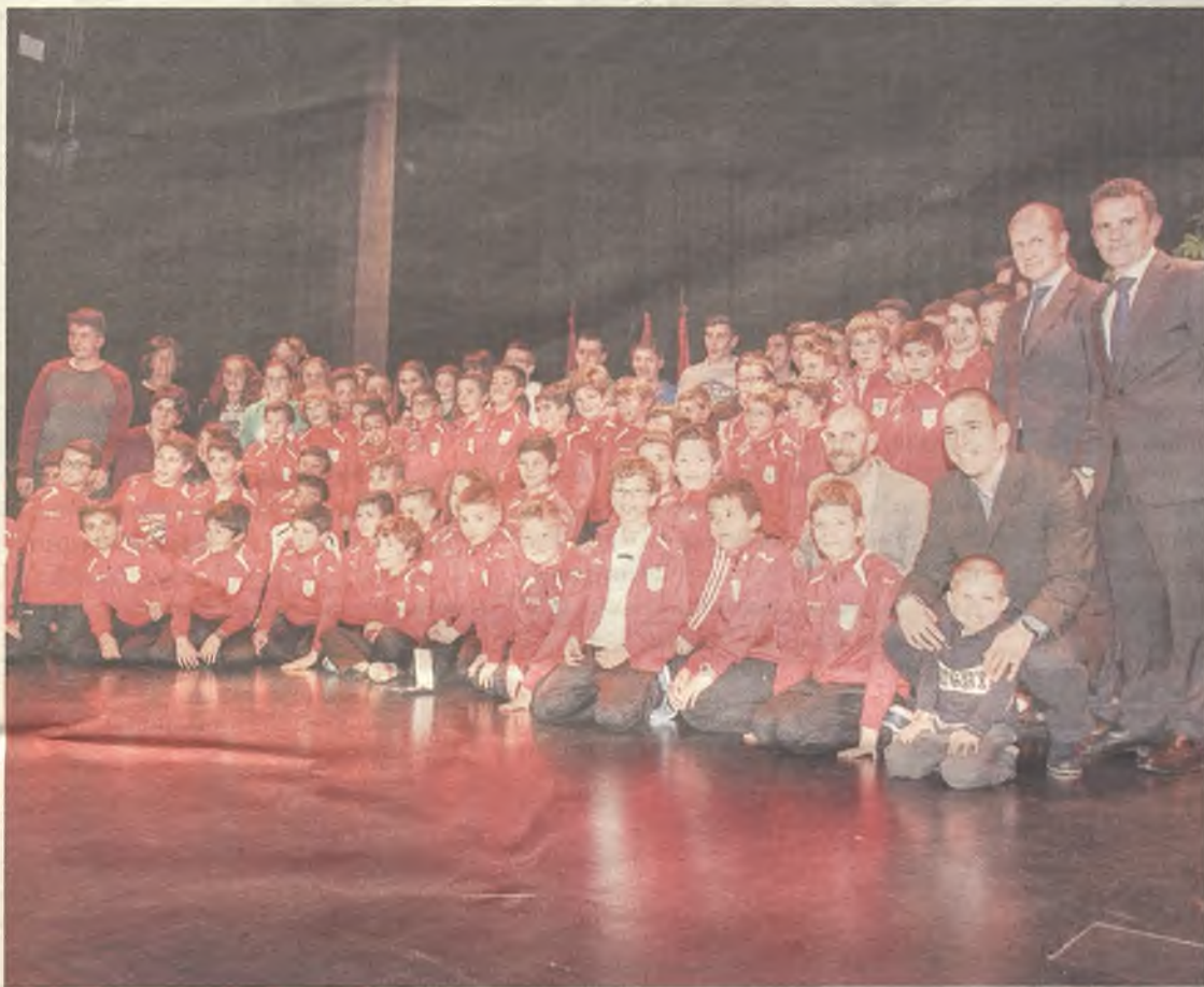
El deporte base también fue premiado durante la Gala del Deporte de Cabanillas del Campo.

La VI Gala del Deporte repartió 42 medallas entre clubes y deportistas de la provincia