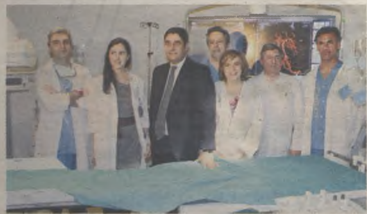
Este nuevo equipo permite un mejor y menos invasivo tratamiento.