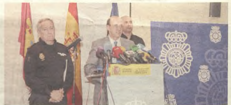
El subdelegado del Gobierno presentó la operación a los medios.

La detención del ‘cocinero’ se produjo cuando se desplazaba en un vehículo, en el cual los investigadores localizaron un paquete con los cuatro kilos de ‘speed’. Su mujer, por su parte, fue detenida posteriormente en la vivienda. Mientras el primero se encuentra en prisión, su esposa está en libertad condicional.