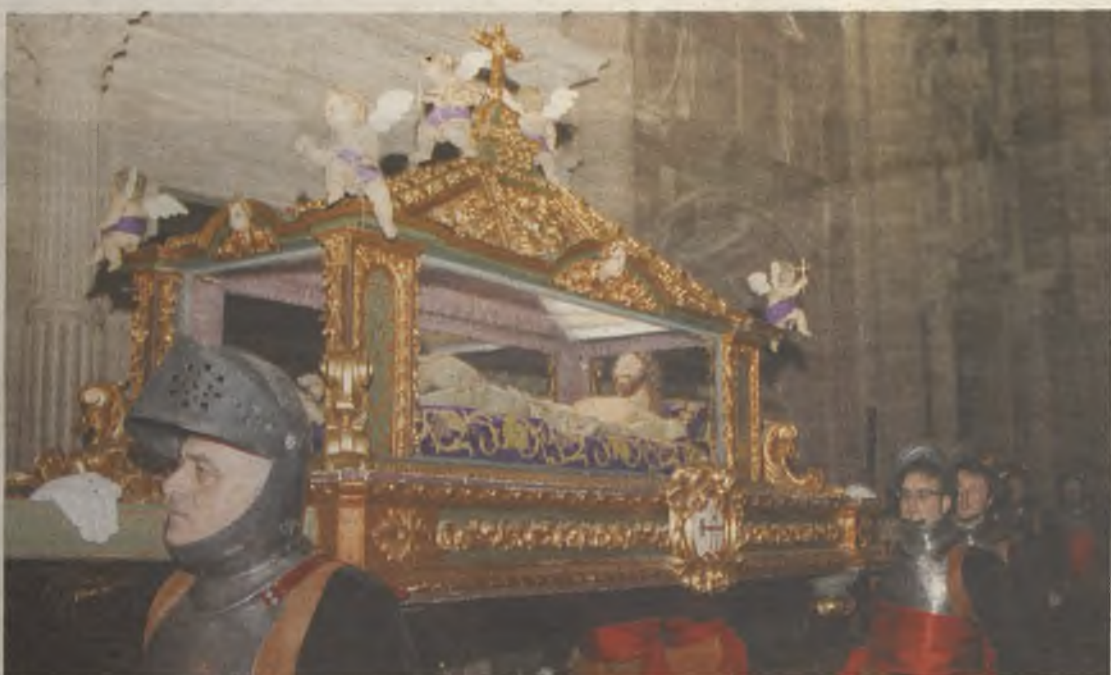
Uno de los momentos más emotivos es la entrada de los Armaos en la Catedral

La procesión, por cierto, una vez que sale de los muros de la catedral seguntina, desciende hasta la antigua ermita de San Lázaro, en los extramuros de la ciudad. Y es que la Ciudad del Doncel tiene, precisamente, la posibilidad de disfrutar de ritos religiosos se-