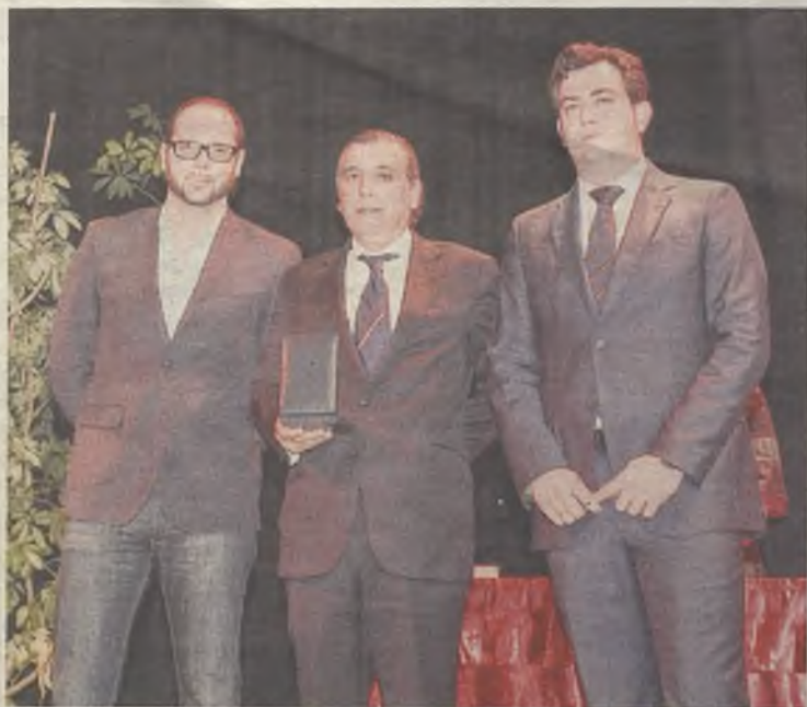
Guadanews logró el premio al Medio de Comunicación.