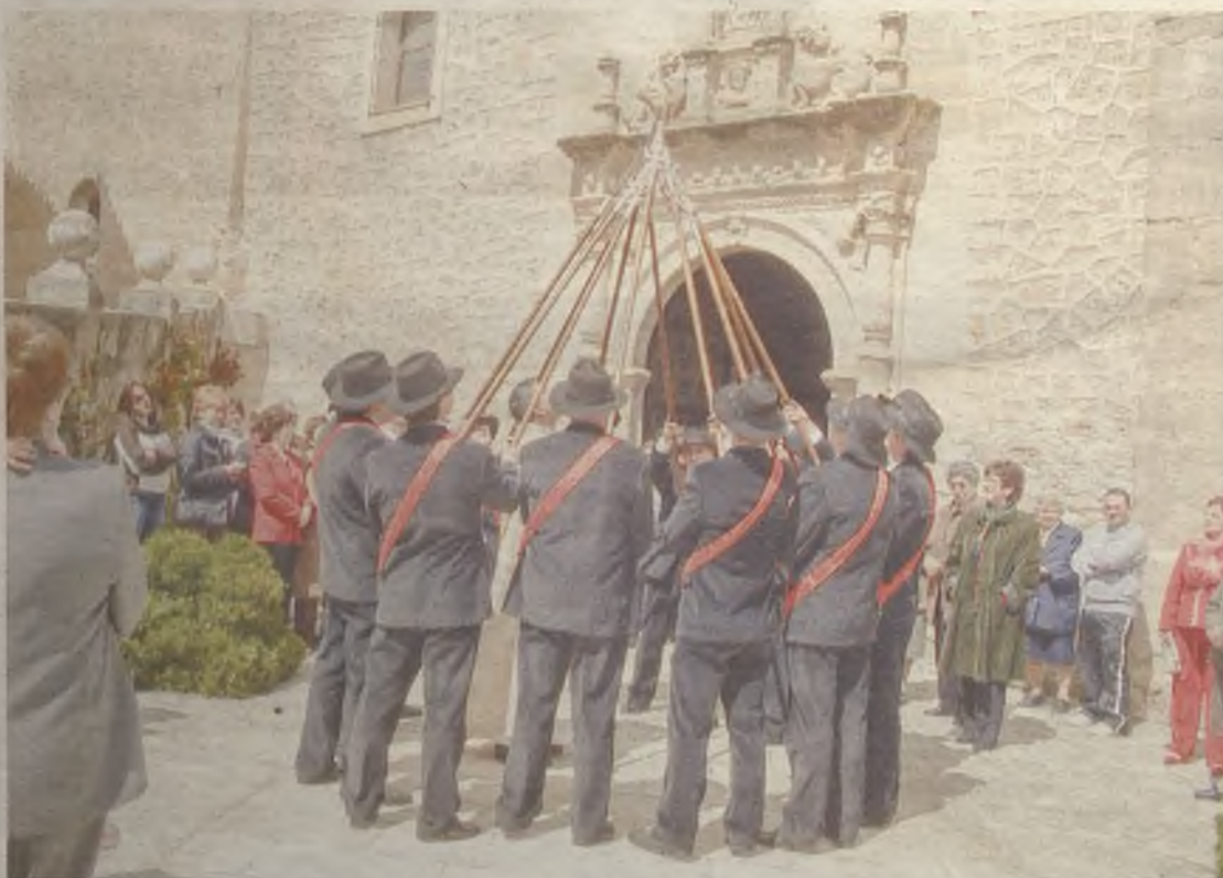
La cruz triunfando sobre las lanzas de los Soldados de Cristo en Budia.

pueblo, se encarga de dar quema a un pelele, tradicionalmente confeccionado por los quintos del lugar , aunque actualmente y tras la eliminación del servicio militar, lo realiza la asociación cultural y de la mujer , con el que arden las malas acciones y propósitos, y que