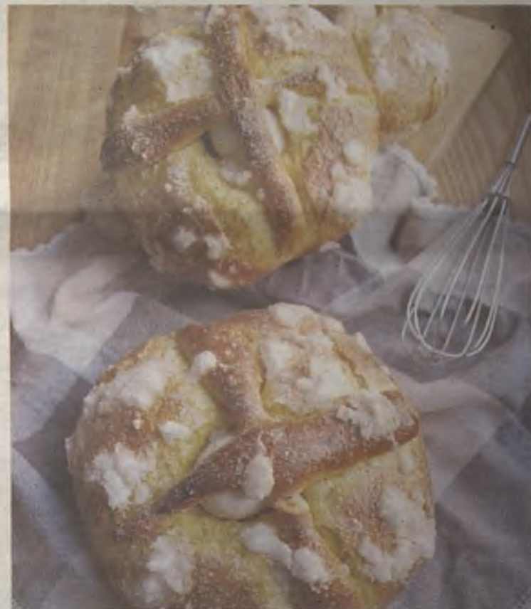
Los hornazos, postres típicos del Domingo de Resurrección.

La comida será la típica campestre, consistente. Pero lo más tradicional será el postre. Para ello se preparan los hornazos, una especie de bollo esponjoso que, dependiendo de su tamaño, lleva uno o más huevos cocidos coronándolo. Sin duda, la mejor manera de cerrar una semana llena de actos solemnes.