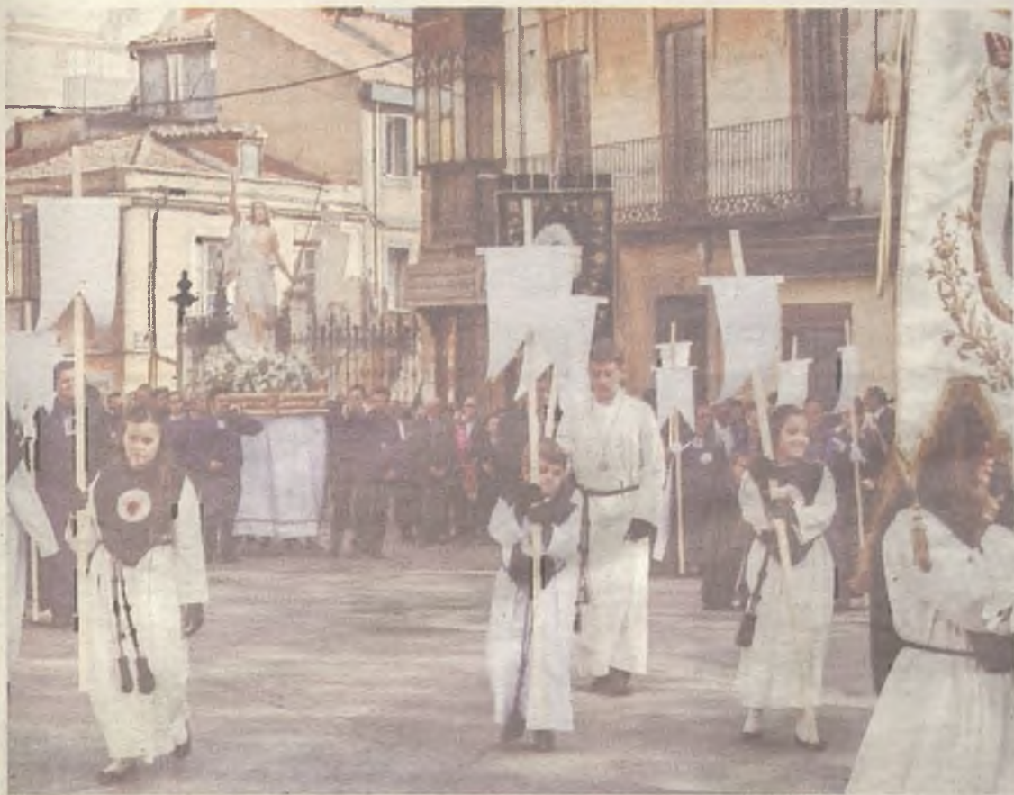
En Guadalajara, todas las cofradías y hermandades salen en la procesión del Domingo de Resurrección.

también representa el repudio popular a Judas Iscariote por haber entregado a Cristo.