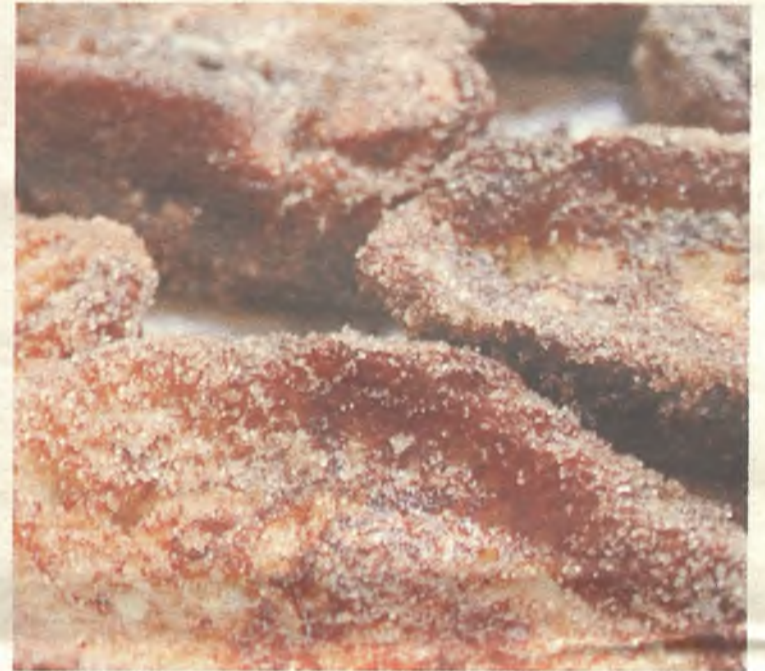
Las torrijas no pueden faltar durante la Semana Santa.

Como buena celebración española, la Semana Santa cuenta con su propia gastronomía. Y es que el buen comer nunca ha estado reñido con la solemnidad, la pasión o la religiosidad de estas fiestas. Por eso, son varios los platos que se han convertido en tradicionales para estos días.