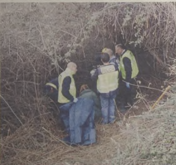
La búsqueda fue un ejercicio del Consorcio Provincial de Bomberos.