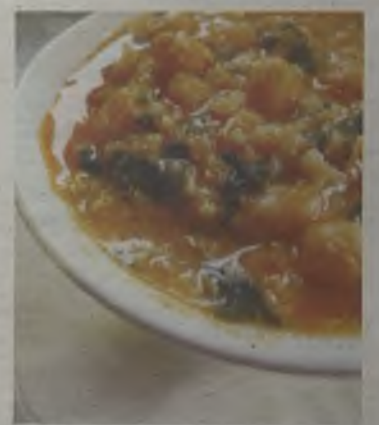
Potaje de vigilia. ◆

La Semana Santa no se vive únicamente en las calles de cada pueblo, sino también en cada uno de sus hogares y, principalmente, en sus cocinas. Platos típicos de estas fechas como el potaje de vigilia , no faltan en las mesas de los guadalajareños, mientras que en lugares como Trillo se refrescan con el zurracapote . Y de postre, no pueden faltar dulces alimentos como las torrijas (de leche, de vino o de miel), los pestiños o los buñuelos . ◆