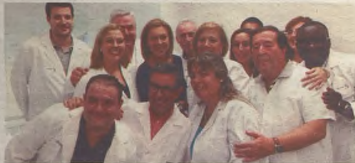
Los investigadores sanitarios, claves en la innovación de la Sanidad regional.