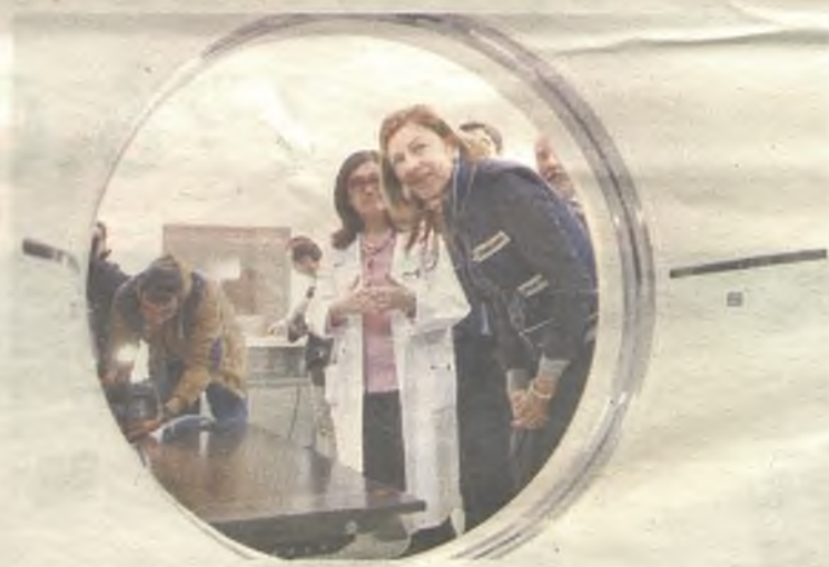
La presidenta Cospedal conoce de primera mano algunos de estos nuevos sistemas.

El nuevo TAC es uno de los equipos de diagnóstico por imagen de última generación en este ámbito. Una de las principales novedades del nuevo equipo es que permite abordar los principales estudios radiológicos con mayor resolución y con menor dosis de radiación para los pacientes (hasta un 75% menos). Además, la mayor velocidad de adquisición permite obtener imágenes con mejor calidad. ◆