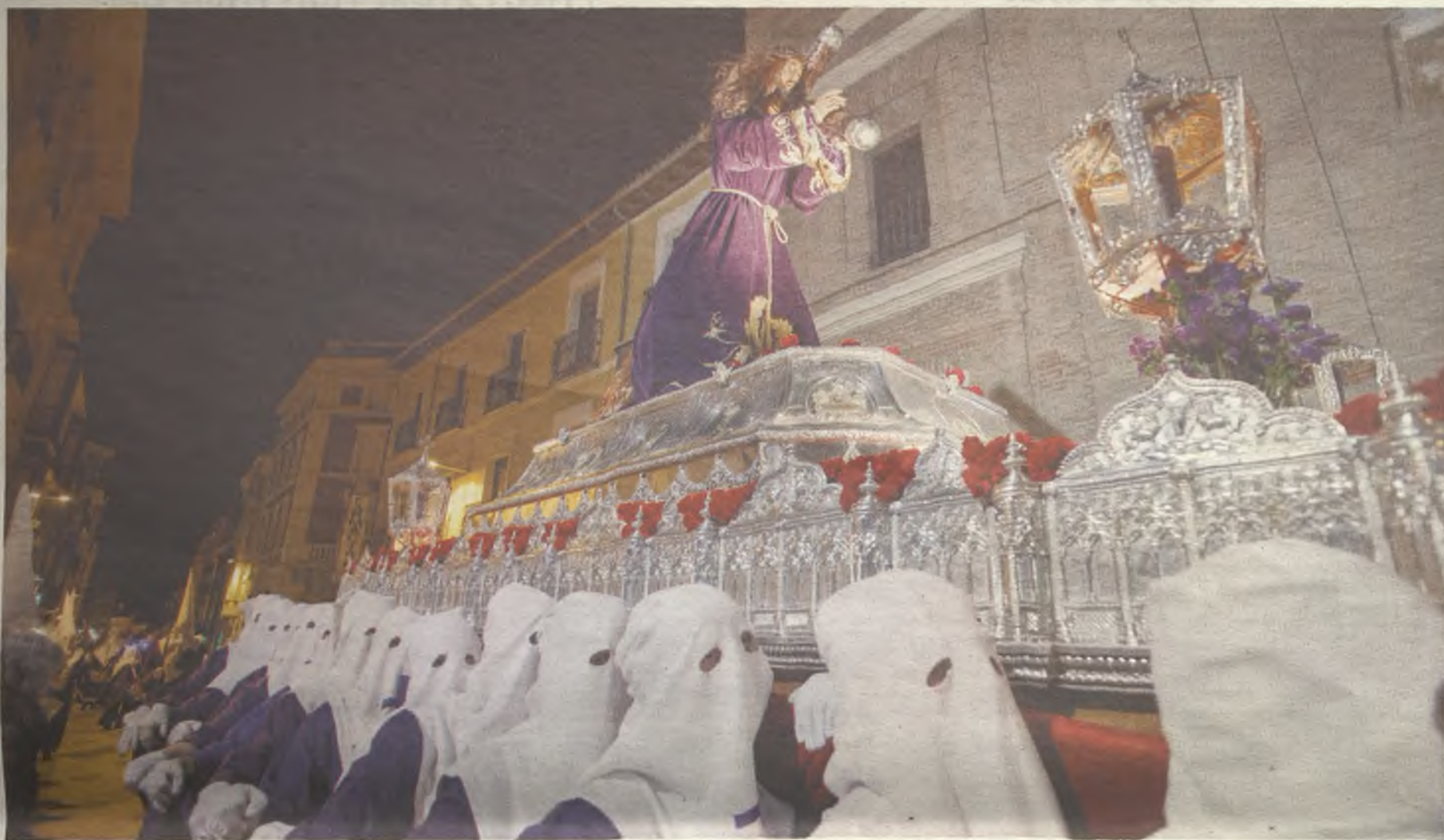
La solemnidad de las procesiones de Semana Santa de Guadalajara es su principal atractivo turístico.