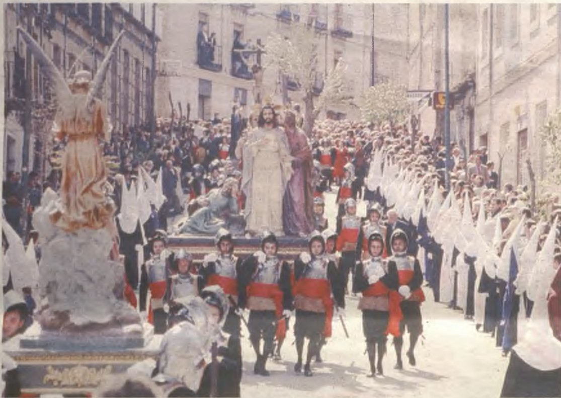
Preciosa imagen de la procesión en la edición del año pasado

Los Armaos de Sigüenza, el Santo Entierro de Yunquera o los Soldados de Cristo de Budia, son tan solo tres ejemplos de citas ineludibles para vivir con Fe y arraigo nuestra Semana Santa