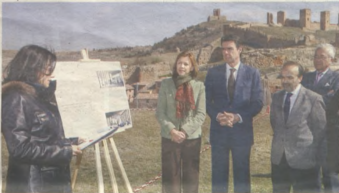
La presidenta Cospedal presentó junto al ministro Soria el inicio de las obras del Parador de Molina de Aragón.

En cuando al proyecto, la presidenta ha avanzado que será un Parador “adaptado al entorno y construido con materiales de la zona; moderno y con comodidades”. Del mismo modo, Cospedal ha resaltado que la nueva infraestructura estará ubicada en “un lugar muy querido por todos los castellano-manchegos; cruce de caminos, seña identi-