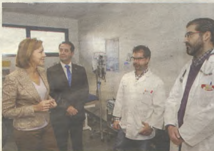
Muchas son las inversiones en Sanidad que está haciendo el Gobierno regional.

Mientras, en Talavera de la Reina han puesto en marcha un nuevo sistema de monitorización remota de marcapasos y desfibriladores. El sistema agiliza el seguimiento y evita desplazamientos a los pacientes con disposi-