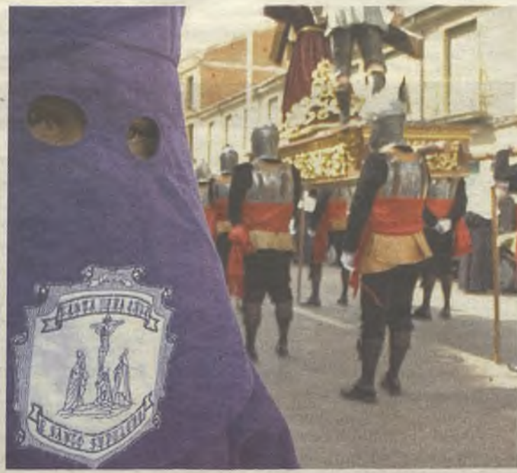
La Cofradía de la Vera Cruz y Santo Sepulcro en primer plano