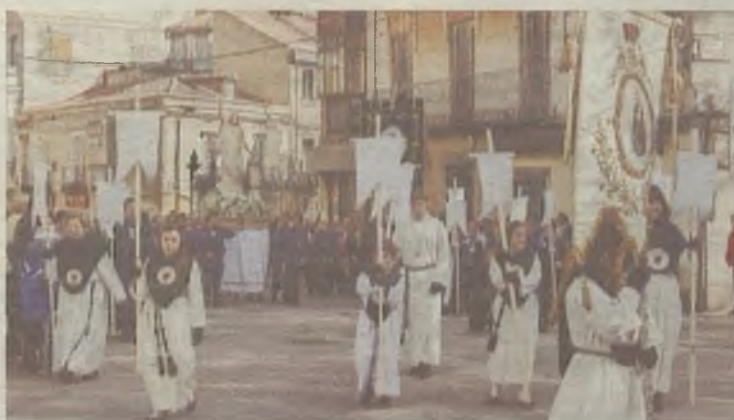
A las procesiones acuden miles de personas. ◆

Cada localidad de la provincia de Guadalajara vive la Semana Santa a su manera. Por eso, ya están preparados para seguir esas tradiciones que los definen como pueblos. Hiendelaencina o Albalate de Zorita están listas para sus Pasiones Vivientes , mientras que en Guadalajara, Sigüenza o Yunquera de Henares tienen todo listo para sus procesiones del Santo Encuentro . Mientras, en Budia o Pareja , el momento más importantes llega con el Domingo de Resurrección . ◆