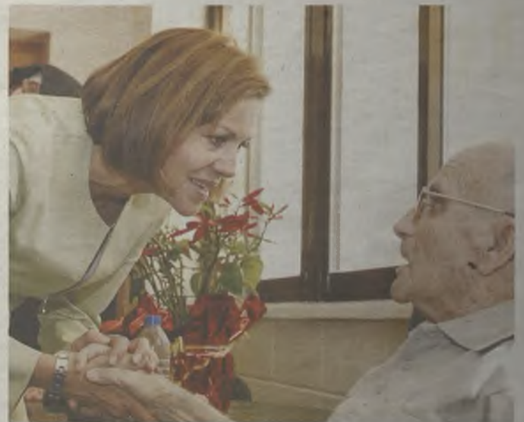
Cospedal continúa su apuesta por los mayores.

Con respecto a la campaña Ningún mayor solo en Navidad , la presidenta del Ejecutivo autonómico ha anunciado que la novedad de este año es su duración, ya que, se amplía desde el 22 de diciembre al 2 de enero de forma ininterrumpida , en lugar de circunscribirse a los días de Nochebuena, Navidad, Fin de Año y Año Nuevo como