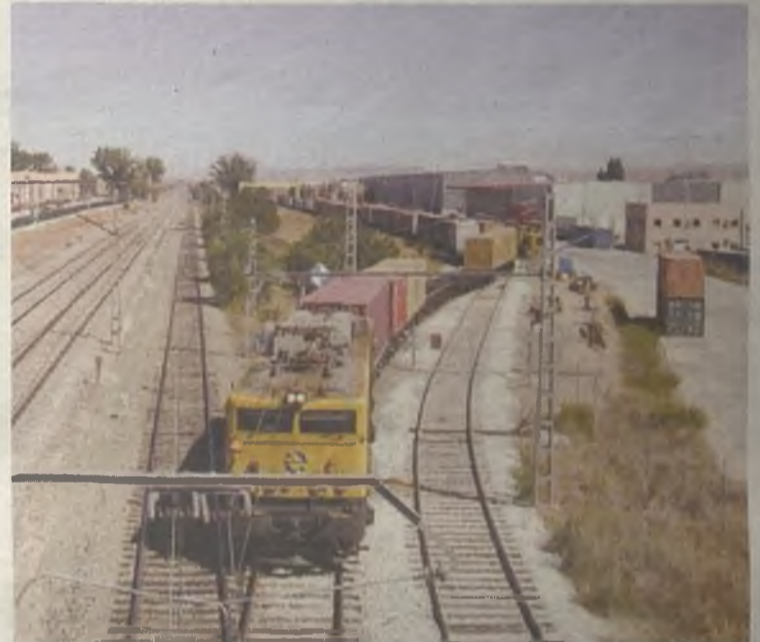
El Puerto Seco de Azuqueca es un foco de exportaciones a todo el mundo.

A su juicio, "es fundamental que sigamos creando sinergias entre el Gobierno y los empresarios, para lograr que el comercio internacional siga siendo uno de los pilares de la recuperación económica y laboral de Castilla-La Mancha ".