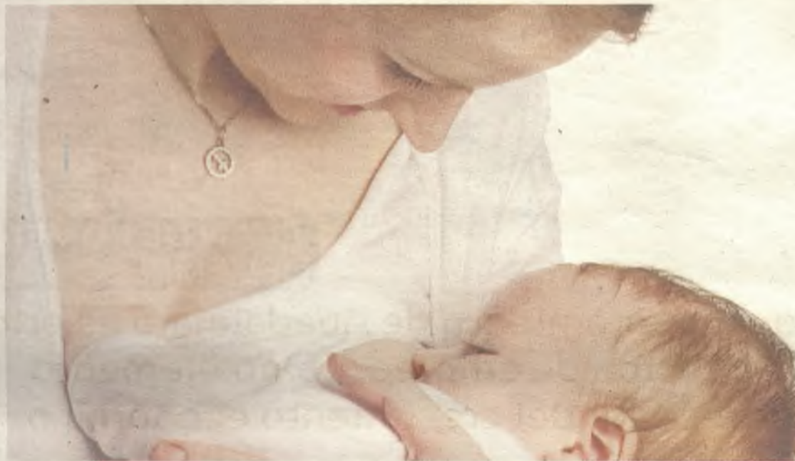
El Gobierno Regional apuesta con ayudas directas por el fomento de la maternidad.

Este programa empezará a desarrollarse a partir del próximo 1 de enero y cuenta con acciones que suponen una inversión de 43 millones de euros para los dos próximos. El mismo va a movilizar en el siguiente ejercicio, 20 millones de euros, de los que el 30% (6 millones de euros) se destinarán