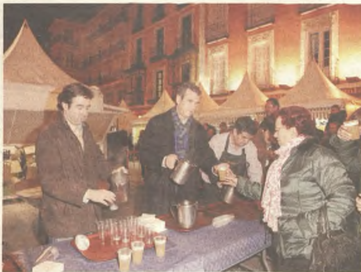
La ciudad de Guadalajara continúa cumpliendo con sus actos navideños tradicionales, como la Zambombada