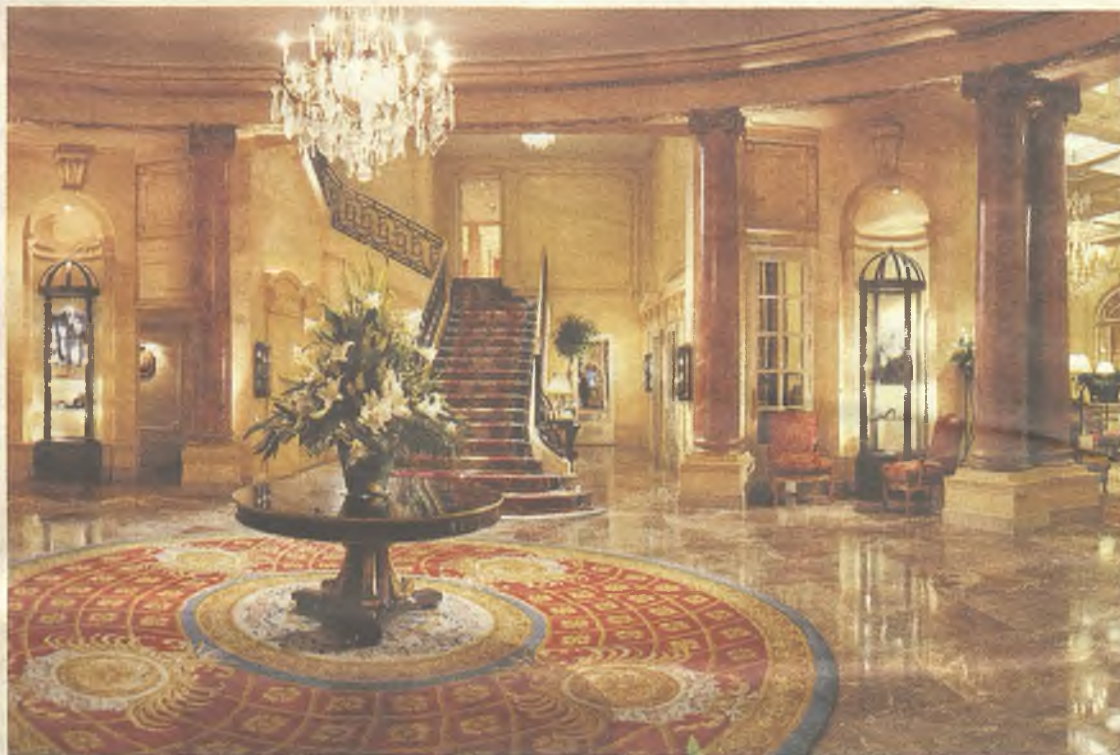
La Nochevieja del Hotel Ritz de Madrid, al alcance de muy pocos privilegiados.

Pero también existe un tipo de turista exquisito que elige destinos específicos para vivir experiencias muy concretas. Si tú eres uno de ellos, tienes entre tres y cinco noches libres y estás bus-