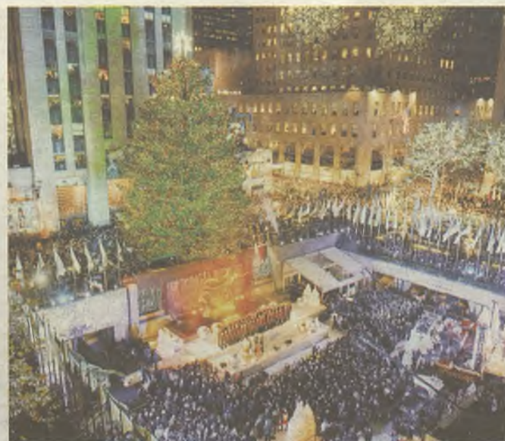
Navidades en Nueva York, una experiencia difícil de olvidar.