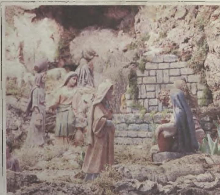
San Nicolás, es una de las cientos de iglesias que a lo largo y ancho de la geografía, no sólo alcarreña y castellanomanchega, sino española rinde culto y expone para la oración y el deleite este completo Belén.