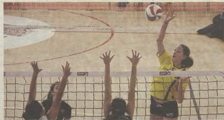
Campeonato de Voleibol solidario en Guadalajara para acabar el año.

Alvar Fáñez y Río Tajo. La Copa de España de Voleibol tiene un carácter solidario, de modo que se donará a Cáritas un kilo de alimento por cada set. ◆