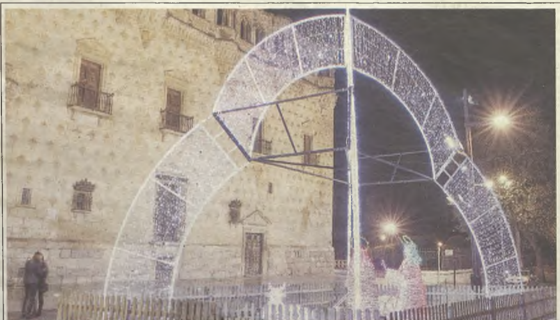
Si hay un Belén que sorprenda por sus dimensiones y por la novedad es el que acoge la gran campana del Palacio del Infantado. María, José, el Niño y la mula y el buey son los protagonistas del que puede ser el Belén más fotografiado de estas navidades en la capital alcarreña, porque si algo hace, es llamar la atención.