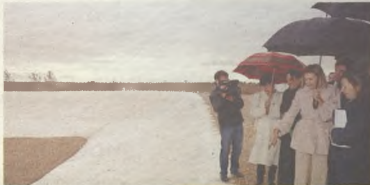
El Tercer Vaso de la Planta de Residuos de Torija ya está en funcionamiento.

La presidenta regional, María Dolores Cospedal, presentó este año medidas como la bajada del IRPF, las ayudas a la dependencia y discapacidad o el reciente Programa Operativo de Apoyo a la Maternidad.