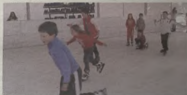
Patinar sobre hielo en la plaza del Ayuntamiento, otra opción más para disfrutar en Cabanillas de la Navidad