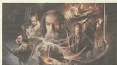
Llega la batalla de los cinco ejércitos