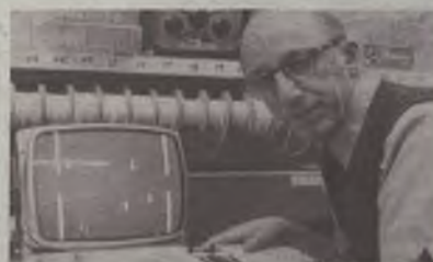
Muere "el padre" de los videojuegos