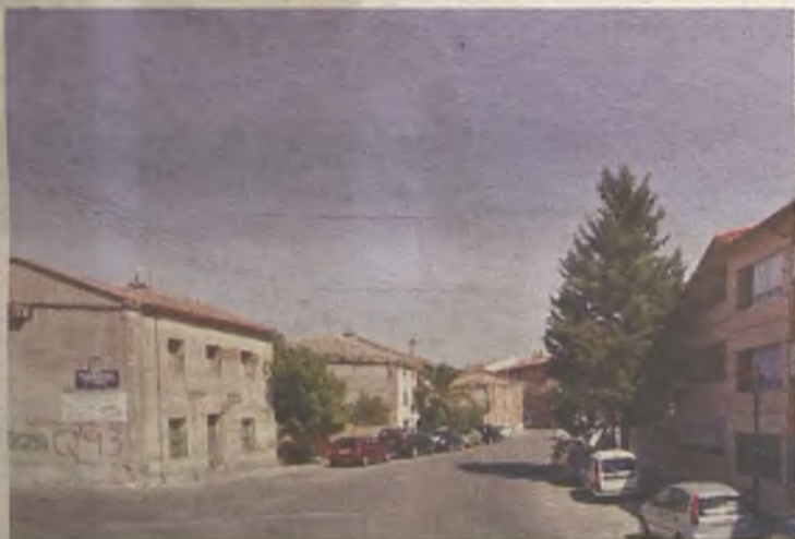
El pueblo campesino de Yunquera de Henares.

Centro Cultural Islámico de Azuqueca, una entidad que gestiona una mezquita del municipio azuquense. El video con las palabras de este líder religioso se llamaba “Gaza vence a pesar de la primacía de los judíos (sionistas) en la tierra” y de su contenido se hizo eco rápidamente el Instituto de Investigación de Medios de Comunicación en Oriente Medio (MEMRI). ◆