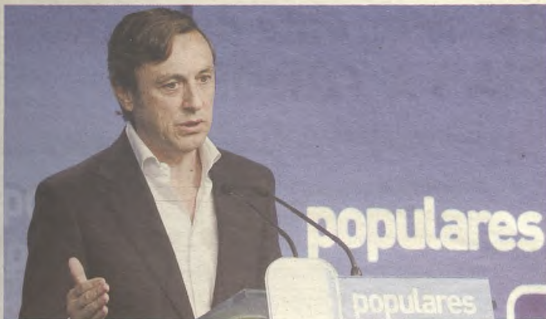
El alcarreño Rafael Hernando, nuevo portavoz del PP en el Congreso de los Diputados.