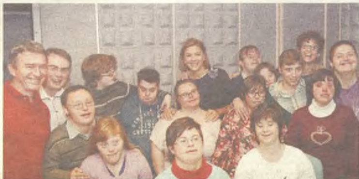
María Dolores Cospedal, presidenta de Castilla-La Mancha.