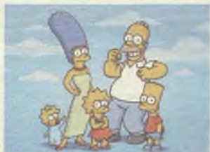
Un cuarto de siglo con Los Simpsons

Estrenos de teatro, conciertos, musicales, presentaciones de libros en GUADAPRESS.ES