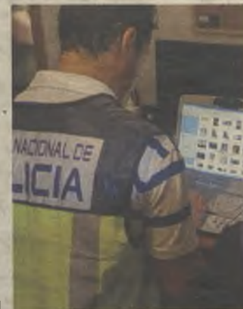
Un policía durante los registros.