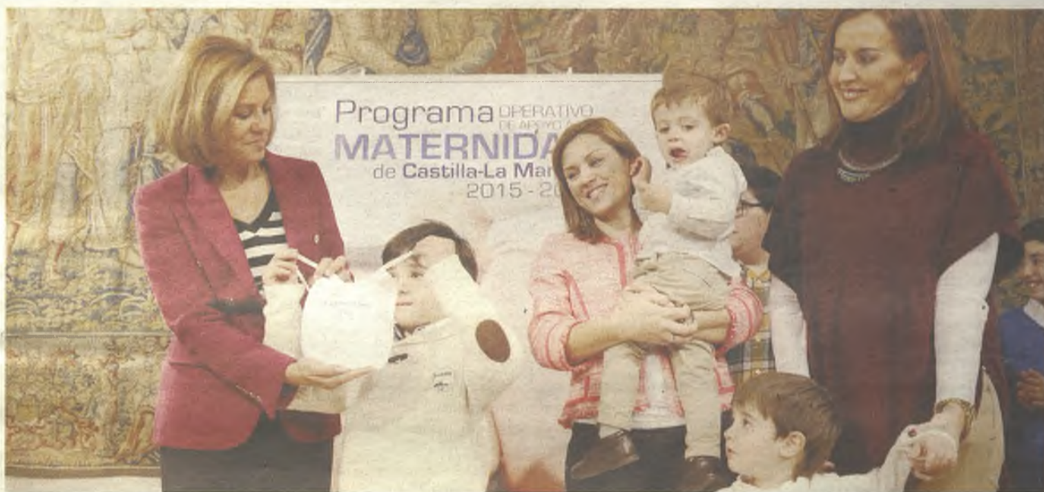
María Dolores Cospedal, junto a madres e hijos, durante la presentación del Programa de Apoyo a la Maternidad.

L a presidenta de Castilla-La Mancha, María Dolores Cospedal, ha destinado un presupuesto total de 43 millones de euros a