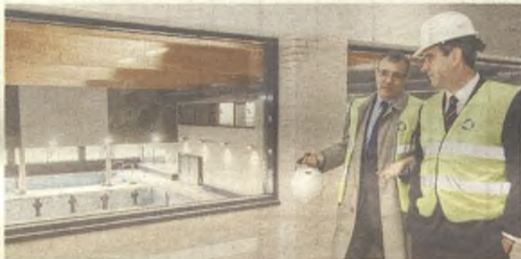
El futuro Centro Acuático de Guadalajara pronto estará operativo.