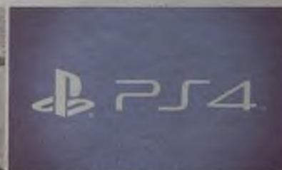
Control Mental, el misterioso proyecto de Sony para PlayStation