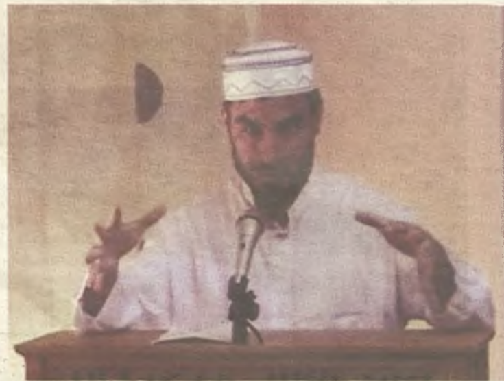
Imagen del video por el que está siendo investigado el Imán de Azuqueca.

“¡Oh Allah! Destruye a los judíos usurpadores ¡Oh Allah! El más misericordioso, arroja piedras contra ellos ¡apedréalos!, no dejes ninguno de ellos”. Esta es una de las frases contenidas en una “jutba” del viernes de