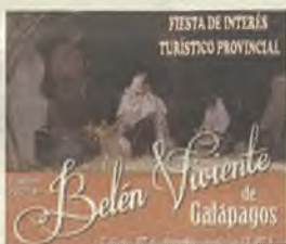
El Belén Viviente de Galápagos estrena este sábado declaración de Interés Turístico Provincial