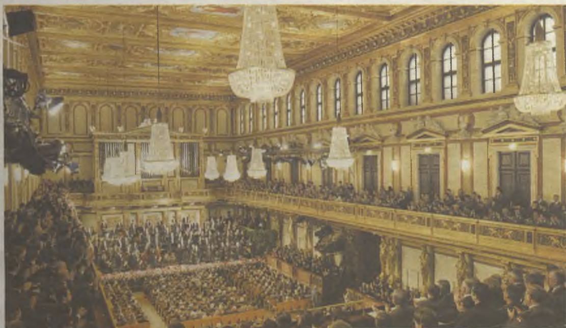
El Concierto de Fin de Año de la Filarmónica de Viena, una de las vivencias más exclusivas que se pueden tener.

de un lugar único en Navidad. En Guadalajara, una muy buena opción es desplazarse hasta Trillo, al Hotel Balneario Carlos III . Despedir el año dejándose 'mimar' por los muchos tratamientos que ofrecen, sin olvidar su fantástico servicio de restauración, tiene el asequible precio de unos 200 euros . ♦