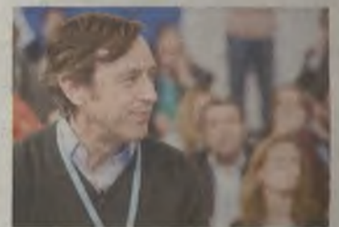
Rafael Hernando, portavoz del PP.

E l guadalajareño Rafael Hernando se ha convertido en el nuevo portavoz del Grupo Popular en el Congreso de los Diputados, sustituyendo a Alfonso Alonso, quien dejara el cargo para ser ministro de Sanidad. ▶ PÁGINA 6