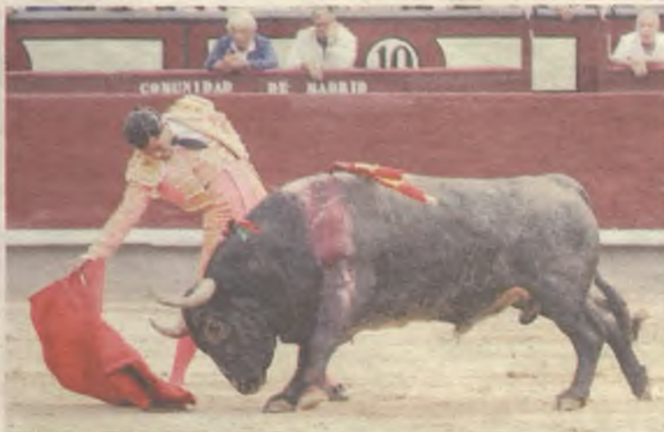
Fandiño sigue siendo el referente de los toreros de nuestra tierra.

El matador de toros afincado en Tórtola de Henares , tiene varios compromisos en tierras cafeteras. El primero de ellos en Cartagena de Indias, el 3 de enero con un encierro de Las Ventas del Espíritu Santo. Tres días más tarde, el vizcaíno hace el paseí-