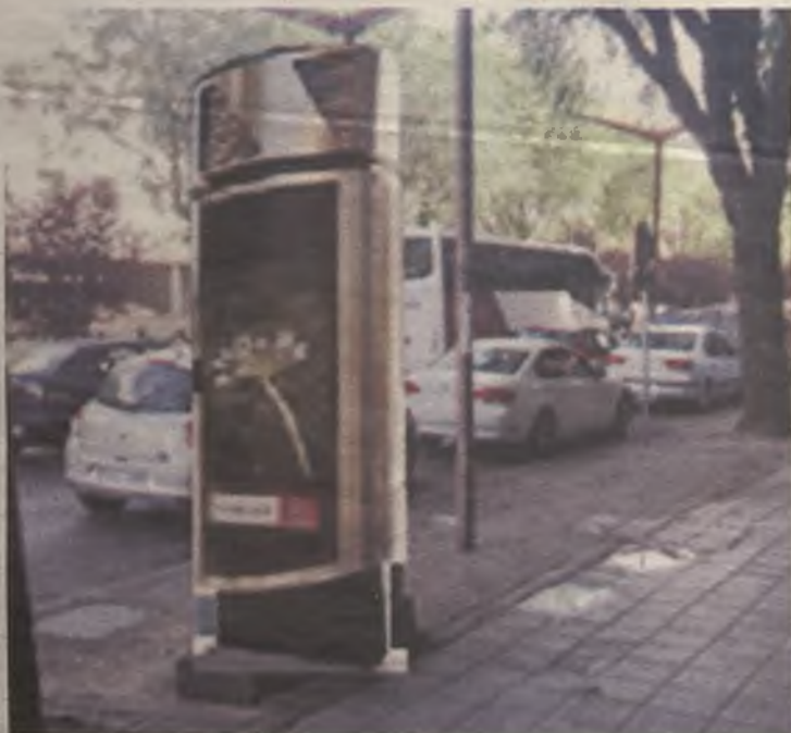
Los cuadros de mando tendrán un aspecto mucho más funcional.

Pero detrás de este contrato hay muchas otras mejoras, como los diez pasos NEO ZEBRA (que se iluminan cuando va a cruzar un peatón) que se van a instalar. A esto se suman detectores de presencia, así como cinco conjuntos histórico-artísticos que