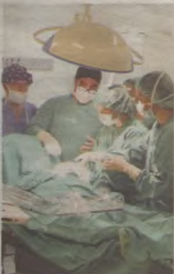
La sanidad regional pierde agilidad.

Los datos oficiales se han conocido por primera vez desde el mes de junio