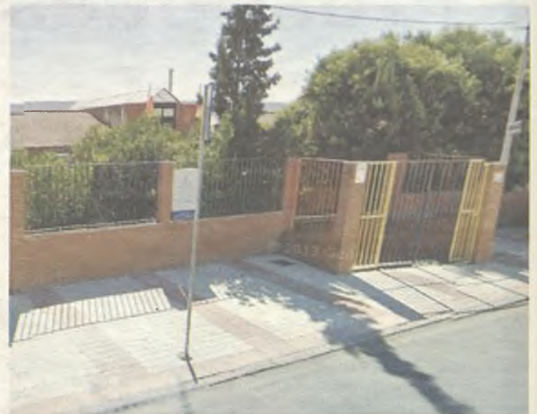
Un niño se escapó de esta guardería de Azuqueca de Henares.

Robisco quiere que "Page y su consejera de Educación, que es de Guadalajara, den explicaciones a este suceso". "¿Cómo es posible que un niño de 2 años pueda saltar dos cerrojos de la instalación, uno porque estaba roto, según reconoce la propia Consejería, pueda salir luego solo a la calle, deambular por las calles de Azuqueca y tenga que ser la Guardia Civil y los vecinos los que lo encuentren? ¿Pero en manos de quién estamos?".