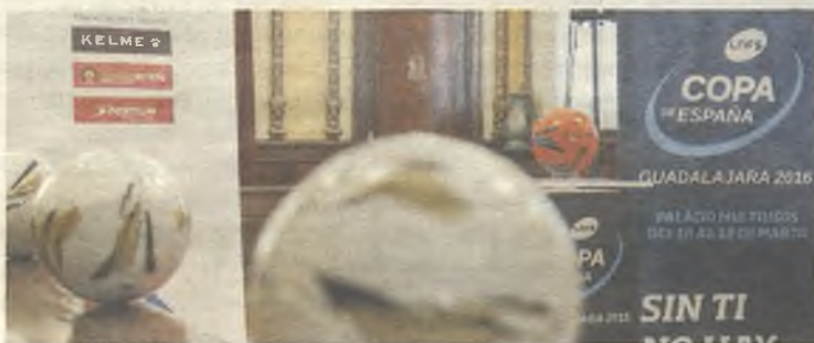
El balón de la Liga Nacional de Fútbol Sala volverá al Multiusos

una competición atractiva en la que la igualdad será la nota predominante, y que podrá ser vista en 43 países del mundo . Inter Movistar, Barcelona y El Pozo Murcia estarán en una cita que aún no tiene asegurada el actual campeón, el Jaén Paraíso Interior que está fuera de los ocho primeros clasificados de la Liga. Lo que es cierto que de jueves a domingo se vivirá un evento espectacular . ◆