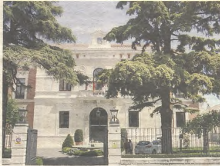
La Diputación vuelve a anticipar fondos a los ayuntamientos.

Además, estos 6 millones de euros se unen a los 3.712.939,07 euros de entrega a cuenta co-