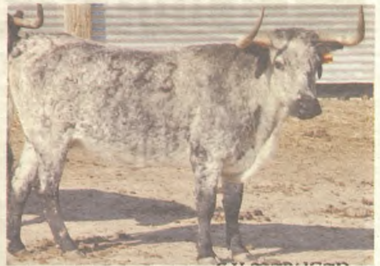
Una de las vacas de Los Maños que se soltarán en Yebra.