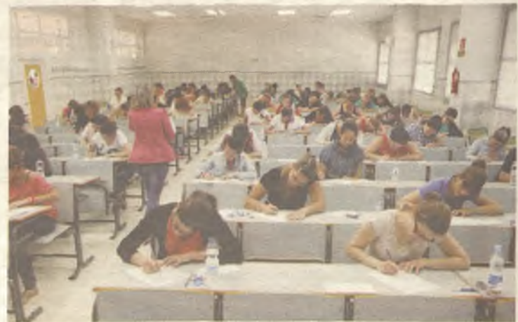
El gobierno regional ha prometido oposiciones a profesor de primaria.