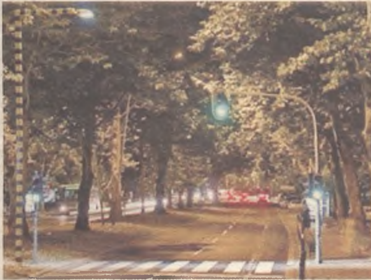
Así serán los NEO ZEBRA, que se iluminarán al cruzar los peatones.

Muchos son los cambios que están teniendo lugar. Para empezar, de las farolas de vapor de sodio se está pasando al LED. "Antes pasabas al lado de una farola y sonaba, pero una de LED no suena. Ese sonido era una fuga de energía", explica el vicecalde Jaime Carnicero.