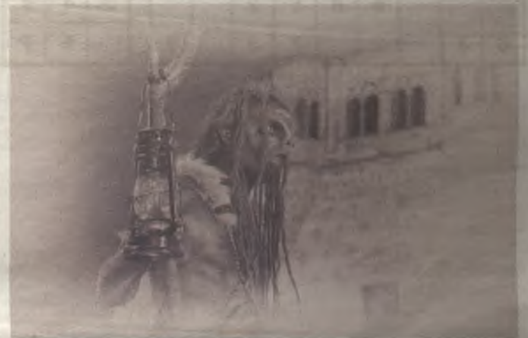
'Mytos', obra de Eduardo Bonilla. / FOTO: EDUARDO BONILLA

La entrega de premios y la inauguración de la exposición con las fotos premiadas y seleccionadas tendrá lugar el jueves 10 de diciembre, a las 20 horas, en la sala de exposiciones de Buero Vallejo. ◆