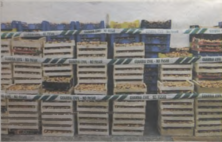
Cajas de níscales incautadas en nuestra provincia.

Denunciadas 55 personas en tres operaciones de la Guardia Civil