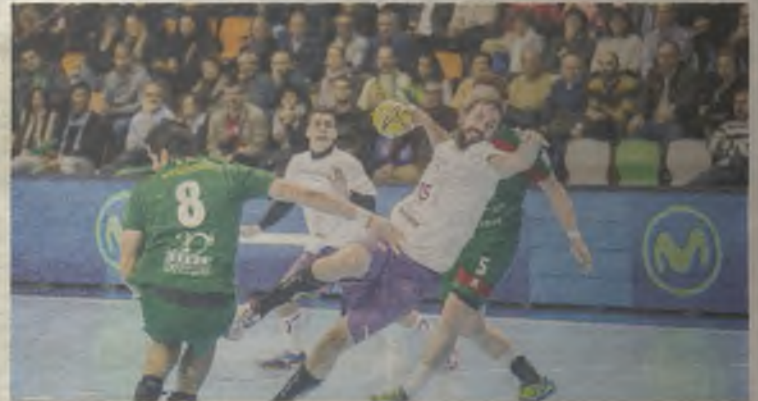
Bozalongo en una jugada de ataque del BM Guadalajara