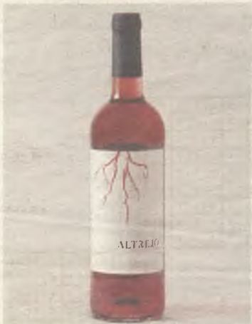
Uno de los vinos que pudieron catar.

A dicho acto concurrieron más de 30 personas, las cuales tuvieron oportunidad de catar 4 vinos diferentes de esta bodega: Vino rosado de la variedad tinta fina, Vino joven en la cual resaltaba el