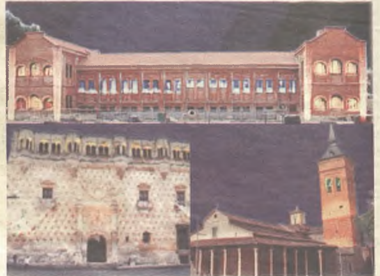
Los edificios más emblemáticos de la ciudad tendrán una iluminación espedal

También es importante la cuestión legal, ya que anteriormente casi la totalidad de los