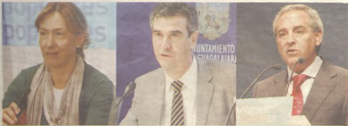
Corporaciones locales y organizaciones empresariales no están convencidos de las bonanzas del plan de empleo de Page.

Diferentes instituciones piden que se financie el 100%