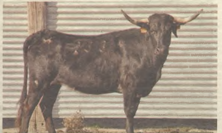
Las vacas de origen aragonés pertenecen a una ganadería en auge.

A partir de las 13:00 horas, hay previsto un baile vermú amenizado por una charanga y una hora más tarde, una caldereta. A partir de las 15:15 horas, habrá un desfile hasta el recinto de la suelta de reses. Y por último, a las 19:00 horas se sorteará una cesta y habrá una traca como cierre. ◆