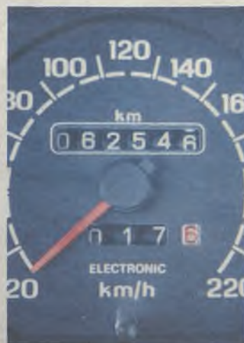
Reducían los kilómetros del vehículo.

L a Guardia Civil de Guadalajara, en el marco de la operación "Ortemodo", ha detenido a tres personas que presuntamente se dedicaban a la venta de vehículos a los que previamente habían manipulado su kilometraje para aumentar su valor en el mercado. Estas personas ejercían esta supuesta actividad delictiva en la localidad de Marchamalo. Al menos diez vehículos habían sido trucados.