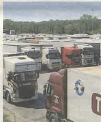
Los asaltos fueron en Cabanillas del Campo.

L a Guardia Civil ha detenido a 16 hombres con edades comprendidas entre los 19 y 42 años, por un delito de pertenencia a grupo criminal y por 27 delitos de robo con fuerza cometidos en camiones de mercancías cuando se encontraban estacionados en distintas áreas de descanso de la provincia de Guadalajara, entre otras.