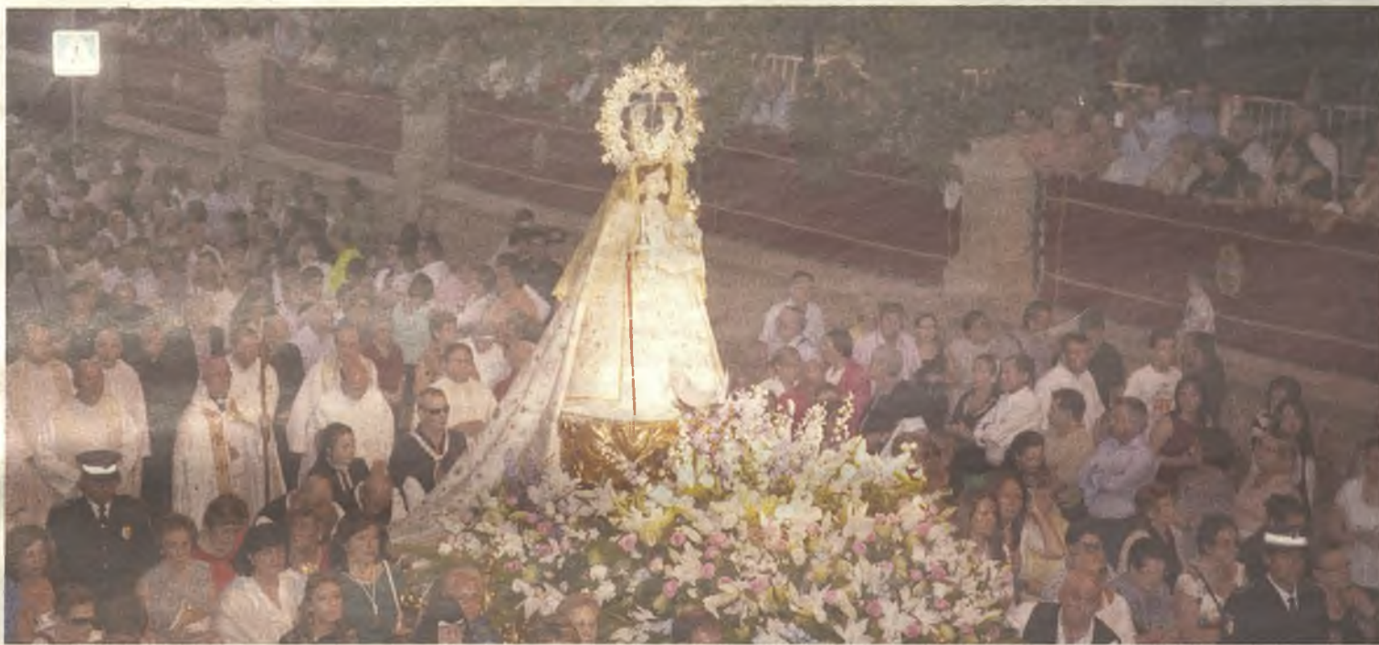
La Virgen de la Antigua volvió a estar arropada por miles de fieles durante su procesión del 8 de septiembre por las calles de Guadalajara.

L a procesión de la Virgen de la Antigua, patrona y Alcaldesa Perpetua de Guadalajara, volvió a marcar el epicentro de las Ferias