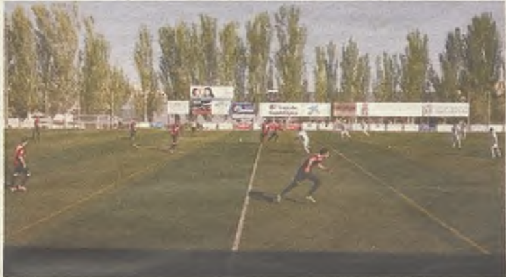
El Azuqueca lleva tres victorias en tres partidos.

al Villarrobledo en el San Miguel. Por su parte, el Marchamalo ha conseguido una victoria importante en el campo del Almagro por 0-1 y le colocan en la mitad de la tabla, en novena posición con cuatro puntos, después del empate que cosecharon en La Solana frente al Villarrobledo. ◆