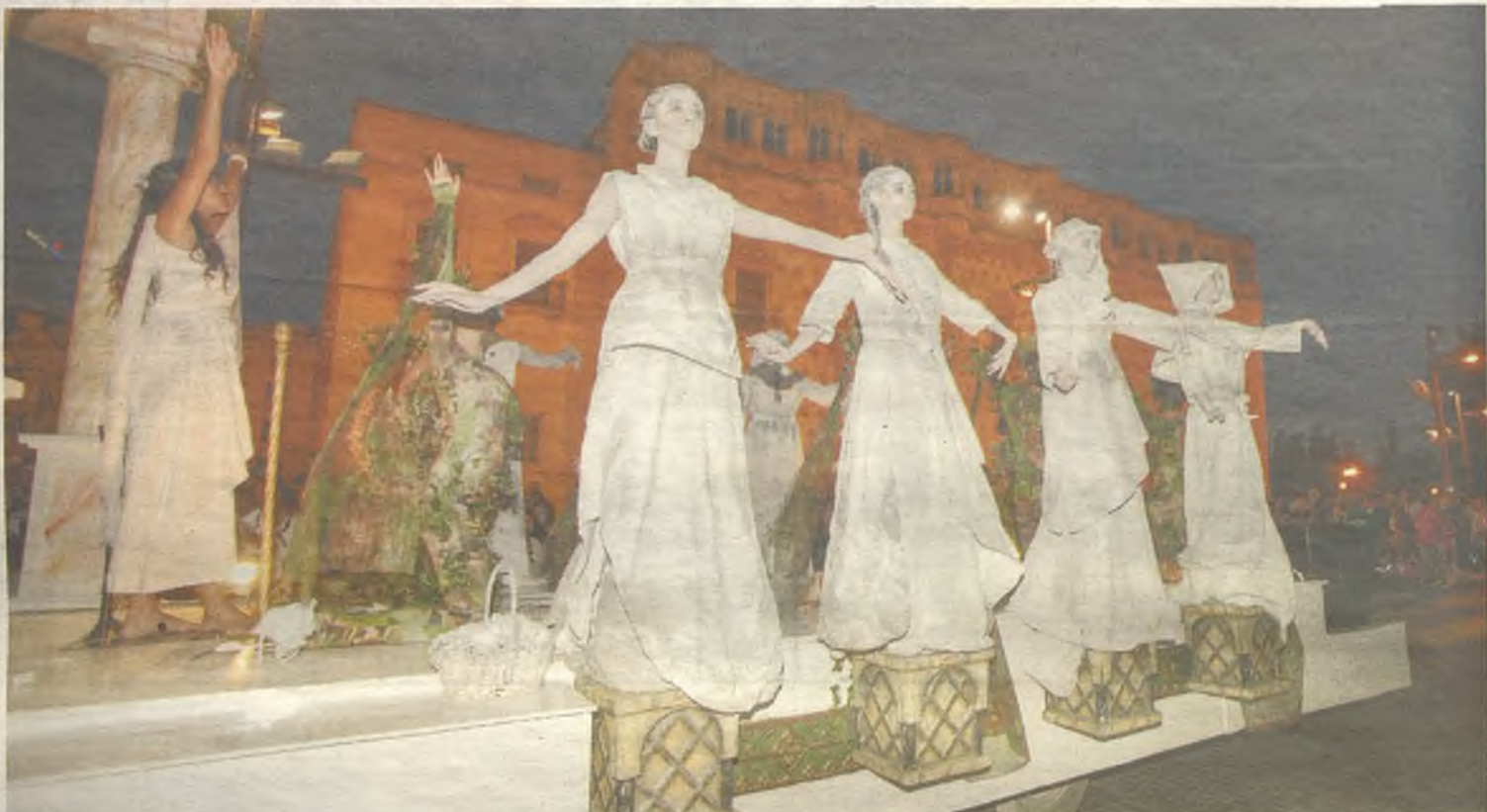
La mitología griega fue una de las más destacadas durante el desfile de carrozas.

El desfile comenzó en la calle Madrid y siguió por la Plaza de los Caídos, Avenida del Ejército, Cardenal González de Mendoza, Fernández Iparraguirre, Boixareu Rivera, Bejanque y calle Zaragoza.