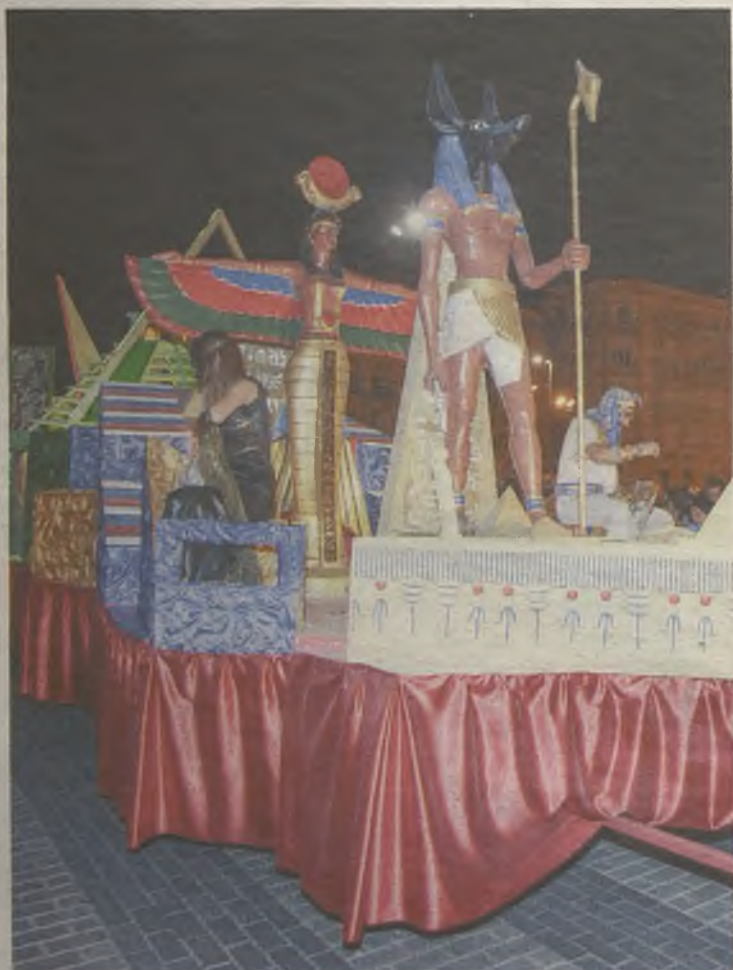
Egipto también estuvo representado durante el desfile.