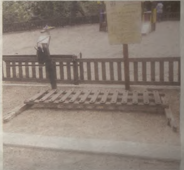
Así lucía una de las zonas de juegos infantiles de Azuqueca de Henares.

También denunció Ciudadanos el mal estado del colegio Virgen de la Soledad, algo que sí ha sido solventado. ◆