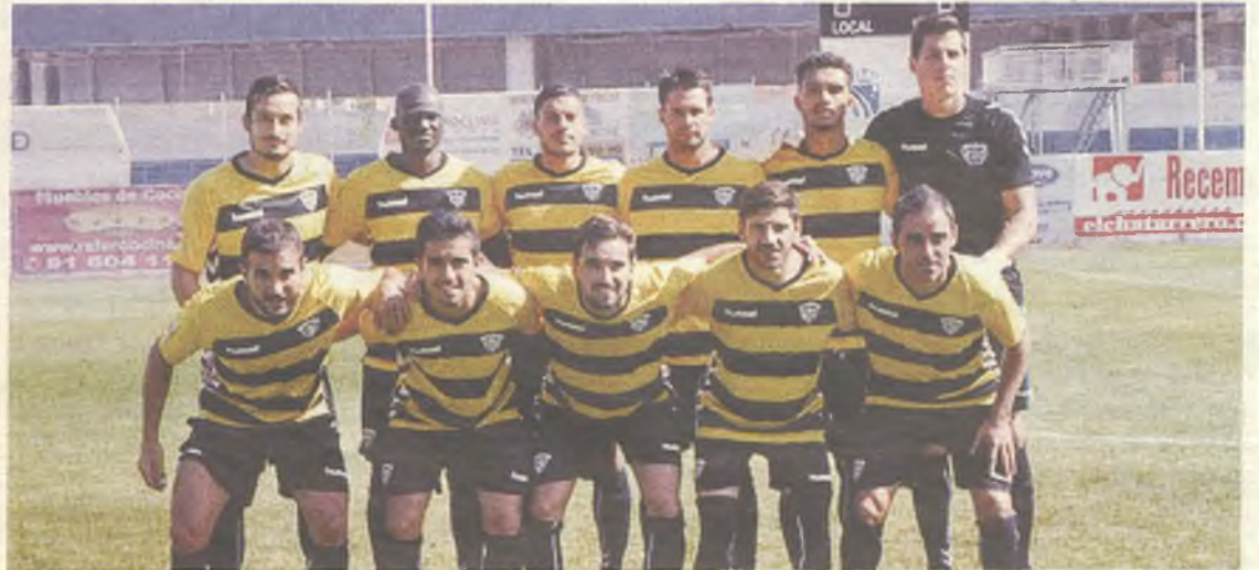
Once inicial del Dépor en el partido contra el Fuenlabrada.