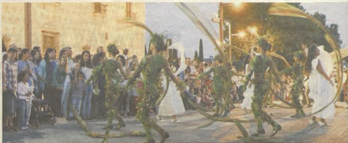
Bailes y coreografías que sorprendieron al público asistente.