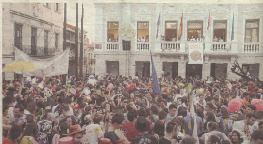
Las peñas 'explotaron' de alegría con el chupinazo.