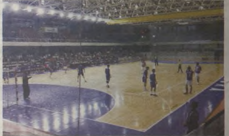
Los morados calientan antes del partido.

A la vuelta del vestuario, el BM Guadalajara fue a remolque de los de Pontevedra, que seguían sumando goles en su haber, alejándose del Guadalajara. Las