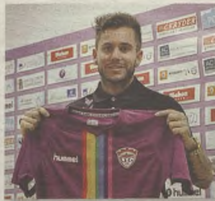
Marqués. / FOTO: CD GUADALAJARA