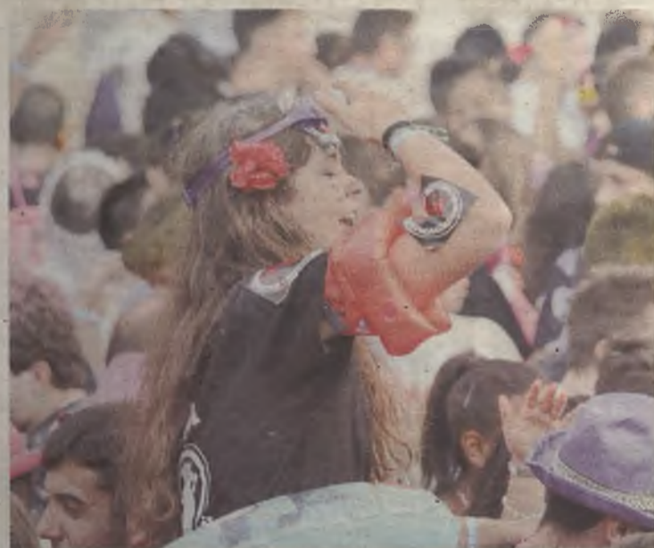
Los días principales de diversión comenzaron en ese momento.