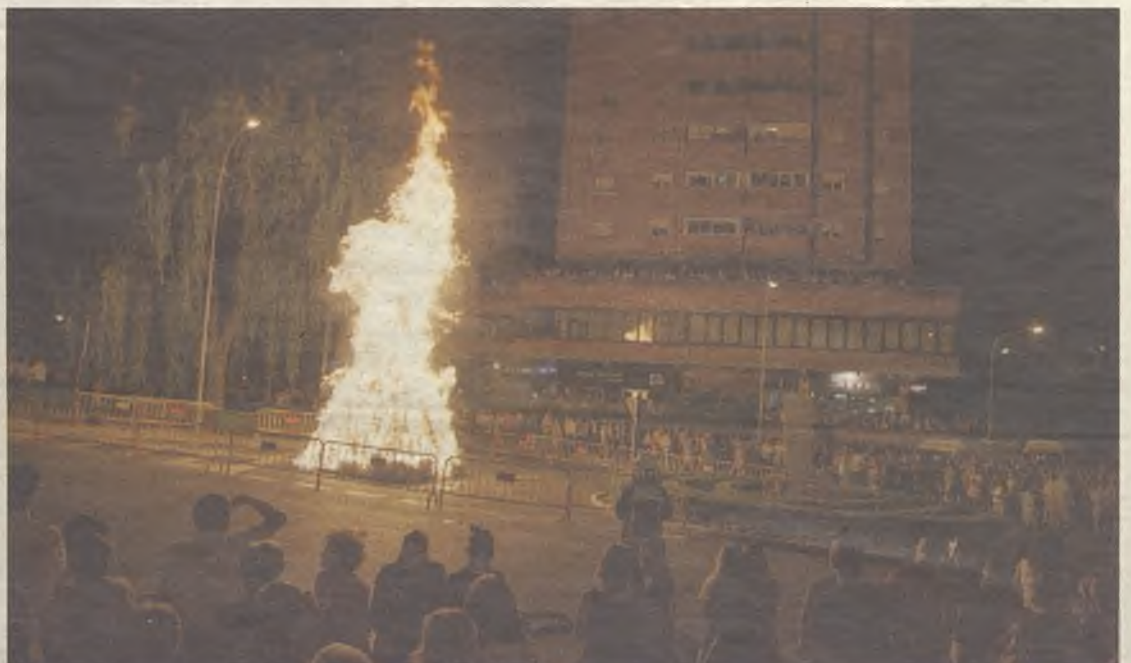
La tradicional quema de la hoguera marcó el final de la procesión.