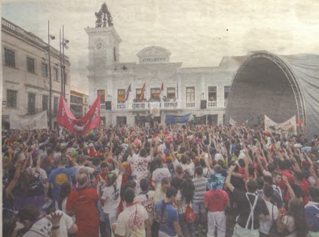
Cientos de personas abarrotaron la plaza Mayor para disfrutar de uno de los momentos principales de las Ferias.

destacó el protagonismo que las peñas cobran estos días. "Son el alma de las fiestas y sin ellas, nuestras fiestas, no serían las mismas". También hizo un llamamiento a los ciudadanos para que la tolerancia y el respeto ayuden a tener una convivencia pacífica en estos días . ♦