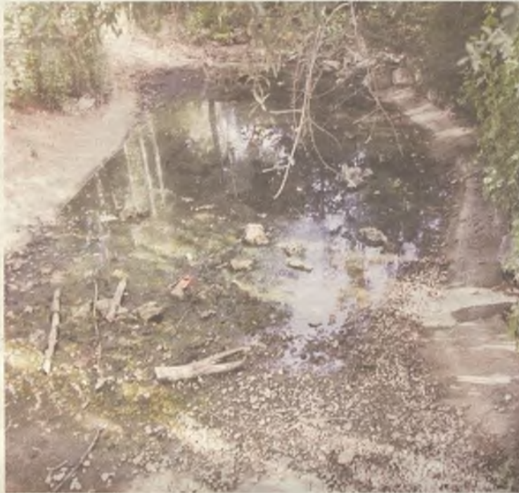
Estado de una de las zonas del Parque de la Quebradilla.

Algo similar opinan de este lugar desde IU-Ahora, después de hablar en los mismos términos del Parque Arboreto, situado en el barrio de Asfain, y el situado en la trasera del polideportivo Ciudad de Azuqueca. “Presenta papeleras rotas, zonas de juegos infantiles deterioradas, cajetines de luz sin tapas, por no contar el lamentable estado en el