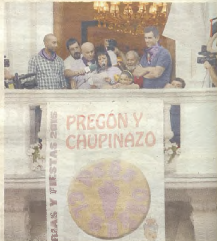
La peña El Tarro, protagonista del pregón y el chupinazo.