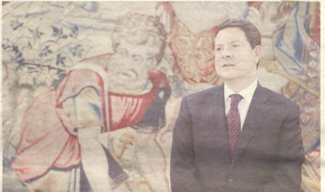
Los “errores” de García-Page al publicar su patrimonio fueron destapados por El Semanal Digital.

El Semanal Digital se puso sobre la pista de esta situación, después de detectar un incremento de 185.200,87 euros en las cuentas corriente y de ahorro de García-Page en tres años y medio, de los 152.713,70 euros que declaró en noviembre de