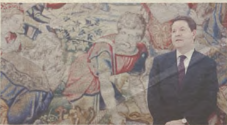
Emiliano García-Page, presidente socialista de Castilla-La Mancha.

E l socialista Emiliano García-Page, actual presidente de Castilla-La Mancha, habría ocultado casi 183.000 euros en su declaración de patrimonio al Senado durante los tres años y medio que perteneció a la Cámara Alta, según afirman unas informaciones de El Semana Digital. Esta cifra correspondería a un plan de pensiones de 90.000 euros en el banco ING y otros 92.889,70 euros de la venta de un terreno en Toledo