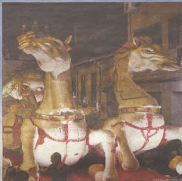
Gran desfile de carrozas

El Ayuntamiento de Guadalajara te invita a disfrutar de las Ferias y Fiestas 2015. Disfruta del chupinazo, del desfile de carrozas, de los grandes conciertos, de nuestros festejos taurinos, de la cultura, del deporte y de las atractivas actividades infantiles que hemos diseñado. Queremos poner la diversión al alcance de todos. ¡Felices Fiestas!