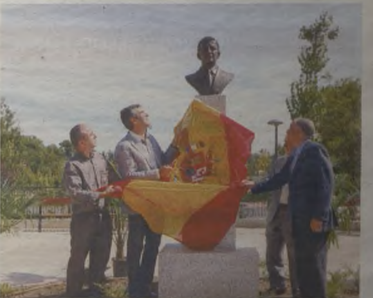
Guadalajara cuenta ya con un nuevo pulmón verde.

Tal y como explicó el presidente, se trata de un total de diez cursos becados con prácticas profesionales dirigidos a personas desempleadas de nuestra provincia con especiales dificultades. ◆