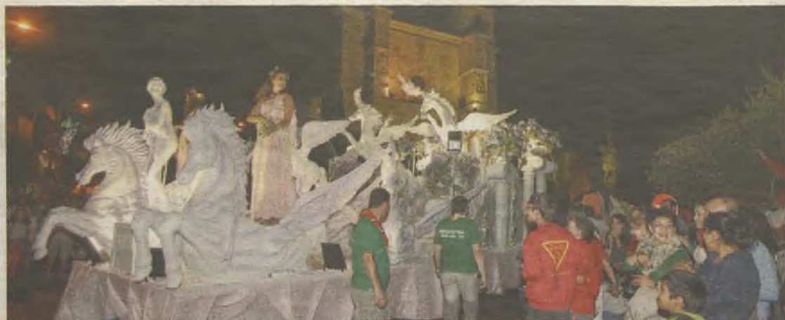
El desfile recorrió algunas de las calles más importantes de la capital alcarreña.