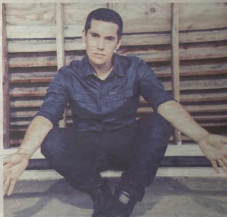
Maldita Nerea llegará a Guadalajara con su gira 'Mira adentro'.