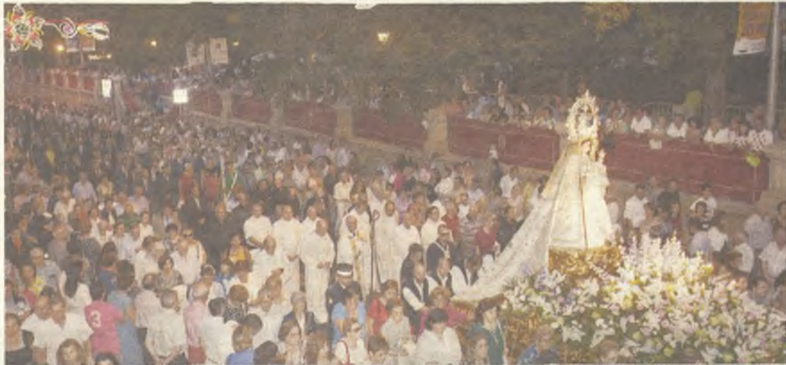
Miles de personas siguieron a la Virgen a lo largo de Boixareu Rivera.