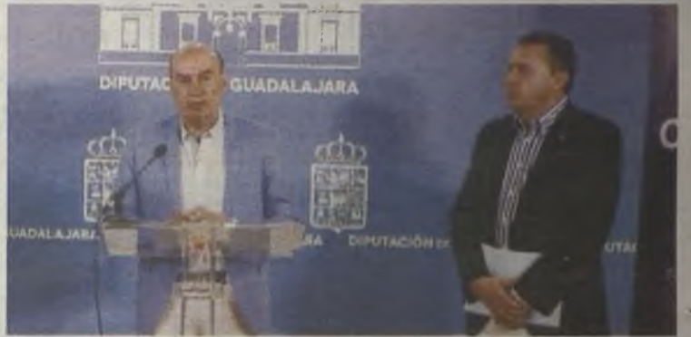
El programa llega a diferentes municipios de nuestra provincia.