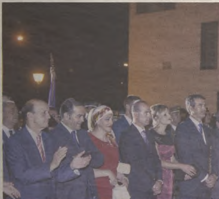
No faltaron las autoridades a la procesión de la Alcaldesa Perpetua.

De nuevo siguiendo la tradición, cuando la Virgen de la Antigua llegó a su casa, se prendió la hoguera, seguido del tradicional castillo de fuegos artificiales. ♦