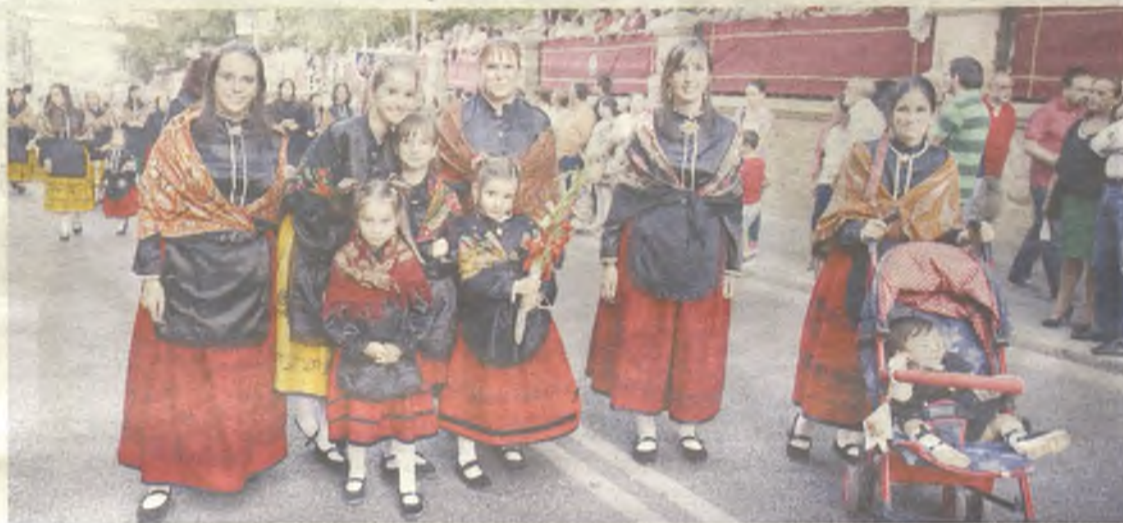
Jóvenes con el traje típico alcarreño a lo largo de toda la comitiva.