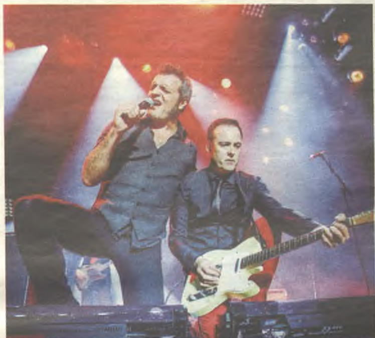
M Clan, protagonista en la Fuente de la Niña el miércoles 9 de septiembre.

Los conciertos de M Clan y de David Bustamante serán gratuitos, los días 9 y 11 de septiembre