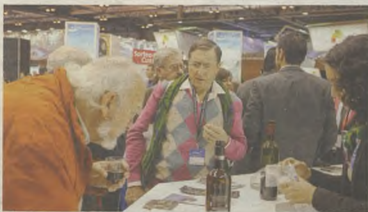
Fitur augura un nuevo éxito para el turismo de Castilla-La Mancha.

El último día de Fitur 2015, el domingo 1 de febrero, ha sido el elegido para que la provincia de Guadalajara muestre todos sus encantos en el stand de Castilla-La Mancha. El expositor, con una superficie total de 1.000 metros cuadrados, integra todos los atractivos turísticos que tiene la región, haciendo especial hincapié en el V Centenario del nacimiento de Santa Teresa y el IV Centenario de la publicación de la segunda parte de El Quijote.