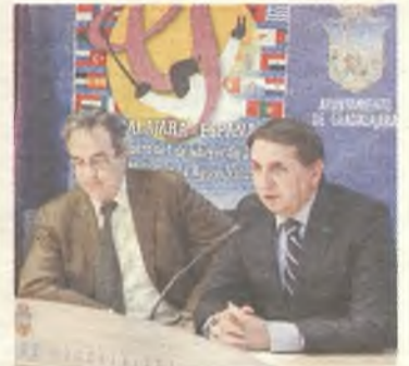
Presentación evento.