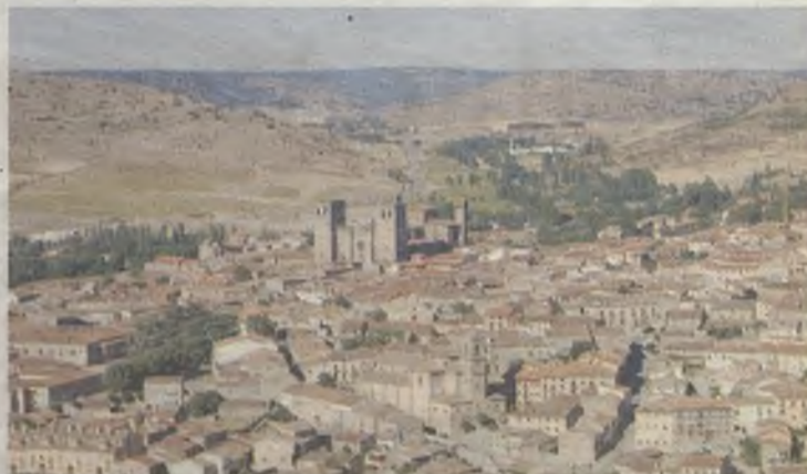
Vista aérea de la bella ciudad de Sigüenza.

E l municipio de Sigüenza registra anualmente más de 100.000 visitantes que quieren conocer la riqueza patrimonial. Desde 1996 han sido 1,8 millones los ciudadanos que han conocido este destino de Guadalajara. La Ciudad del Doncel, cuenta con un sinnúmero de recursos para el visitante, el más visible según se accede al municipio es el Castillo, hoy en día sede del Parador de Turismo. De esta manera, se puede compaginar gastronomía y patrimonio en la misma ubicación. En el centro neurálgico de Sigüenza, se ubica la Catedral dedicada a Santa María la Mayor, patrona de la ciudad de Sigüenza. Tuvo su origen en enero de 1124. A lo largo de la Ciudad del Doncel, se