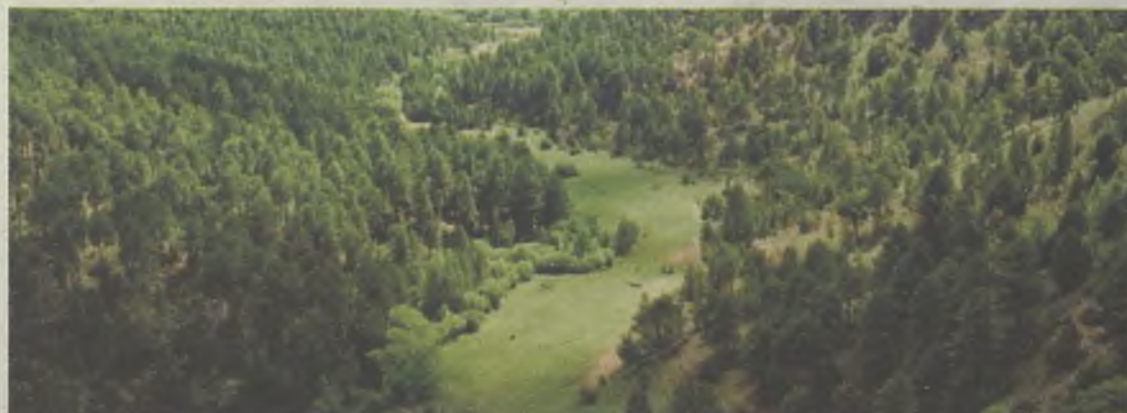
El Parque Natural del Alto Tajo es una de las joyas de Molina de Aragón

sitar El Hostal Los Batanes , antiguo harinero que ha mantenido toda la estructura y la cubierta primitiva. Y para comer, el restaurante El Castillo , está enclavado bajo el Castillo de Molina de Aragón, con dos acogedores salones que conservan la viguería antigua del antiguo edificio sobre el que se construye.