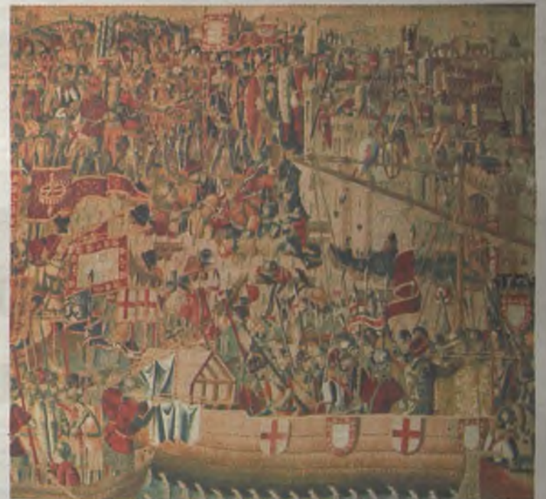
Detalle de uno de los tapices flamencos de Pastrana.

Muchos expertos aseguran que la de Pastrana es la mejor colección de tapices del mundo en estilo gótico flamenco. Se tejieron en Flandes, por encargo de la Casa Real portuguesa y, según algunos historiadores, fueron tomados como botín en la batalla de Toro (1476). Otros estudiosos, sin embargo, sostienen que fueron un obsequio personal del rey portugués, al gran Cardenal Mendoza. ◆