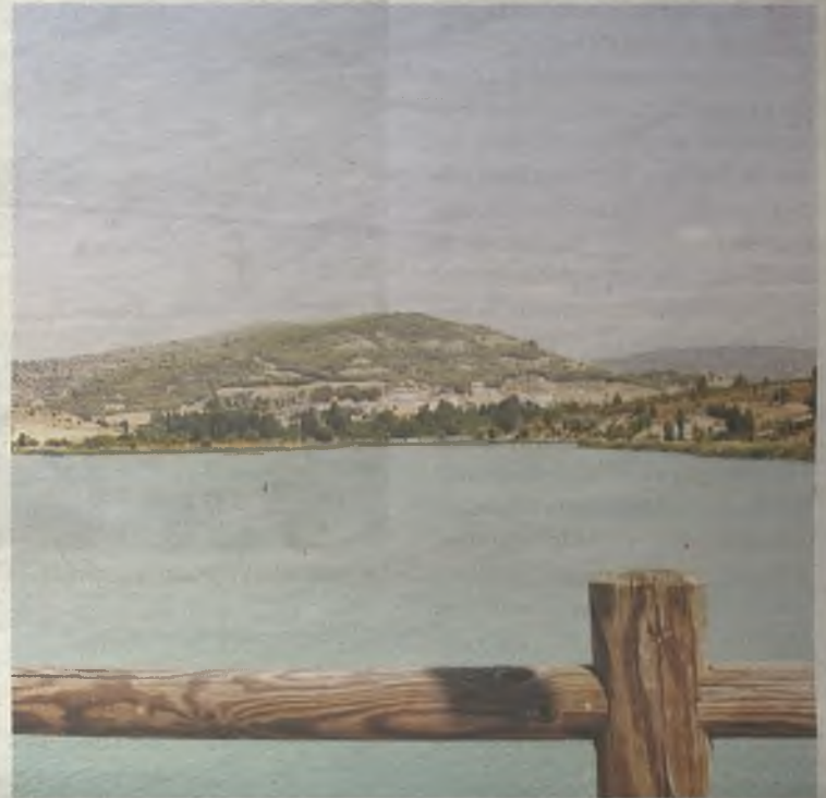
El azud de Pareja, una playa en Castilla.

Es difícil tener que elegir un restaurante de todos los que se encuentran en la Alcarria. Por ejemplo, en Pastrana, está El Cenador de las Monjas , en Hita. La