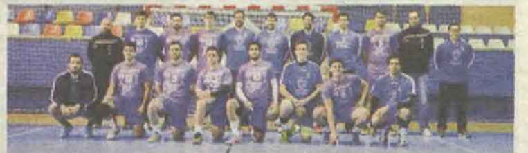
Primera victoria del equipo morado en el invierno.