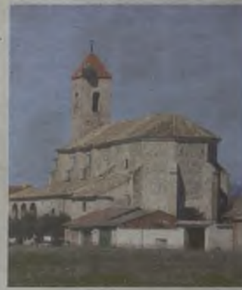
El turismo, gran activo para Guadalajara.

El atractivo turístico de Guadalajara es tan variado como su geografía. Las opciones pasan por la capital y su 'revolución deportiva', la belleza de Pastrana enriquecida como Ciudad Teresiana, la Alcarria y las diferentes formas de conocerla o la Campiña y su tranquilidad. También está la monumental Sigüenza, el Señorío de Molina y su naturaleza o el Hayedo de Tejera Negra. Y todo, salpicado de lugares donde disfrutar de su gastronomía y hospitalidad.