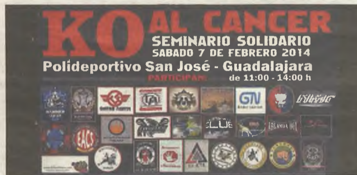
Cartel del entrenamiento-exhibición.

mo de Kung Fu y Sanda, para el próximo 7 de febrero en el polideportivo San José de la capital. El precio de las entradas a este evento es de 5 euros que se podrán adquirir en taquilla. Todo lo recaudado se donará a dos familias de niños con cáncer . ♦