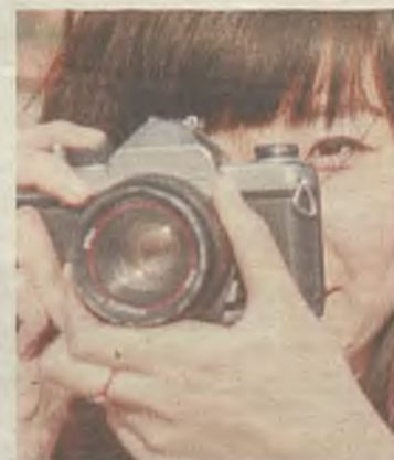
Éxito turístico en la región.

El número de visitantes en 2014 a Castilla-La Mancha fue de 1.903.893 personas, con un incremento del 9,2 por ciento (160.000 más que en 2013), mientras que en el caso de las pernoctaciones de la región se alcanzaron 3.167.243, con un aumento del 7,98 por ciento (234.155 más que en 2013).