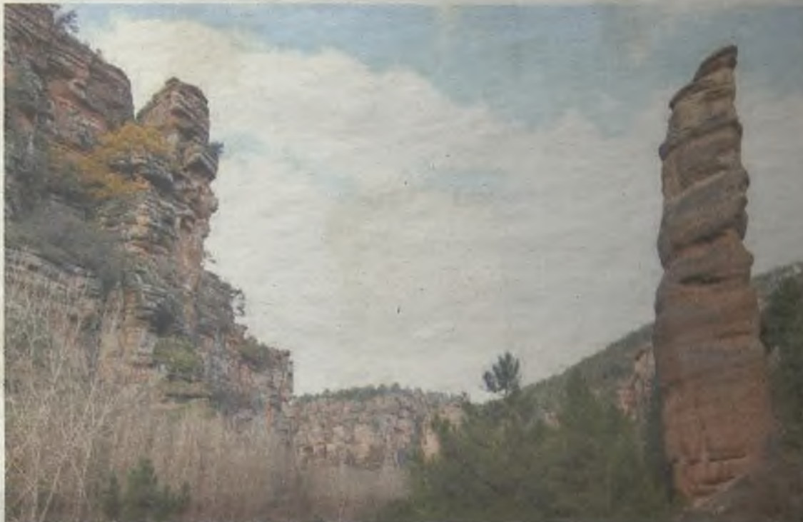
El Barranco de la Hoz muestra la riqueza natural del Señorío de Molina.

Aunque la lista de lugares para comer y dormir es infinita, podemos optar por el Restaurante El Castejón de Luzaga , y descansar en El Rincón de la Fuente Vieja de Maranchón , poseedor de dos espigas; dos lugares inolvidables que no nos dejarán indiferentes y de los que saldremos bien satisfechos.