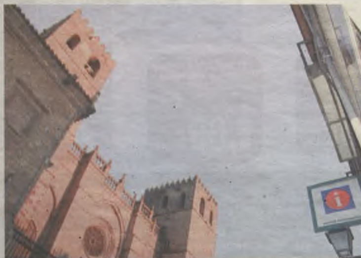
La catedral de Sigüenza sigue impactando a cada visitante.

D espués de computar las últimas cifras, la Concejalía de Turismo de Sigüenza acaba de hacer públicas las cifras oficiales de turistas, recabadas en el año 2014. Concretamente, han sido 102.772 los turistas que han acreditado su paso por la ciudad del Doncel en la Oficina de Turismo de la calle Medina. En total, desde que se tienen datos estadísticos (desde el año 1996) han visitado la ciudad casi 1,8 millones de personas. ◆