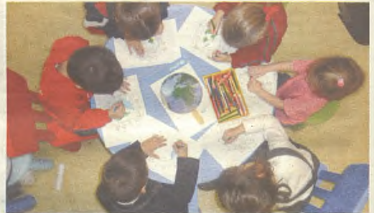
Guadalajara ha demostrado su apoyo a la infancia.

Diputación Provincial, me siento orgullosa de estos municipios de mi provincia que vuelcan sus políticas en favor de la infancia y la adolescencia, fomentan la participación infantil en los espacios reservados, apoyan la creación de planes de infancia municipales, impulsan políticas en beneficio de los niños y promueven el trabajo en red entre los miembros de una iniciativa. Son municipios que promueven e impulsan la aplicación de la Convención sobre los Derechos del Niño en el ámbito local y fomentan el trabajo en red entre los distintos municipios que forman parte de la iniciativa. ◆