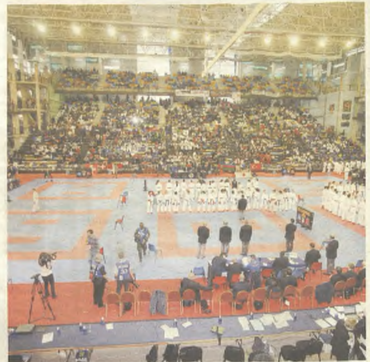
El deporte, nuevo foco turístico para Guadalajara.

Para hacer noche, grandes hoteles como el Trip , el Pax o el AC se combinan con otros más modestos como el España o el Ibis .