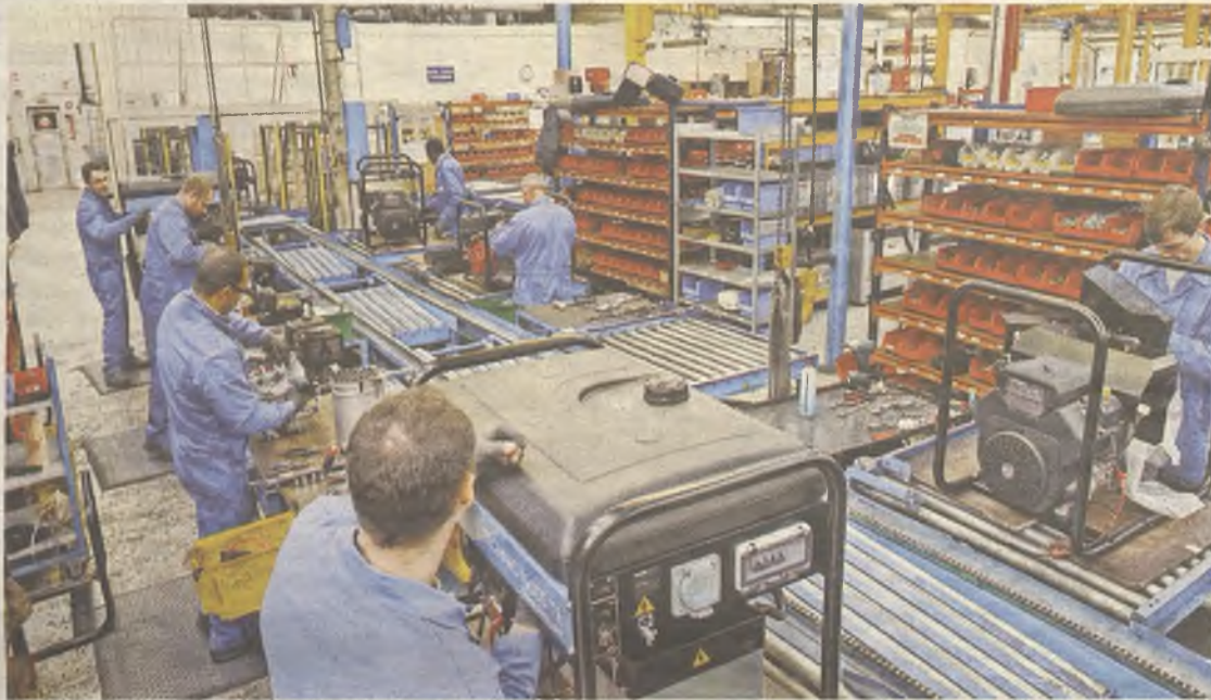
Guadalajara tiene menos parados ahora que hace cuatro años.

Cabe recordar que según la EPA, el desempleo en número de desempleados bajó en España en 477.900 personas en el 2014 y la tasa de paro se sitúa en el 23,7%, dos puntos menos que al finalizar el 2013 (25,73%). Por lo que respecta a Castilla-La Mancha se ha reducido un 0,80% respec-