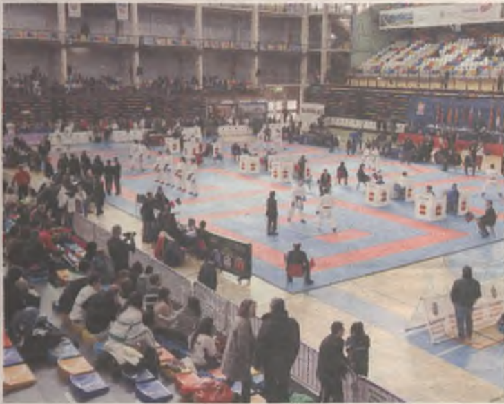
El Palacio Multiusos permitió hasta ocho combates a la vez.

El Campeonato de España senior y adaptado registró una buena tasa hostelera