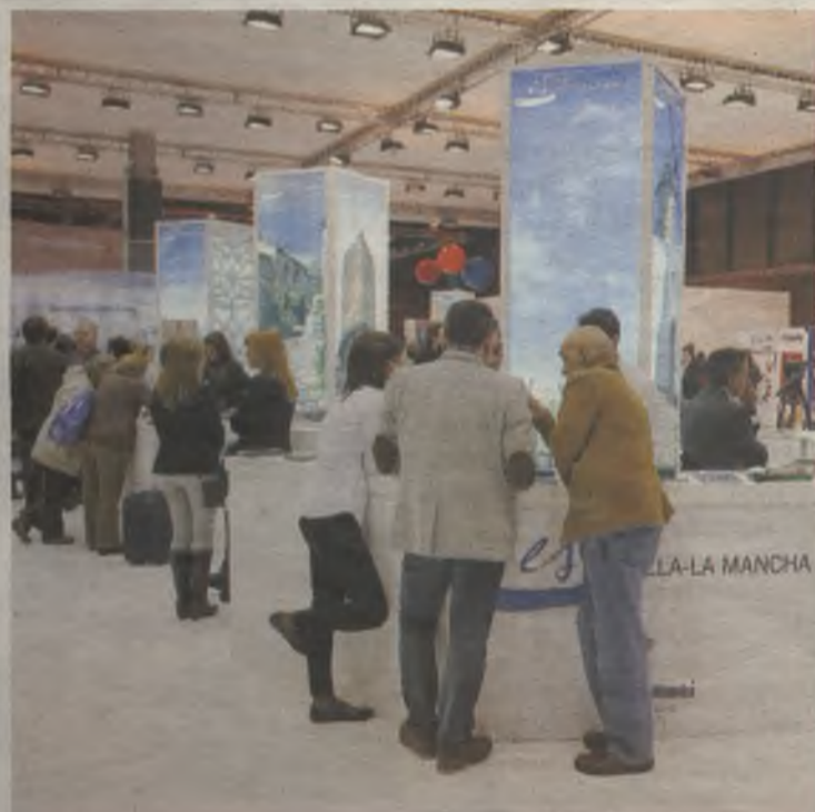
Fitur, siempre un éxito para la provincia y la región.