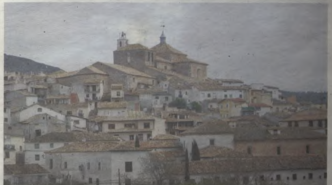
Pastrana está reconocida como conjunto histórico-artístico gracias al gran legado que la historia ha dejado por sus calles.