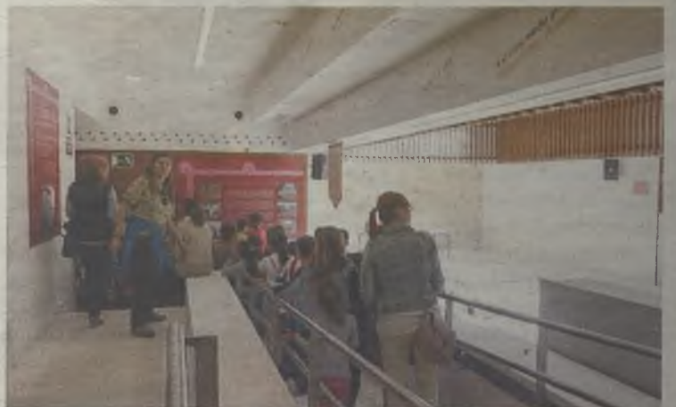
La Casa del Cordón ya ha recibido a cientos de visitantes.

Una buena opción para comer en Atienza es el restaurante El Ballenero , así como El Mirador de Atienza o Casa Encarna . También cuenta la localidad con diversas opciones para descansar, como el Antiguo Palacio de Atienza , La Casa de San Gil , el hostal El Mirador o el hotel Convento de Santa Ana . ◆