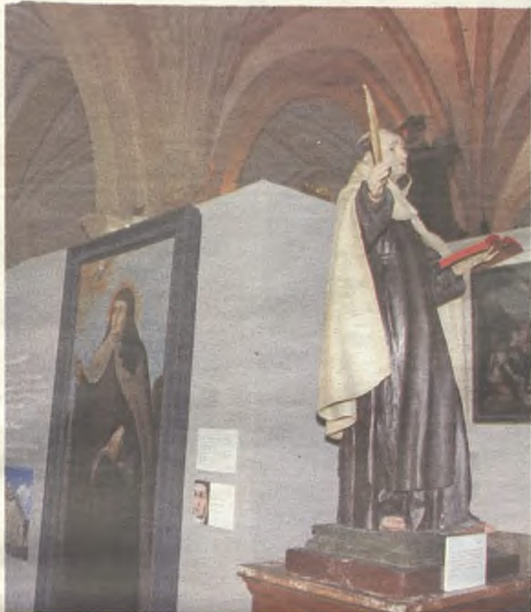
'Las Huellas de Santa Teresa', en la Colegiata de Pastrana.

Una de las grandes efemérides en Castilla-La Mancha a lo largo de 2015, será el V Centenario del nacimiento de Santa Teresa de Jesús, una de las grandes mujeres de la historia española que dejó su huella en varias localidades de la región.