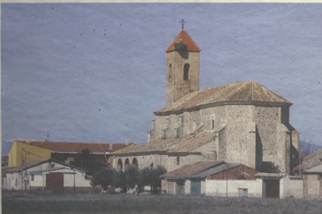
La iglesia de la Virgen de la Varga, en Uceda, imponente sobre los tejados de las viviendas.

Uceda, Yunquera de Henares, Humanes o Quer destacan en esta comarca guadalajareña