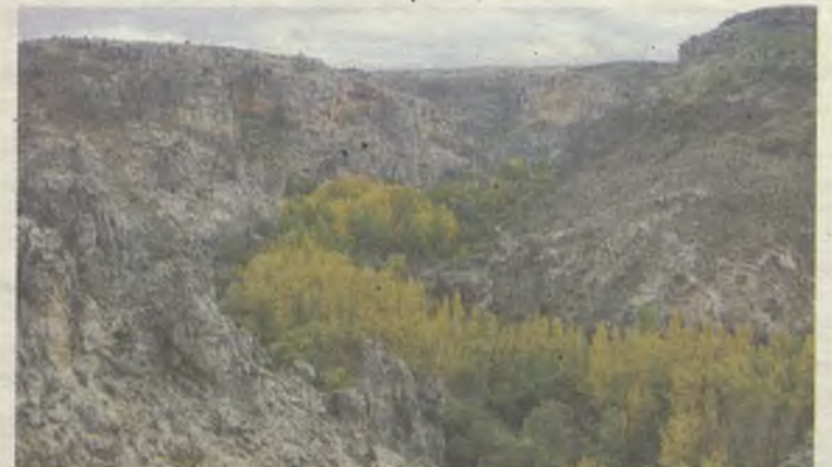
El río Dulce deja una bonita estampa a su paso.

entorno de este municipio, a ocho kilómetros de Sigüenza nos topamos con el Parque Natural del Río Dulce. Este es uno de los ejemplos de la riqueza natural que tienen las 28 pedanías de este municipio.