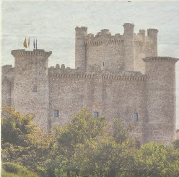
El castillo de Torija alberga el Centro de Interpretación Turística de Guadalajara.

Lugares como éstos y muchos más, atesoran la esencia de