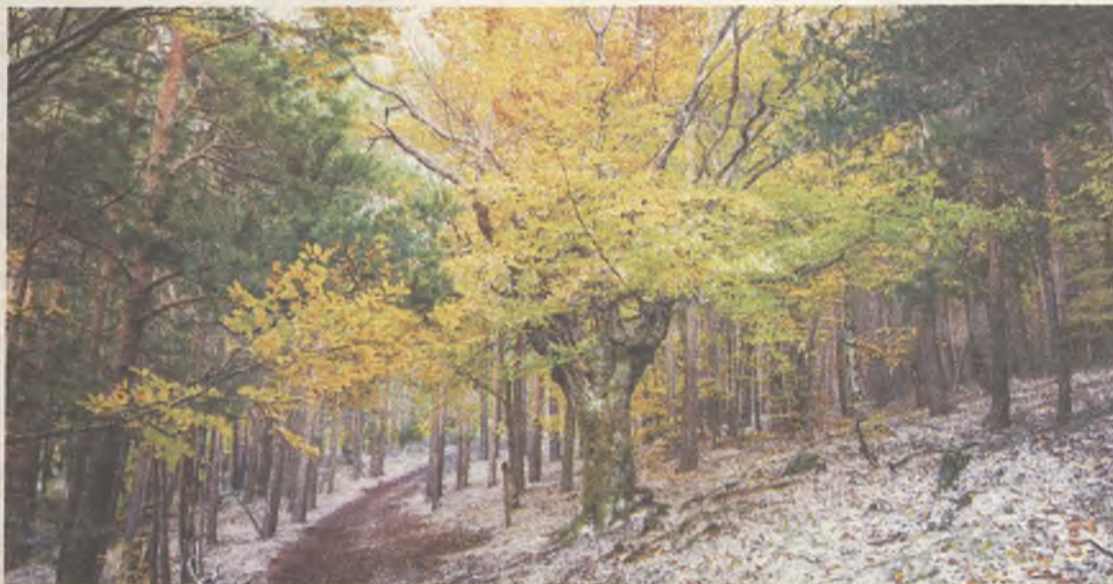
Los tonos ocre y rojos son protagonistas en el otoño del Hayedo de la Tejera Negra/ FOTO: EDUARDO BONILLA

El bosque de hayas, su mayor atractivo, tiene un ambiente de cuento: por sus colores, el musgo de sus suelos, y sus silencios. Además, crecen robles melojos, pinos silvestres, tejos, acebos y abedules. En su suelo, crece en otoño el apreciado Boletus Edulis , y se pinta el hayedo de cientos de tonalidades ocre y rojos; sus cielos los surca el águila real, so-