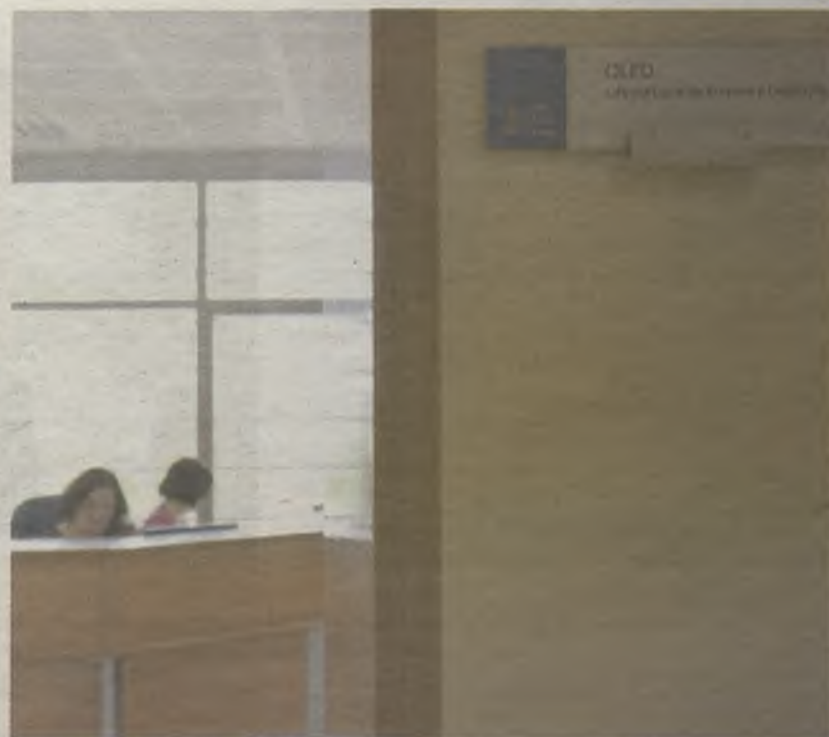
La OLED trabaja por el empleo de los guadalajareños.