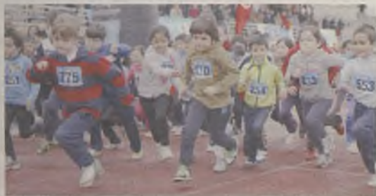
Nueva carrera solidaria por Níger/E.B.

El 30 de marzo tendrá lugar la sexta edición de la Carrera del Agua Gotas para Níger, organizada por la Mancomunidad de Aguas del Sorbe, Unicef y el Ayuntamiento de Guadalajara. Como cada año, todo lo que se recaude con la venta de dorsales irá destinado a un proyecto en el país africano para acercar el agua a la población. En la edición del año pasado, fueron alrededor de 700 las personas que participaron en la prueba.