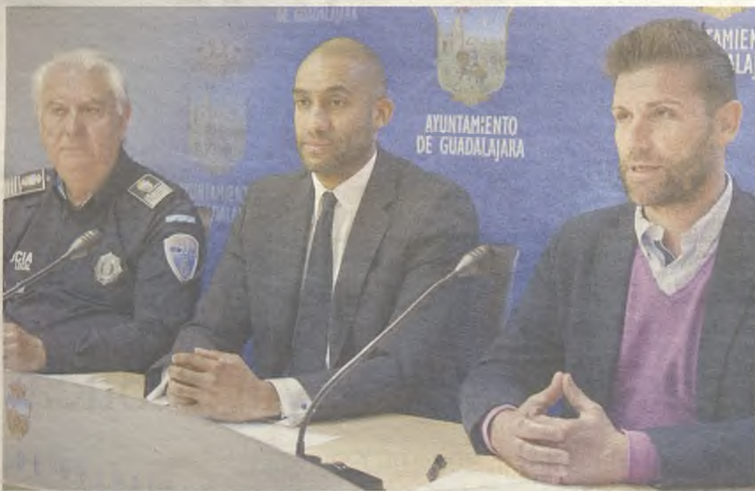
La Policía Local se está formando en mediación.

A través de este procedimiento será posible resolver de un modo rápido problemas de convivencia tales como los derivados de las molestias provocadas por animales, ruidos en vecindades, uso de zonas comunes para fines no definidos o incidentes de tráfico, entre muchos otros.