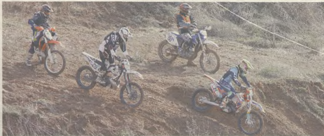
Unas 160 personas participaron en la prueba.

Con cerca de 160 participantes el histórico Moto Club Alcarreño ha organizado la tercera carrera del nacional de Cross Country. Con un recorrido muy bonito y con muchos aficionados animando a los pilotos, se ha celebrado esta cita que también ha sido puntuable para los campeonatos de