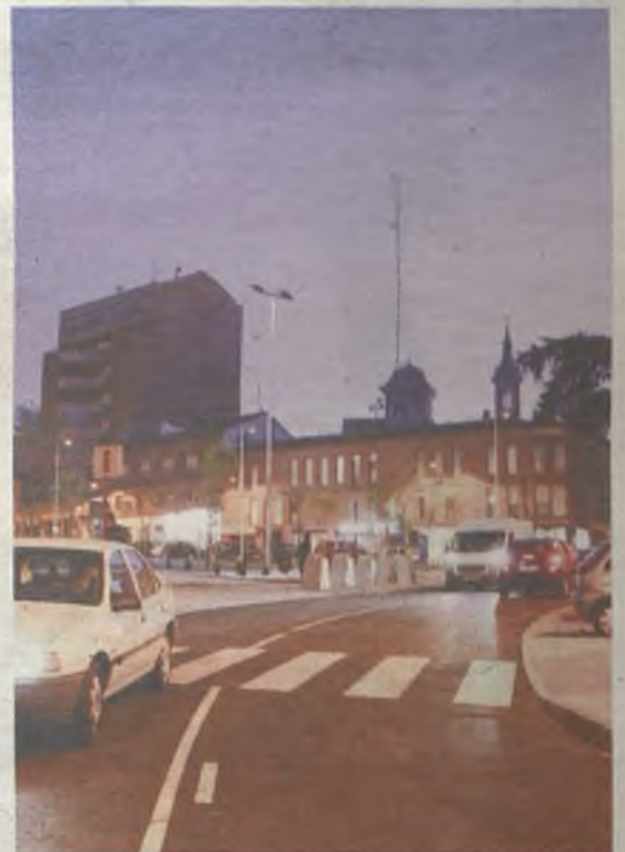
Prolongación de Pedro Pascual.

Las calles Cuesta de Calderón y Travesía de San Miguel han cambiado de sentido de la circulación, pasando ahora a ser ascendentes, para mejorar así la comunicación entre el entorno de la Diputación Provincial, el Eje Cultural y la plaza de Bejanque. También se ha abierto al tráfico la prolongación de Pedro Pascual.