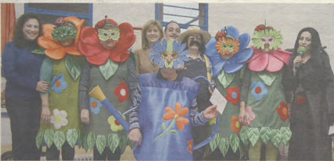
Concurso de disfraces de pensionistas y jubilados.