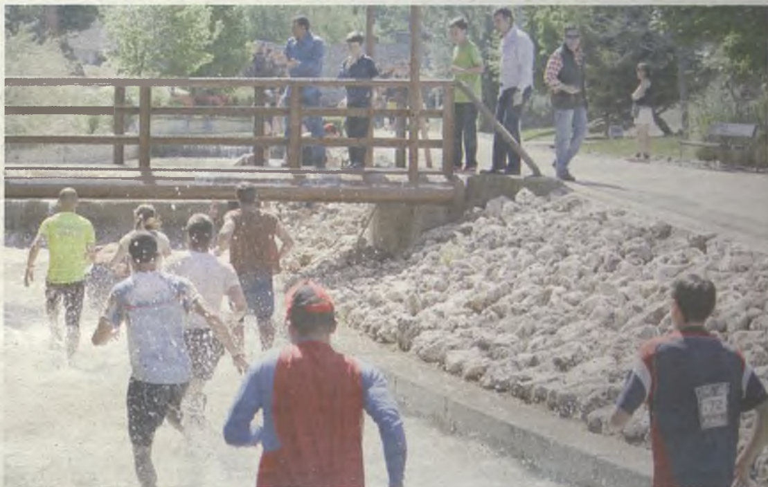
La primera edición de esta cita fue todo un éxito de participación./G30D

En 2013 se celebró en Guadalajara la primera Eternal Running, un evento en el que participaron alrededor de 1.500 personas. De ellas, alrededor del 70% procedió de fuera de Guadalajara.