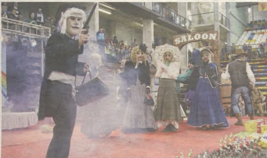
Uno de los grupos ganadores.

Multiusos, donde se concentraron cientos de personas. Por su parte, los pensionistas y jubilados también tuvieron su concurso, el lunes en el Centro Social de la calle Cifuentes. La quema de la sardina en el parque de la Concordia, durante el Miércoles de Ceniza, cerró el programa de actos.