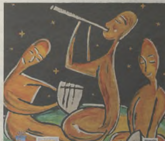
Detalle del cartel de 2013.

Las bases establecen un único premio de 600 euros para el cartel ganador. El trabajo premiado quedará en propiedad exclusiva del Patronato Municipal de Cultura. Las obras se presentarán o enviarán por correo a las oficinas del Patronato Municipal de Cultura, edificio del Teatro Auditorio Buero Vallejo, C/ Cifuentes, 30, 19001 Guadalajara, en días hábiles, de lunes a viernes, de 10 a 14 horas. El plazo de presentación de trabajos finalizará a las 14 horas del 25 de marzo. Las bases íntegras de la convocatoria se pueden consultar en la web municipal guadalajara.es .