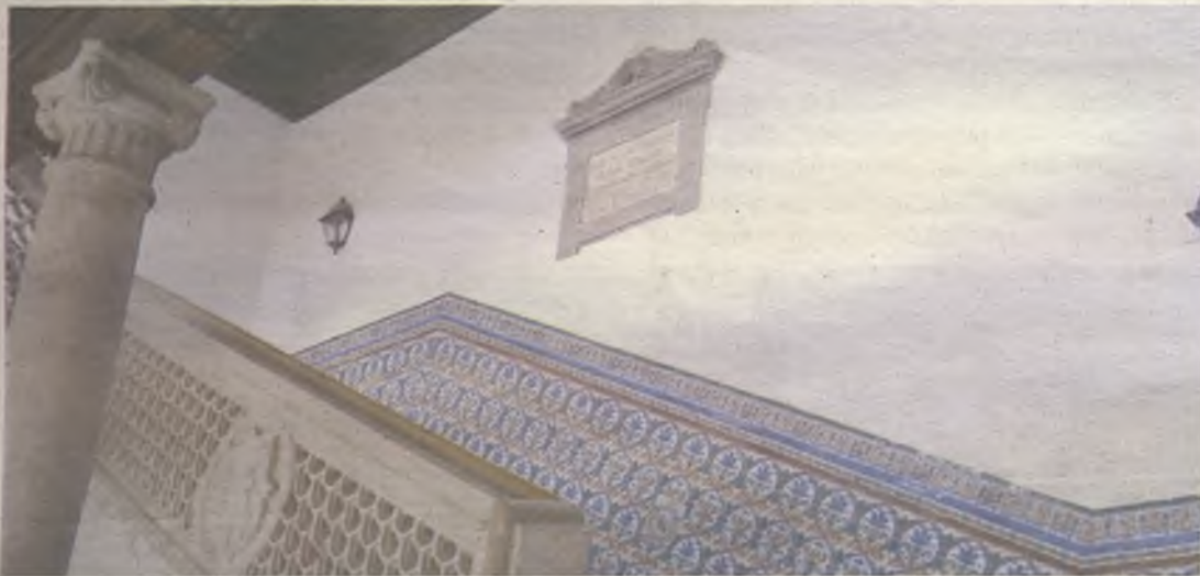
Escaleras de acceso para poder disfrutar del alfarje./Gu30D

edificio, emulando la forma de un panal de miel. Esta actividad tiene por objeto dinamizar y acercar parte del patrimonio más desconocido de la ciudad a todos los públicos.