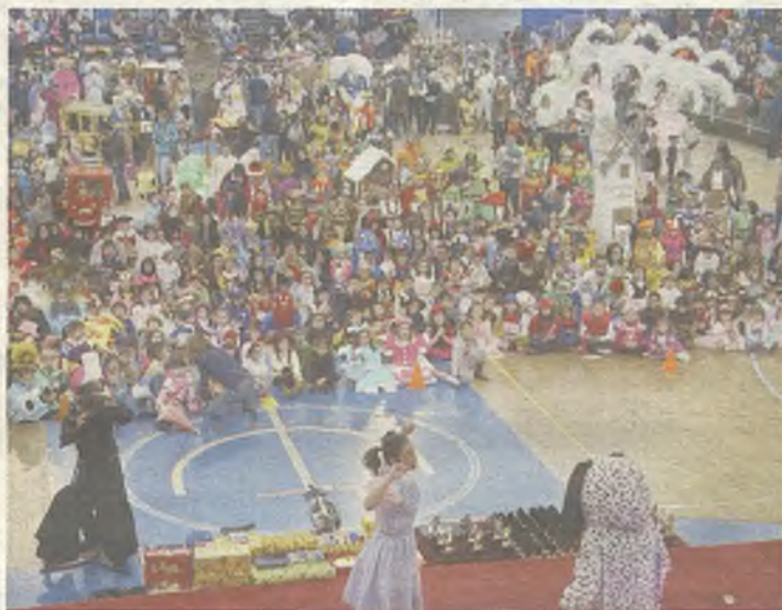
Concursos de disfraces adulto e infantil.