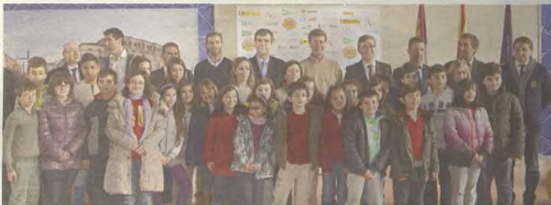
Los niños de la ciudad aprenderán los valores del deporte.