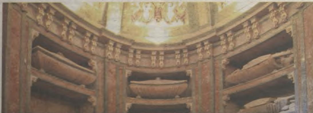
Cripta de los Mendoza, en la iglesia de San Francisco./G30D

Por su parte, los horarios de visita a la iglesia y cripta de San Francisco tendrá el mismo horario que el resto de monumentos del programa Guadalajara Abierta (Torreones del Alamin y Alvar Fáñez de Minaya, Capilla Luis de Lucena y Palacio de la Cotilla): viernes y sábados, de 11.00 a 14.00 horas y de 17.00 a 19.00 horas. Domingos y festivos, de 11.00 a 14.00 horas. Mientras, el Convento de la Piedad, sede del IES Liceo Caracense, solo estará abierto al público los sábados y los domingos.