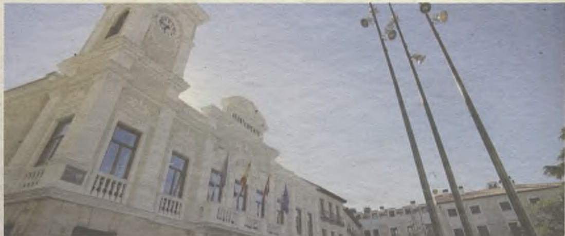
El Ayuntamiento continúa realizando una rigurosa gestión económica.

año, por primera vez, desde 1997, ha podido aplicar una bajada en determinados impuestos y tasas municipales. Además, se han ampliado las ventajas económicas que proporciona el adherirse al denominado Sistema Especial de Pago de impuestos, incrementando del 2% al 4% las bonificaciones que se obtienen a través de él. Cerca de 9.000 vecinos de Guadalajara ya se están beneficiando de un sistema que, además, les permite pagar los principales tributos en nueve cuotas y sin intereses.