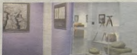
Exposición Guadalajara en la Historia./G30D

Para participar hay que inscribirse previamente en el Patronato Municipal de Cultural en el teléfono 949 247050.