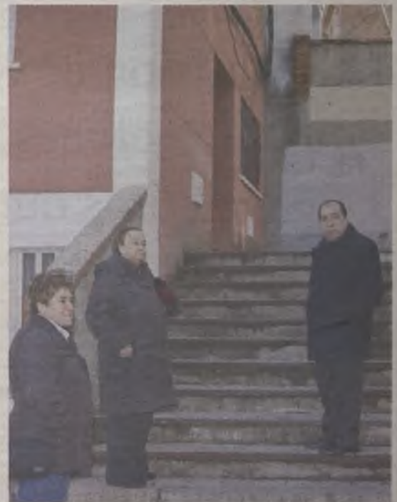
El edil de Servicios Públicos visitó la Era del Canario./J.R.

Junto a estas actuaciones, a lo largo del año se acometerán también los habituales trabajos de reparación y mejora de pavimentos de las aceras y de las calzadas de la zona.