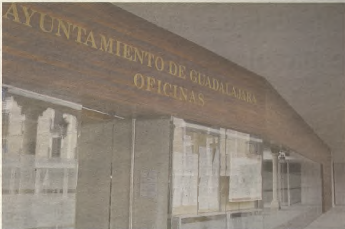
La bajada de los impuestos, la primera desde 1997.

Estas actuaciones son compatibles con la garantía de unos servicios públicos de calidad y con el desarrollo de programas tendentes a la