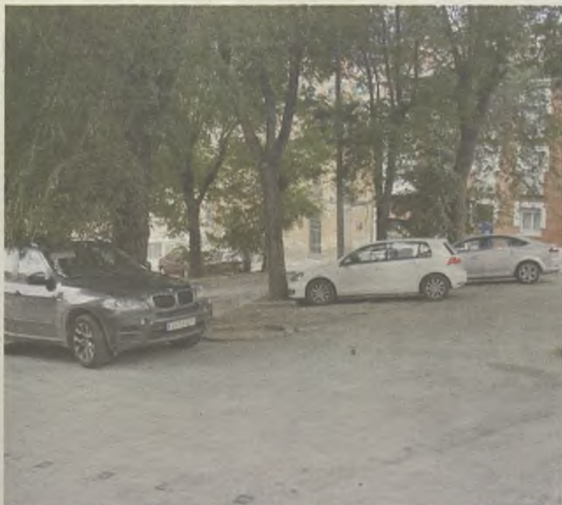
La Plaza de Dávalos pronto será remodelada.