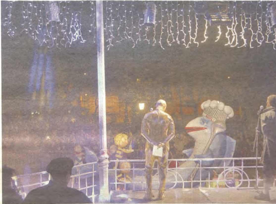
El Parque de la Concordia volvió a ser el lugar elegido para la quema de la sardina./Jesús Ropero