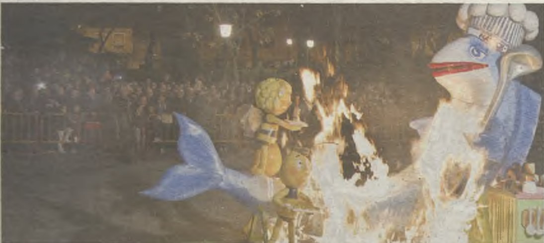
Quema de la sardina, en el parque de la Concordia.