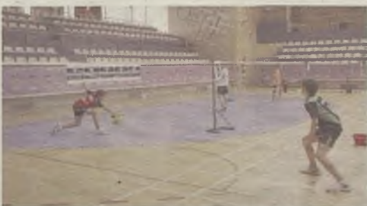
El Badminton, nuevamente protagonista.

La XIX Edición del Torneo de Badminton Ferias y Fiestas de Guadalajara resultó un éxito deportivo y de participantes