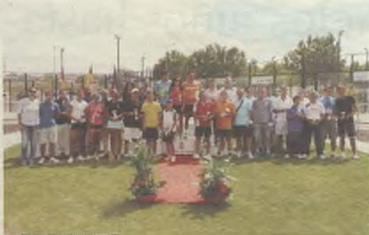
El tenis ha vuelto a ser protagonista.