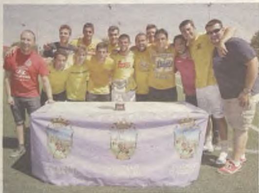
Los integrantes del BO2 con el trofeo.

La peña BO2 se coronó como vencedora del XI Torneo Interpeñas de Fútbol 7, que tuvo lugar en el Jerónimo de la Morena el domingo 1 de septiembre, tras imponerse en la final a la organizadora del evento, La Carioquita. Para ello tuvieron que esperar a la tanda de penaltis.