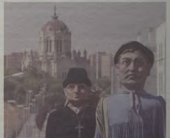
Estos personajes no pueden faltar en Ferias.