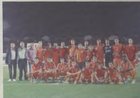
El Depor B se impuso con autoridad