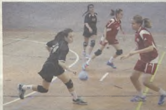
Las promesas del balonmano dan la talla.

El balonmano, está de moda, en la capital gracias al proyecto del Balonmano Guadalajara en la máxima categoría. Por este motivo no podía faltar en el programa de Ferias y Fiestas y el sábado 7 de septiembre fue el protagonista desde por la mañana, hasta bien entrada la tarde, en el Multiusos de Aguas Vivas y en el polideportivo del colegio El Doncel. Un cuadrangular con equipos de base llegados desde muchos lugares de la geografía española que se marcharon de la capital encantados. No faltaron nuestros vecinos del Ciudad Encantada de Cuenca, el BM Coslada madrileño y, por supuesto, el BM Guadalajara.