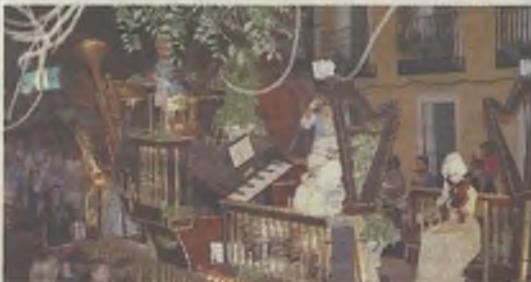
Una de las espectaculares carrozas.

Un año más las Fiestas contaron con su tradicional desfile de carrozas por las calles de la capital. En esta ocasión la Historia de la Música fue la protagonista de un evento que destacó por su espectacularidad. El desfile tuvo que variar su recorrido habitual de los últimos años para evitar las obras del Eje Cultural y resultó un éxito de público. Durante horas la comitiva musical recorrió las calles alcarreñas llenando de magia los primeros días de fiestas.