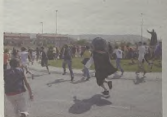
Los cabezudos provocaron más de una carrera.

De nuevo la tradición volvió a las calles de la ciudad con los gigantes y cabezudos. Ayer domingo, en los momentos previos a la misa solemne, pudieron desfilan en un pintoresco pasacalles por el barrio de San Francisco y la colonia Sanz Vázquez. Además, una vez finalizado el acto religioso, realizaron sus particulares bailes en la zona del Fuerte.