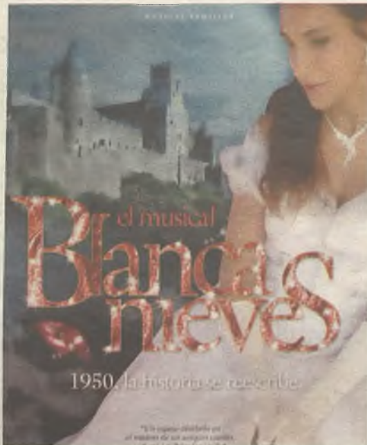
Cartel del espectáculo.