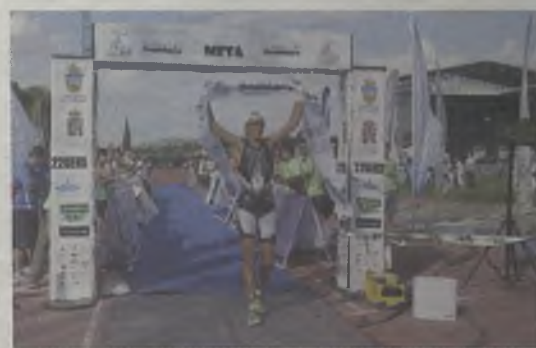
Una vez más protagonista de las Ferias.

Pasadas las cinco de la tarde llegaba a las pistas de atletismo de la Fuente de la Niña el primer triatleta con la intención de recorrer a pie 20 kilómetros por las calles de Guadalajara. La buena temperatura hizo que miles de vecinos de Guadalajara se echaran a las calles para apoyar a estos 310 superdeportistas. Finalmente y tras