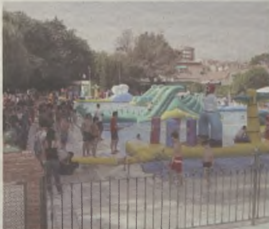
Los pequeños disfrutaron de las atracciones.

De la seguridad de todas estas actividades estuvieron pendientes en todo momento los socorristas de las piscinas, así como miembros de Cruz Roja, Protección Civil o de la empresa Ecoaventura.