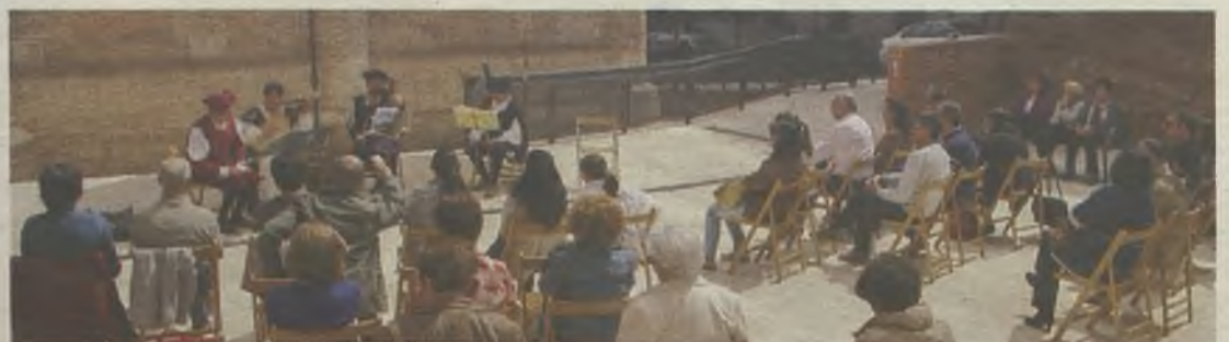
Última actuación frente a la Capilla de Luis de Lucena.

El ciclo Monumentos con Letra y Música se ha clausurado con un extraordinario concierto de música y la teatralización de antiguas leyendas de la historia de la ciudad. Este último concierto se celebró en la plaza situada junto a la Capilla de Luis de Lucena con una buena respuesta del público. Esta actividad estaba incluida en el programa dedicado a la figura de Álvaro Fáñez de Minaya en el novecientos aniversario de su fallecimiento.