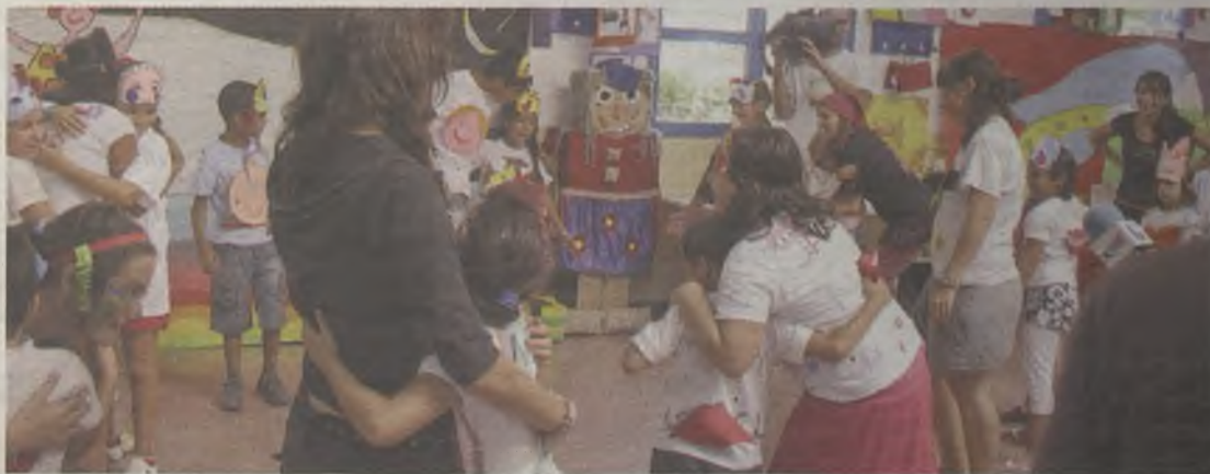
Juegópolis en el centro social de la calle Cifuentes.