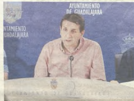
Este evento fue presentado por Eladio Freijo.

La mayoría de las pruebas son escolares. Habrá carreras de velocidad, de corta y media distancia, un concurso de longitud y unas carreras de relevos mixtos. El plato fuerte de la cita