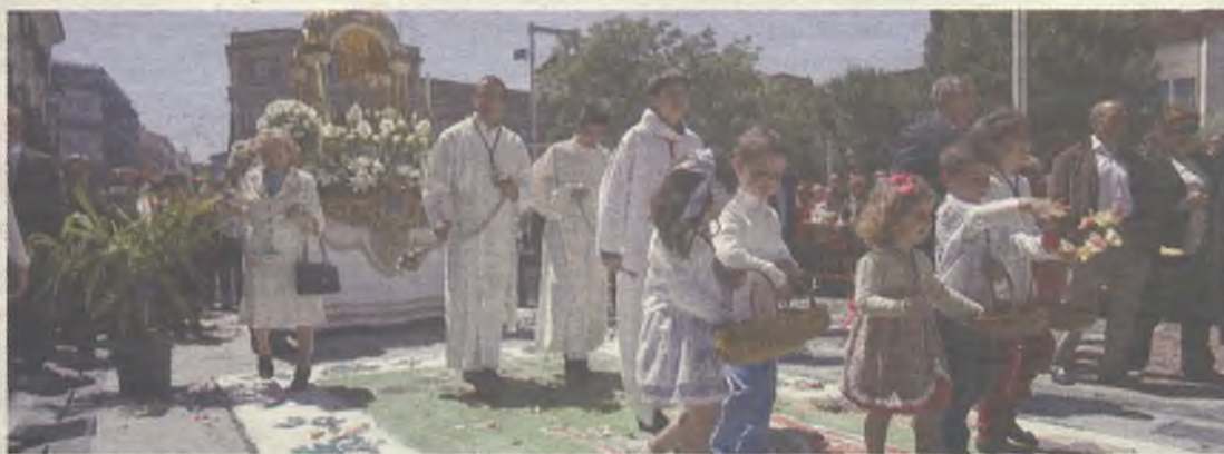
Niños y niñas vestidos de comunión acompañan a los apóstoles.

Declarada recientemente Bien de Interés Cultural, el domingo 22 de junio se celebrará la tradicional procesión del Corpus Christi protagonizada por la centenaria Cofradía de los Apóstoles –la más antigua de la ciudad– y los niños y niñas que este año han recibido la primera comunión. Saldrá de la iglesia del Fuerte de San Francisco y realizará su recorrido tradicional hasta llegar a la concatedral de Santa María. Como es habitual, distintas cofradías realizarán sus altares en Santo Domingo, Jardínillo, Miguel Fluiters y Santa María. En la calle Miguel Fluiters, la Cofradía de la Pasión del Señor realizará la alfombra floral.