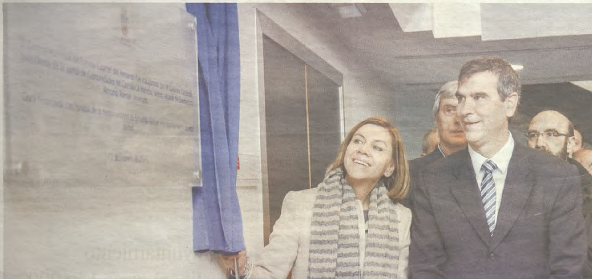
El Centro de Familia fue inaugurado por el Alcalde de Guadalajara, Antonio Román, junto a la Presidenta de Castilla-La Mancha, María Dolores Cospedal.

El Ayuntamiento ha invertido en él alrededor de dos millones de euros Dará servicio a toda la ciudad y especialmente al barrio de Los Manantiales