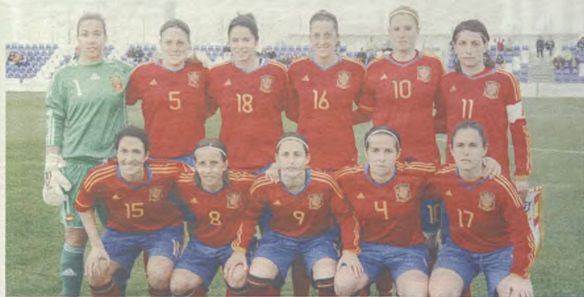
Las mejores futbolistas españolas estarán en Guadalajara./Gu30D

El 3 de marzo, en partido preparatorio para el Mundial de Canadá