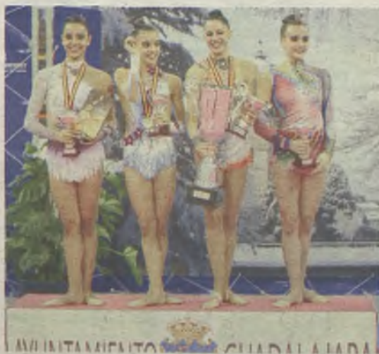
La gimnasia rítmica, protagonista.