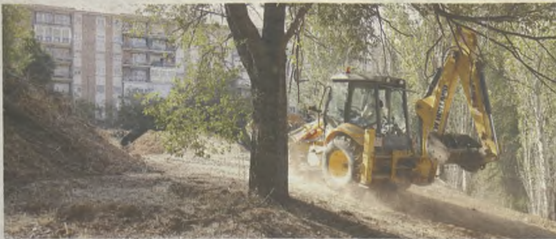
Las máquinas siguen su ritmo en el futuro Jardín de Las Torres.

El Ayuntamiento de Guadalajara ya iniciado los trabajos para recuperar el espacio degradado de la trasera de las calles Constitución y Alameda, y construir en él el Parque de las Torres, una superficie de algo más de 4.000 metros cuadrados en la que se instalarán juegos infantiles, áreas de descanso y de paseo, además de una rampa