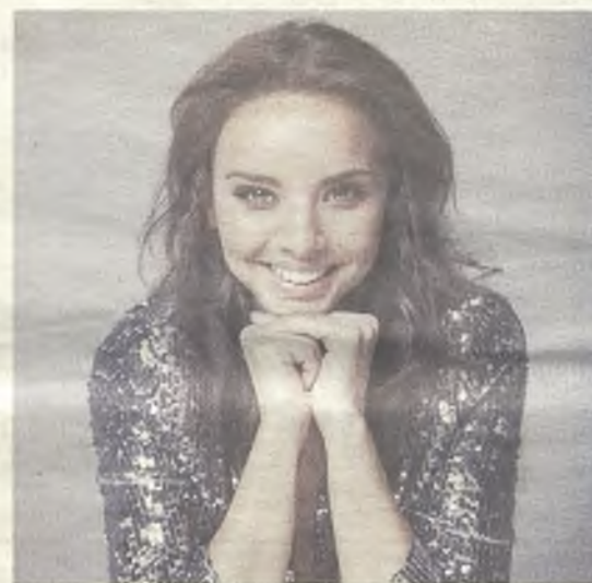
Chenoa actuará el 25 de octubre./Gu30D

Sábado 29 de noviembre. 20:00 h. El Lazarillo de Tormes. Teatro. Entrada: 15 y 12 euros.