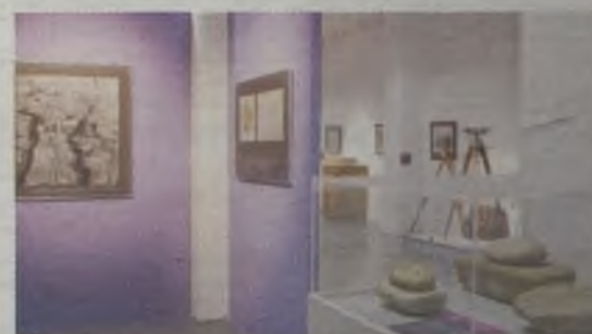
Guadalajara en la Historia./Gu30D

Para participar en estas visitas, que son gratuitas, hay que inscribirse previamente en las oficinas del Patronato Municipal de Cultura (edificio del Teatro Auditorio Buero Vallejo), de lunes a viernes, de 9 a 14 horas. Teléfono 949 247 050.