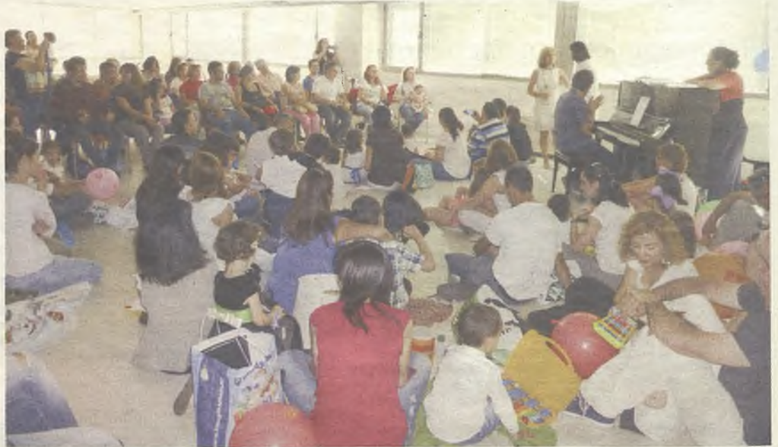
Esta actividad tiene una excelente aceptación.

Excepcionalmente para este curso, el primer trimestre de la actividad será gratuito. Durante el mes de noviembre, se informará a los participantes de la nueva tasa correspondiente al año 2015, que será de 8 euros al mes para los grupos quincenales y de 15 euros para los grupos semanales.