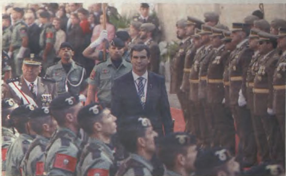
El Alcalde y el general de la BRIPAC pasaron revista.