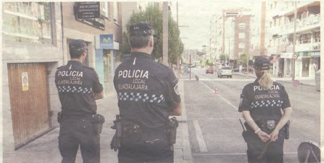
La Policía Local de Guadalajara verá pronto aumentada su plantilla.

el Alcalde ha valorado como positivo, teniendo en cuenta que se ha incrementado sensiblemente desde 2007, cuando se situaba en un 1,1.