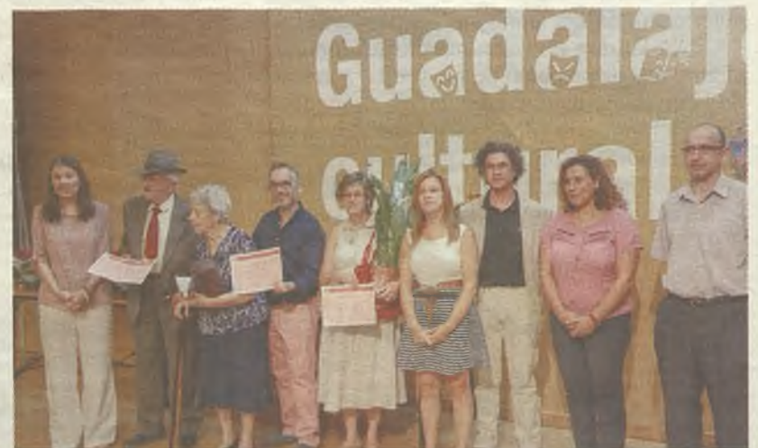
Los ganadores posaron con sus premios.