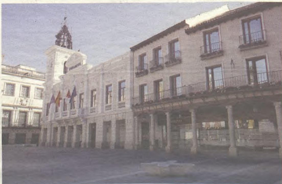
El pago fraccionado se puede solicitar en las oficinas municipales./E. Bonilla

El Ayuntamiento de Guadalajara diseñó este nuevo sistema para hacer más cómodo a los vecinos el pago de los siguientes impuestos y tasas municipales: Impuesto de Bienes Inmuebles (IBI), Impuesto de Vehículos de Tracción Mecánica, vados, Impuesto de Actividades Económicas y tasa por la prestación del servicio de recogida de basuras.