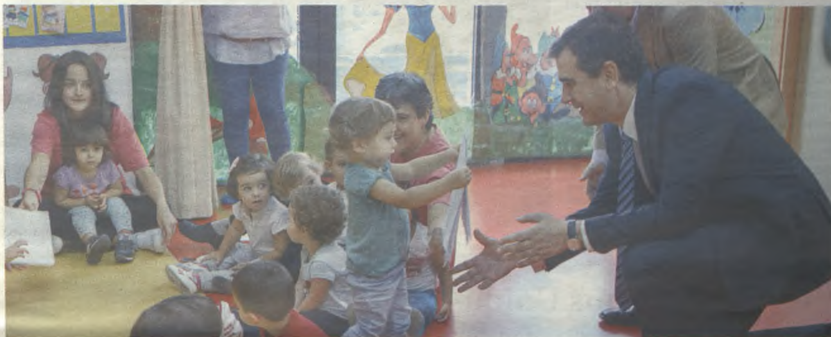
El Alcalde, durante la visita a la escuela infantil.

El Ayuntamiento oferta un total de 129 plazas, subvencionando con cerca de 93.000 euros al año este servicio