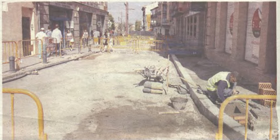
Ya ha comenzado la segunda fase de la remodelación de la calle Miguel Fluiters.

abastecimiento de agua en la Travesía de Minaya. Se espera que en unas semanas dé comienzo una nueva fase de obra que se centrará principalmente en la calle San Juan de Dios.