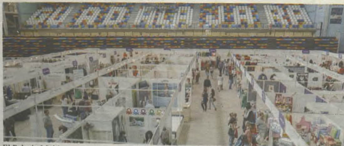
El Palacio Multiusos acogió la VIII edición de la Feria.

Según los datos aportados por las dos federaciones locales de comercio -FCG y Fedeco-, en esta edición el nivel de ventas se sitúa ligeramente por encima de los datos del año 2013.