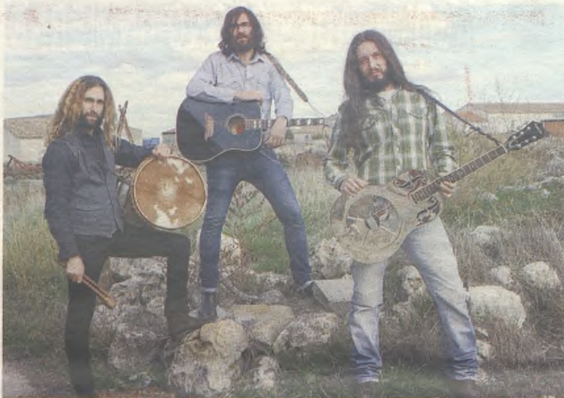
Arizona Baby, de nuevo en Guadalajara, de la mano de Las Noches 0,0%./Gu30D