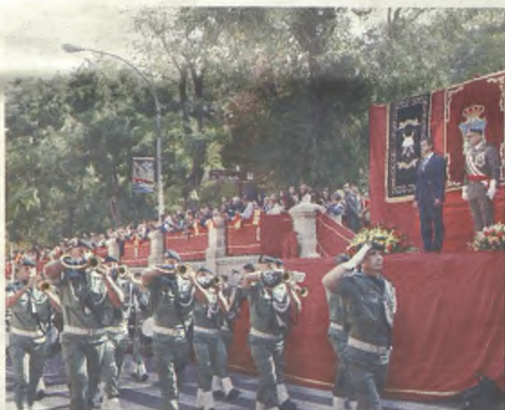
El Alcalde presidió el acto./J. Ropero

Tras el turno de intervenciones, se realizó un acto a los caídos, seguido de gritos y el ideario paracaidista. Mientras se entregaban los certificados de juramento o promesa entre los participantes, los vecinos de Guadalajara pudieron disfrutar del concierto de música militar que se ofreció en el templete de La Concordia.