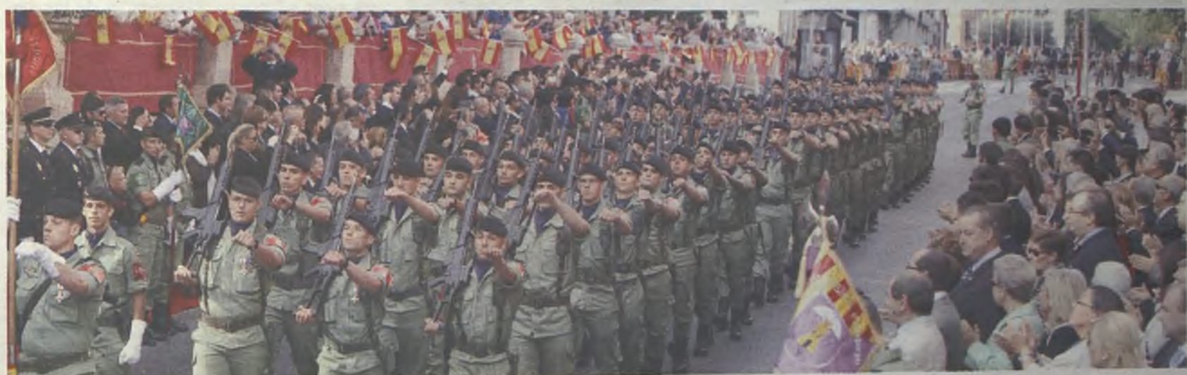
La Brigada Paracaidista Almogávares VI./E.B.