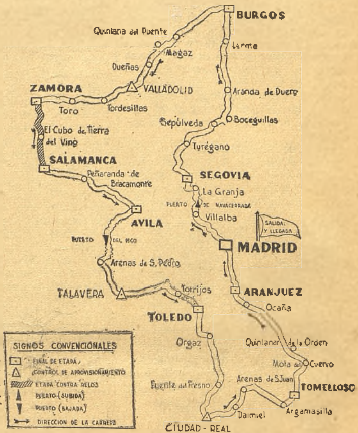
GRAFICO DE LA VUELTA A CASTILLA, ANTES DE VARIAR LA NOVENA Y PENULTIMA ETAPA

go con motivo de la llegada y control en Ciudad Real? ¿Y los accesos? No queremos acordarnos de la llegada de