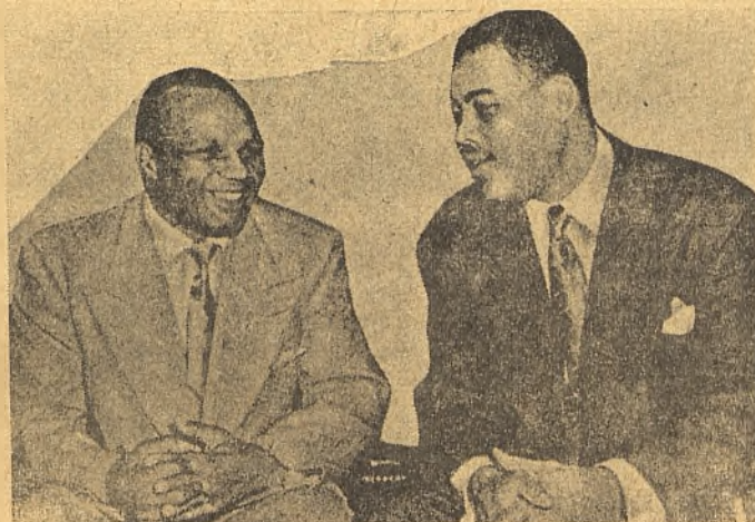
HE AQUÍ A LOS DOS NEGROS RIVALES Y AMBOS CAMPEONES MUNDIALES, JOE LOUIS Y JOE WALCOTT, CHARLANDO AMIGABLEMENTE'

Este caso promovió mucho ruido en Italia, donde se preguntaban qué sucedería al impulsivo internacional. La sanción ha sido de las más graves. Por otro lado, la Policía también ha intervenido, puesto que hubo agresión... En fin, unas bonitas vacaciones. Pero más largas las de ahora, pues ha sido suspendido indefinidamente.