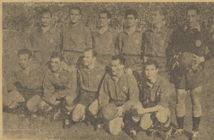
SELECCION NACIONAL ESPAÑOLA.

Chuchi, el Director de "Juventud" andaba cerca de nosotros. Le preguntamos al terminar el primer tiempo: