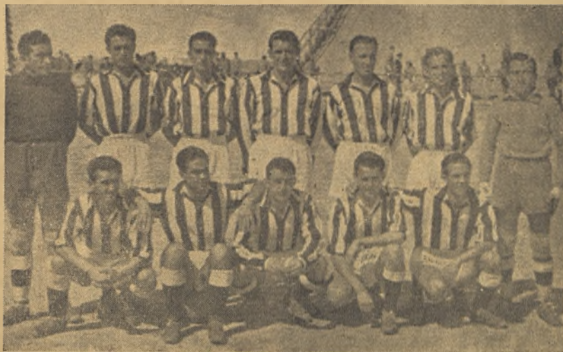
El C. D. Badajoz, líder de la actual temporada.