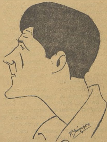
Ríos, caricatura de P. Sánchez.

Comenzó a jugar al fútbol en equipos modestos de la capital gallega, principalmente en el Deportivo Ciudad. Fichó como profesional, por primera vez, con