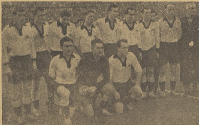
EQUIPO ALEMAN QUE EMPATO EN CHAMARTIN.

demos traer otras, si se quiere más modestas, pero más nuestras, por ser de personajes de sobra conocidos entre los aficionados manchegos. Y estas sí que no nos las "pisa" nadie.