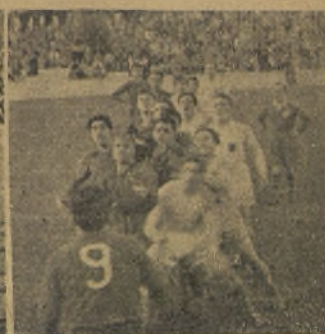
A la izquierda, saltan los equipos al campo con sus capitanes al frente.—A la derecha, dos "melées" en el partido de rugby España-Alemania que ganaron los alemanes. (Información en página 9).