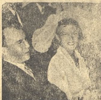
Ali Khan aparece aquí con Rita Hayworth, su última ex esposa.

las más conocidas "estrellas" y los más famosos "astros" de Hollywood. La cena y la fiesta que siguió al ágape, transcurrieron alegremente. Un centenar de camareros y "barmans" se encargaron de servir, en cuatro bares distintos, más de cincuenta cajas de licores diversos. Marión Davies recibió a sus invitados y cuidó todos los detalles de organización y desarrollo de la fiesta, mientras lucía joyas que los expertos valoraron en un