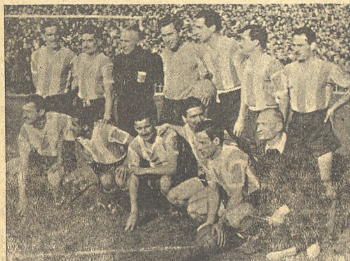
La selección argentina que jugó en Cha Martín en Diciembre.

El Estadio es una gran palangana, rodeada de graderío descubierto. Las únicas tribunas cubiertas se encuentran en lo alto del Estadio, detrás de las metas. El partido empezaba a las tres y media.