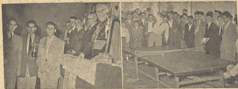
He aquí al Obispo Prior haciendo entrega de los trofeos deportivos del Día del Joven de A. C. y un momento del campeonato de Pim-pon.

El 17 de Mayo, con motivo del "Día del Joven", se celebraron los campeonatos provinciales diocesanos de Pim-pon, los cuales se celebraron en el salón de actos del Seminario, participando doce equipos; ocho de la provincia y cuatro de la capital. Pasaron a la semifinal Acción Católica de Ciudad Real con