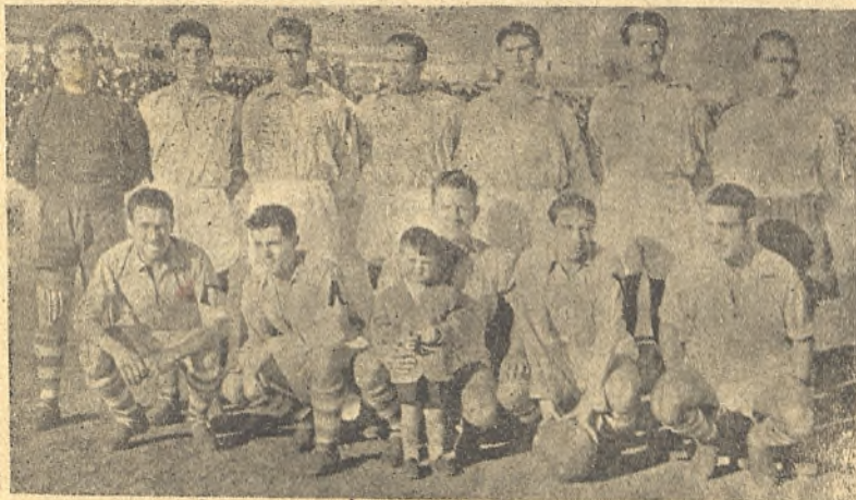
Una de las fotos del Toledo del año actual.

Siempre jugó de delantero y posee inteligencia y conocimientos del fútbol.