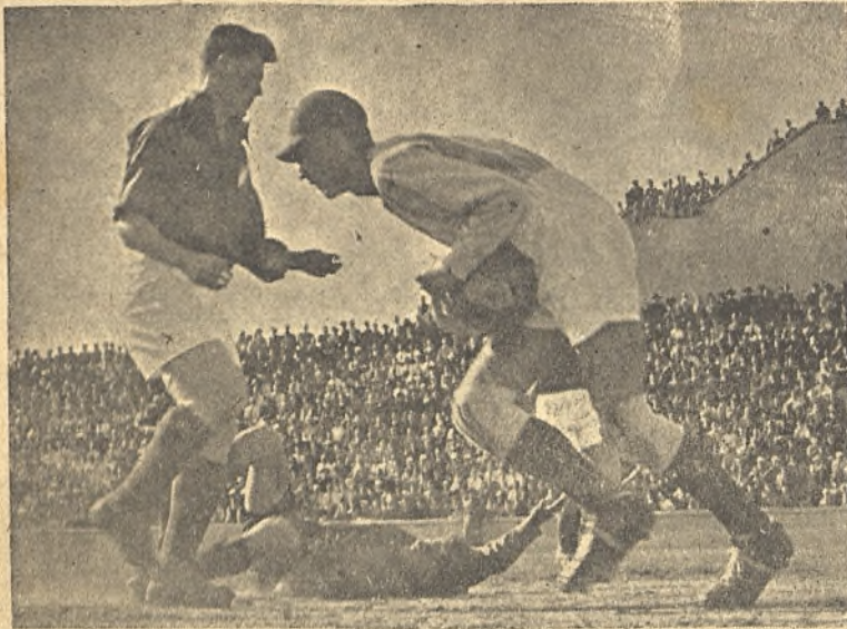
Una jugada del choque entre los escolares de Francia y España, que finalizó con el triunfo español por 7-1. Obsérvese al delantero centro español, en el suelo, debido al ímpetu que dió a la jugada.

Al fútbol juvenil se le va dando la importancia que merece. Hay ya un campeonato nacional en marcha y, durante dos años, hemos acudido al torneo internacional de la especialidad, en el cual, el año pasado, quedamos campeones y, este año, hemos hecho un buen papel en Bélgica, cortada nuestra carrera de triunfos por la parcialidad del árbitro en el partido contra Yugoslavia.