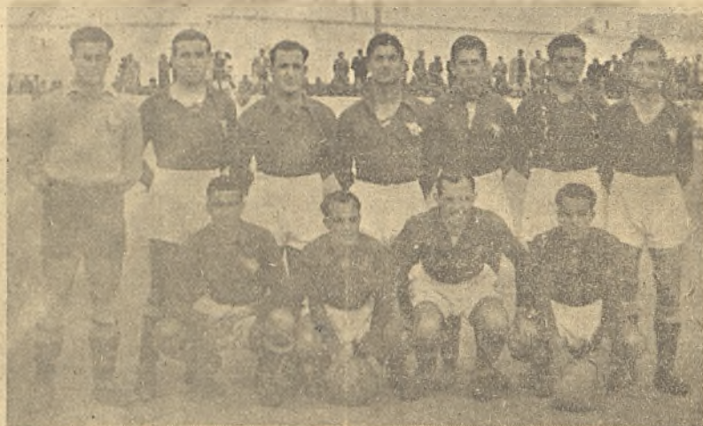
El C. D. Vaidepeñas del domingo

de que no le ha salido una sola jugada a derechas. Pero nosotros que sabemos lo que lleva dentro, esperamos que a no tardar nos haga el partido que debe a la afición. Y Jaro, que el domingo no pudo "inventar" ningún gol, se calla. No le han salido las cosas a medida de sus deseos. Otra vez será.