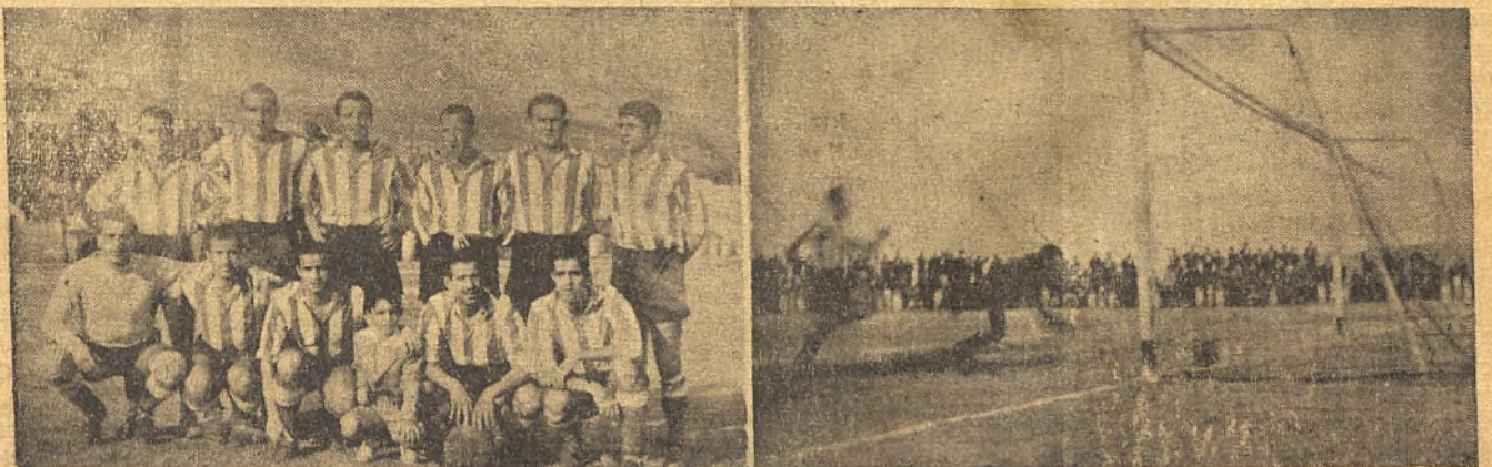
El Calvo Sotelo, que goleó al Conquense y uno de los goles de Brígido. La foto movida por la rapidez de la jugada, nos muestra este espléndido tanto.