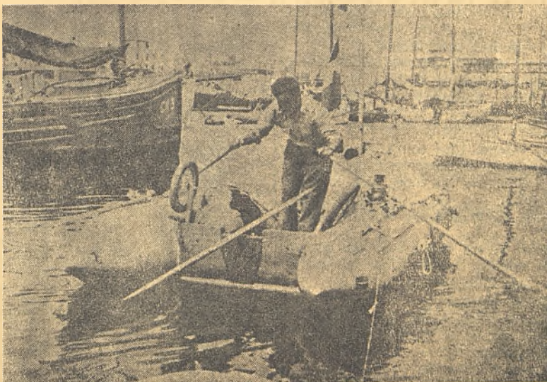
Este es "L'Herétique", el bote de goma de Bombard, en el que atravesó el Atlántico

fuerzo, atravesó el Océano Atlántico, el primer "náufrago voluntario" que acertó a llegar a tierra de continente a continente, luchando contra la pulmonía y la desesperación que son las dos plagas que suelen flagelar a los hombres abandonados a su suerte en medio de las aguas.