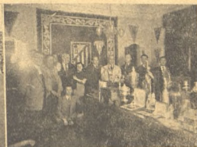
La peña atlética de Manzanares pasea una pancarta por el Metropolitano y admira los trofeos de su Club en Madrid.

cuentro como a la ocupación de plaza en cómodo autocar.