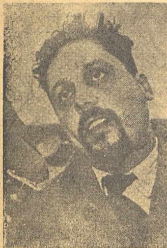
El Dr. Bombard, después de su hazaña, flaco y exhausto.

quista del Atlántico, a menudo en embarcaciones inverosímiles La historia nos refiere que, hace más de cinco siglos, un extraño personaje que respondía a la traza étnica de los indios, desembarcó en un punto de la costa mediterránea española. Los encargados de relatar los hechos más notables de aquella época cuentan que era un hombre corpulento y extraño; por supuesto que no hablaba una palabra de castellano ni ningún idioma de los entonces conocidos de los españoles. También, como Bombard, conocía el secreto del Atlántico y, a bordo de un árbol hueco, a semejanza de las embarcaciones que, todavía en nuestro