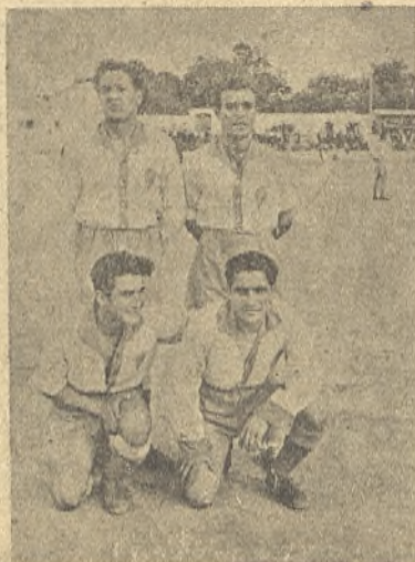
Los cuatro jugadores a prueba