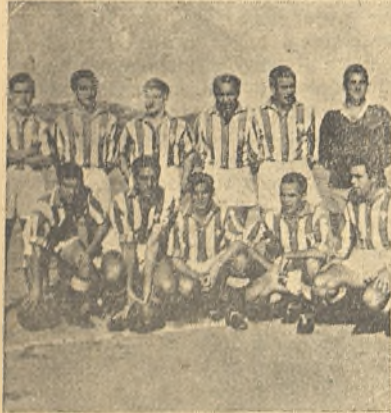
EL C. D. CORDOBA

CORDOBA.—(Servicio especial).—Se ha jugado el último partido de la liguilla de ascenso entre el equipo local y el de Puertollano. El encuentro tuvo poco interés. El Córdoba estaba ya virtualmente descendido y el Calvo Sotelo no podía ascender. Asistió poco público. Sólo se jugaba la negra honrilla de que-