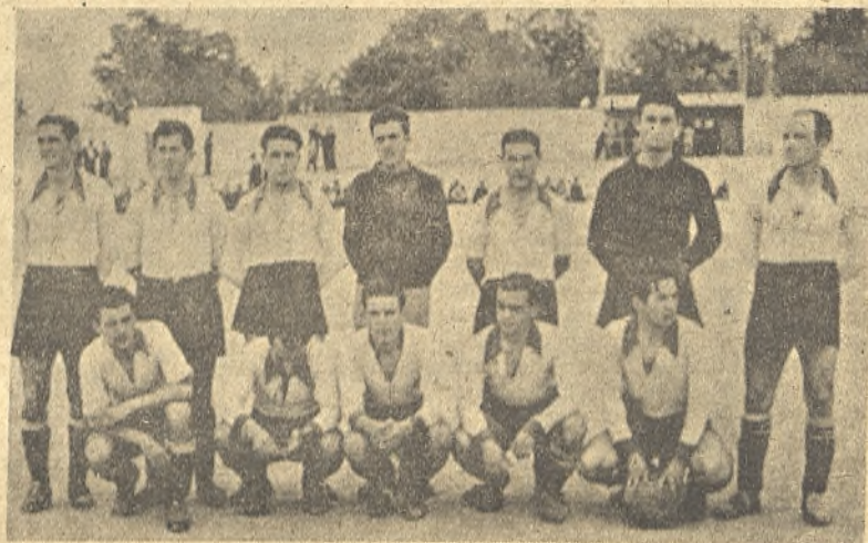
Una de las fotos más recientes del Herencia C. F.

—Me alegro de que me hagas esa pregunta, porque quiero aclarar las cosas y desmentir cuanto se há dicho a este