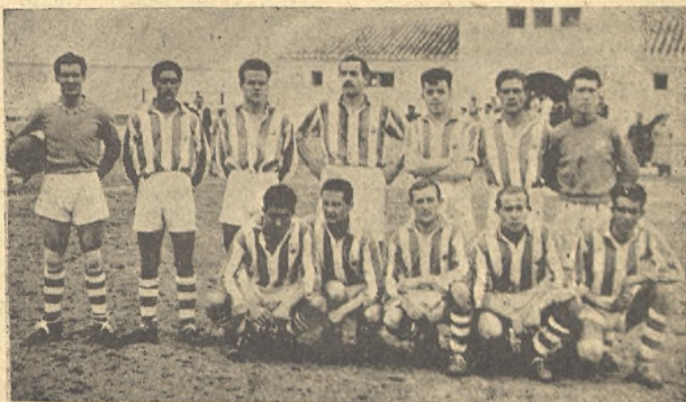
El C. D. Bolañego de esta temporada. (Foto Archivo).

—¿Pensáis celebrar partidos amistosos durante el verano?