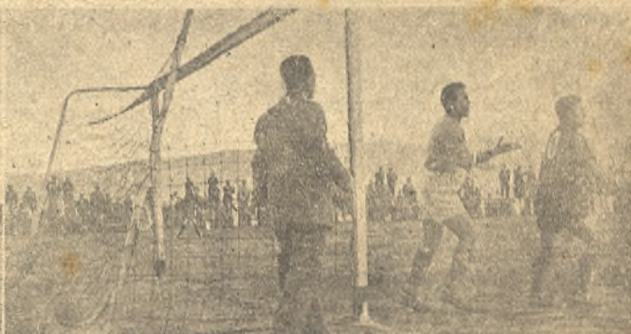
Arriba: El España de Tánger y la entrega de un banderín en presencia del señor Casal, desdichado árbitro del encuentro. Abajo: Los dos goles locales, el del penalty y, el segundo, protestado por los visitantes.