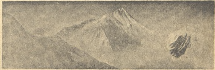
El imponente pico del Everest, siempre cubierto de nieve.

gran obstáculo de aquellas grandes alturas. Está también la nieve, la violencia terrible del viento y el frío intensísimo del Himalaya. Téngase en cuenta que a 8,000 metros el aire contiene la tercera parte de oxígeno que al nivel del mar, lo que supone una acusadísima dificultad para respirar. La nieve, y aún peor el hielo, hace el piso sumamente resbaladizo y en cada paso que se da hay un peligro efectivo de muerte. Por lo que se refiere a los vientos, bastará decir que una velocidad de ochenta kilómetros, en tales alturas, representa la normalidad, siendo frecuente que incluso sobrepasen los doscientos kilómetros. En cuanto al frío, la temperatura es en verano de veinte grados bajo cero. En semejantes condiciones bien se comprenden los tremendos sacrificios que exige la ascensión.