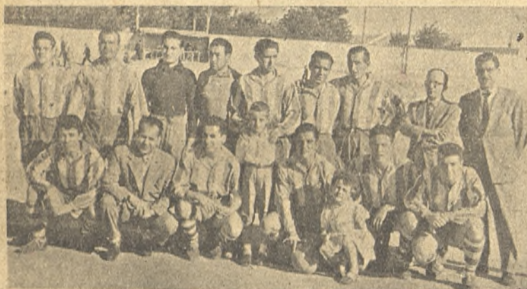
El O. D. Ferrocarril,

Después del Ferrocarril, el Daimiel y el Manzanares (nombres de vieja solera futbolística provincial) fueron los más destacados. Entre estos tres equipos ha estado la pugna y los demás han bajado mucho en relación con ellos. Registramos como doloroso el abandono de