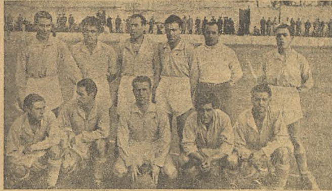
Equipo del Manzanares C. F., subcampeón provincial de aficionados.