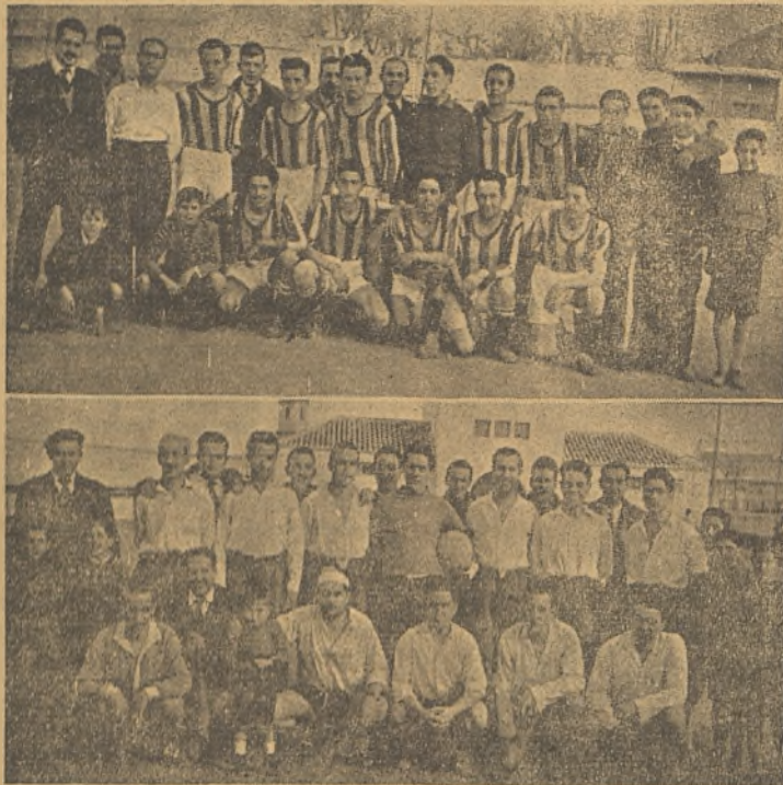
Días pasados, los empleados ferroviarios de la capital, celebraron un partido amistoso: He aquí a los dos equipos en el Estadio.