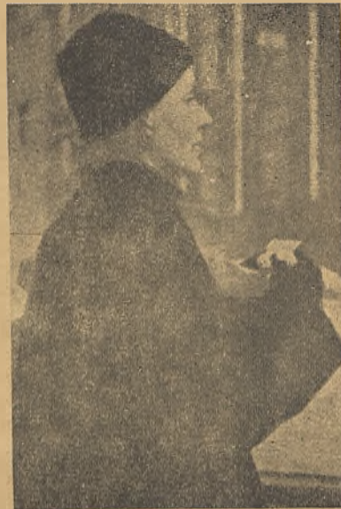
La más reciente foto de Greta Garbo

su empeño convertirla en lo que es. Es algo así como si hubiera presentado al mundo —una sana campesina disfrazada de espía internacional—. Se le ha dado una caza sin cuartel hasta lograr que durante semanas enteras se escondiera